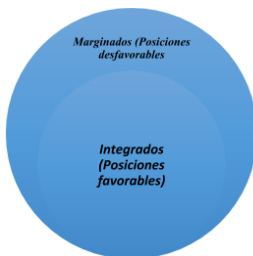
Ilustración 4 - Visión crítica - una sola sociedad