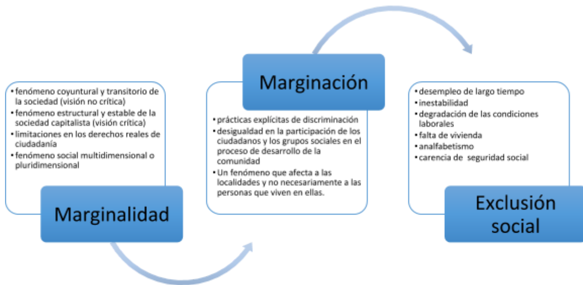
Ilustración 5 - Características Marginalidad, marginación y exclusión social.

De acuerdo con Cortés, “confundir marginación con marginalidad implica: a) considerar iguales conceptos con raíces teóricas distintas, que organizan conjuntos de hechos distintos de acuerdo con diferentes teorías, y b) mezclar los referentes empíricos cometiendo así falacia ecológica.” (2002, P. 80)