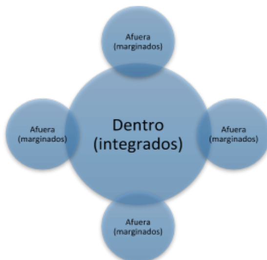
Ilustración 3- Visión no crítica, dualidad.

Fuente: De la marginalidad a la exclusión social: un mapa para recorrer sus conceptos y sus núcleos problemáticos. Enríquez, 2007.