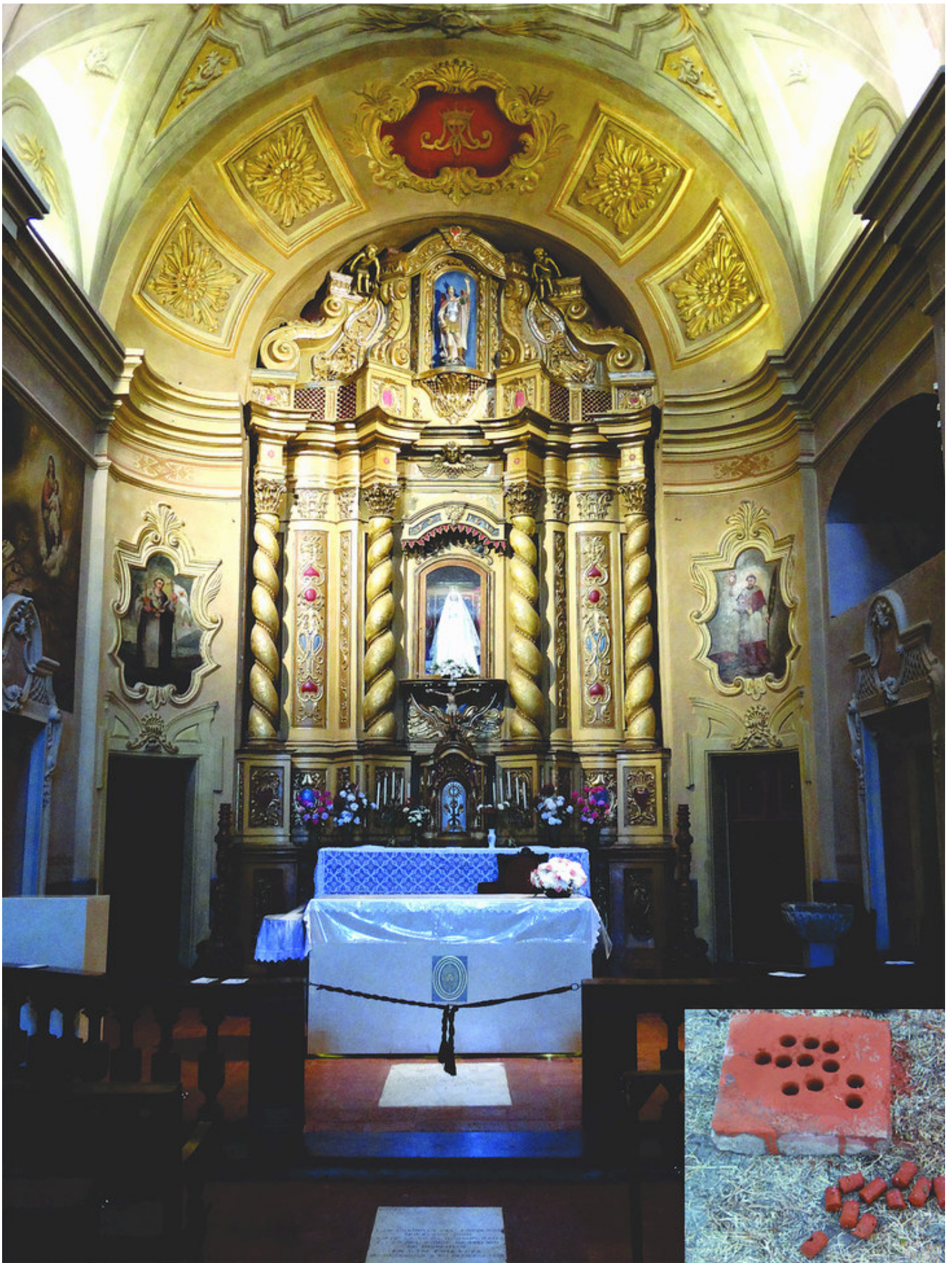
Figura 2. Interior de la parroquia Nuestra Señora de la Merced con la fotografía de la baldosa analizada.