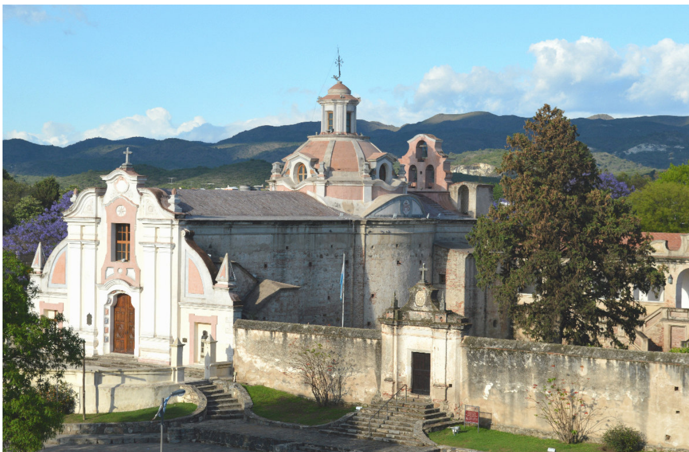
Figura 1. Vista general de la parroquia Nuestra Señora de La Merced.

1 Centro de Investigaciones en Física e Ingeniería del Centro de la Provincia de Buenos Aires (CIFICEN, UNCPBA-CICPBA-CONICET), Tandil, Argentina; 2 Centro de Investigaciones y Estudios sobre Cultura y Sociedad del Consejo Nacional de Investigaciones Científicas y Técnicas, Universidad Nacional de Córdoba, Argentina (CIECS-CONICET/UNC); 3 Servicio Arqueomagnético Nacional y Laboratorio Interinstitucional de Magnetismo Natural, Instituto de Geofísica, Universidad Nacional Autónoma de México, Campus Morelia, México; 4 Universidad de San Luis, CONICET, Argentina; 5 Instituto de Geociencias Básicas, Aplicadas y Ambientales (IGEBA, UBA-CONICET)