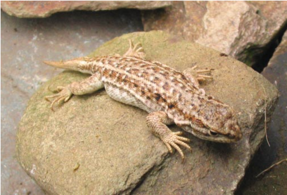
Figura 3: Hembra de L. orko en vista dorsal, de Puesto la Lagunita, Sierra de Fiambalá, Provincia de Catamarca, Argentina.