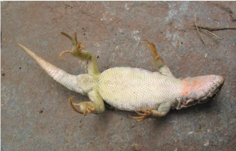
Figura 4: Hembra de L. orko en vista ventral, de Puesto la Lagunita, Sierra de Fiambalá, Provincia de Catamarca, Argentina.