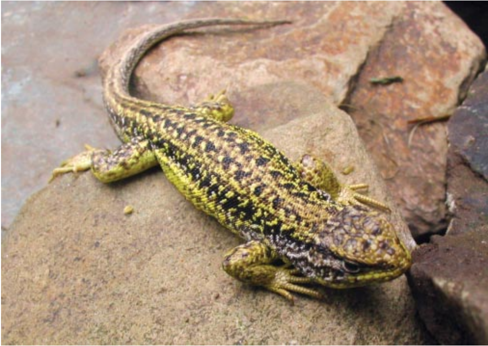
Figura 1: Macho de L. orko en vista dorsal, de Puesto la Lagunita, Sierra de Fiambalá, Provincia de Catamarca, Argentina.