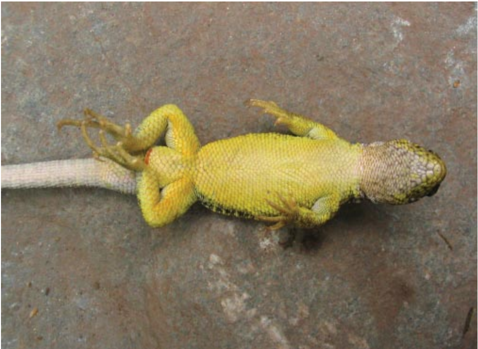
Figura 2: Macho de L. orko en vista ventral, de Puesto la Lagunita, Sierra de Fiambalá, Provincia de Catamarca, Argentina.