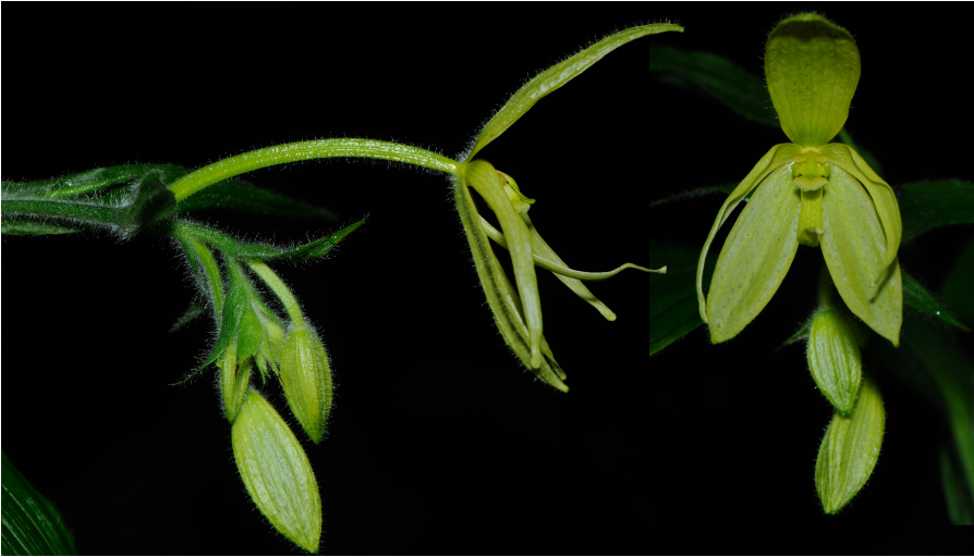
Fig. 3 : Selenipedium chironianum