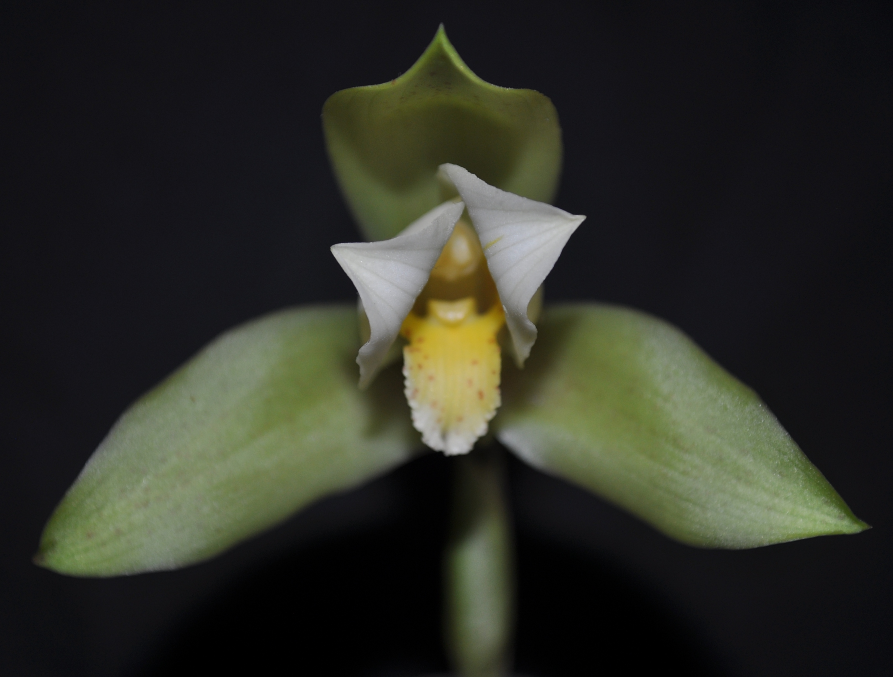
Fig. 1 : Lycaste annakamilae