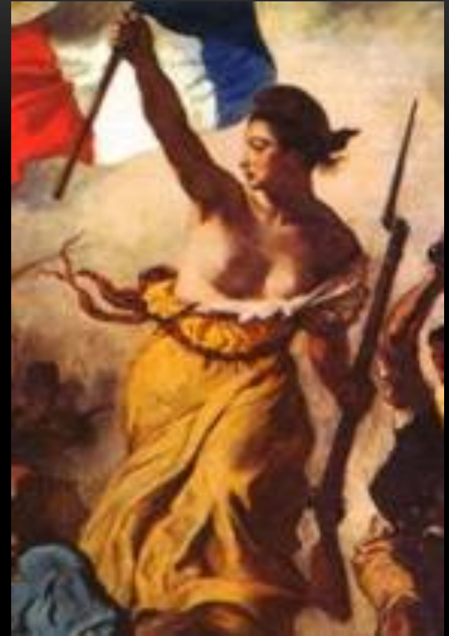
Frihet på Barikaden