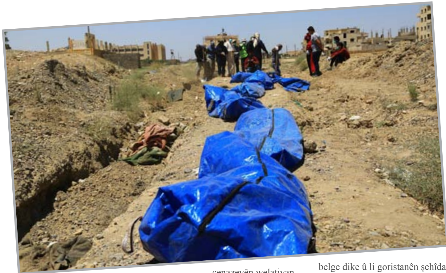
Di gorên komî de cenazeyên zarok, jin û ciwanên ku çeteyan ji xwe re kiribûn mertalên zindî, hene. Ji destpêka rizgarkirina Reqayê jî hêla QSD'ê ve, Yekîneya Bersivdariya Yekemîn hezar û 238 cenaze derxistine. Li gorî belgeyên yekîneyê, welatiyên bajêr 117 daxwaznameyên cenazeyan pêşkêş kirin, lê yekîneyê tenê 17 cenaze derxistine. Ji bo avêtibûn goran.

bû û gihişt 40 endaman. Di nava endamên yekîneyê de 4 bijîşk hene. Peywira sereke ya vê yekîneyê ew e ku cenazeyên welatiyên sivil ku çeteyên DAIŞ'ê bê ser û ber li herêmê binax kirine, derxe û bi awayekî guncaw li goristanan bispêre axê. Yekîneyê di bajarê Reqayê de 4 gorên komî dftin, gora Parka Lawiran, gora El-Reşîd a li paş dadgeha kevn a bajêr û heta niha 600 cenaze li van goran hatine veditin û belgêkirin. Li gora Panorama û gora Bexdayê jî 500 cenaze hatine dftin û belgêkirin. HÊJMARA CENAZEYAN NAYÊ ZANÎN Çeteyên DAIŞ'ê li gelek navçe û deverên bajêr li nêzî gulistan, parka lawiran û listokgehan, çalên bi awayekî paralel kolandibûn û cenazeyên sivil bê ser û ber avêtibûn goran.