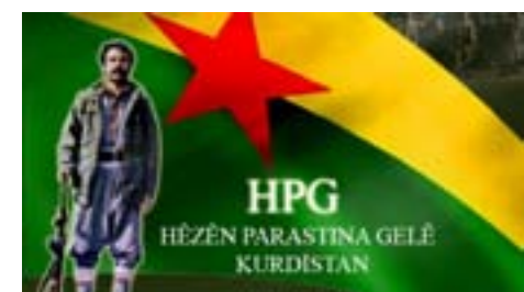
Roja 21'ê îlonê artêşa Tirk a dagirker piştî ku bi helikopteran bombe li qada Navsera Cûdî barandin, bi helikopteran leşker danin herêmê û dest bi operasyonê kir. Operasyon 22'ê îlonê bêencam bi dawî bû.

leşkerên dijmin ên di vî şerî de hatin cezakirin û birîndar bûyî nehat zanin. Piştî ku hêzên me bi serketî jî kemînê derketin, artêşa Tirk a dagirker 16'ê îlonê leşkerên xwe danin herêmê û dest bi operasyonê kir. Operasyonê heta 21'ê îlonê demam kir û bi rengekî bêencam bi dawî bû.