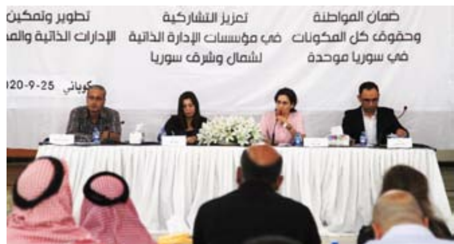
ziya sponsorên wan civînaan (Cinêv, Astana û Soçî) di dirêjkirina temenê aloziyê de nişan dide." Tê payîn panel bi gotûbêjkirina mijarên diya-