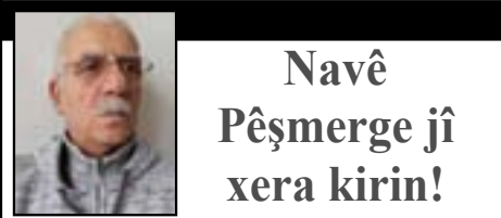
Navê Pêşmerge ji xera kirin!