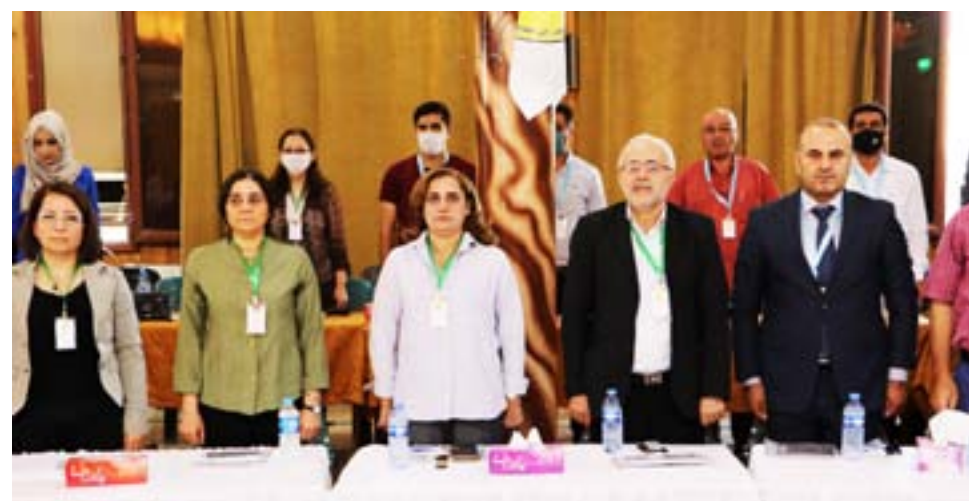
Ocalan, her wiha dagdeheke navneteweyî jî bo darizandina çeteyên DAÎŞ'ê. Konferans bi hilbijartina 7