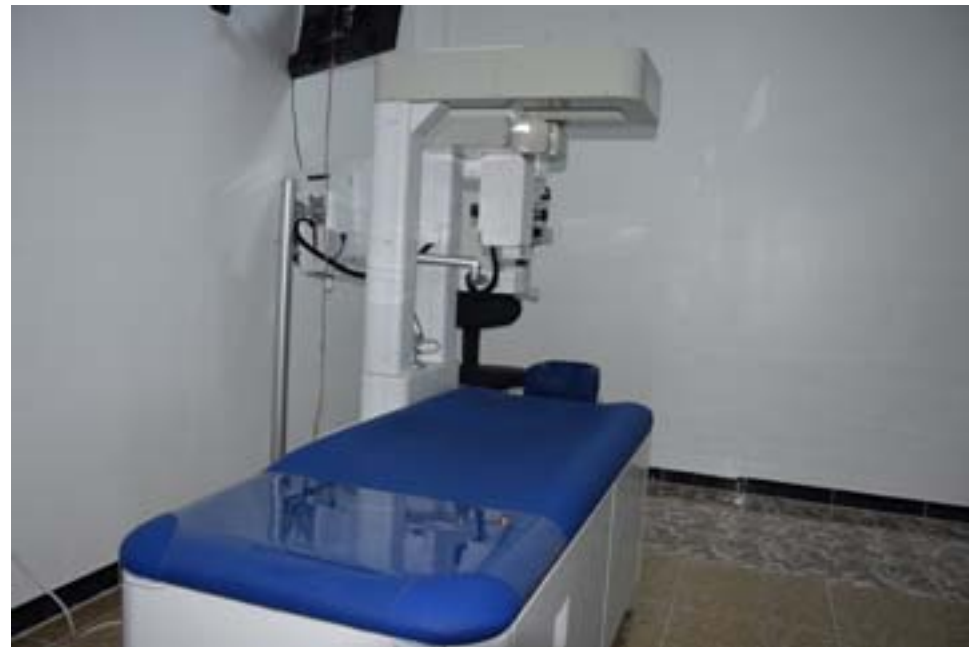
cîhaza (Phaco) ê ji bo rakirina madeya spî ji çavan, cîhaza (Osset) ê kişandina tora çavan, cîhaza (Corneal topography), cîhaza (Saha Basariyê) û cîhazeke din a çavan hene. Nexweşxaneyeya Dil û Çavan