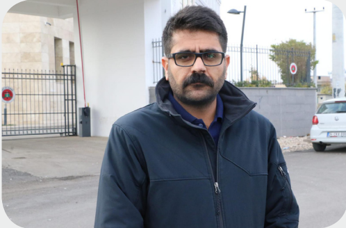
'Li Tirkîyê civak tê darizan-din'