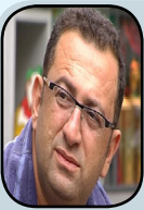
Li zindanan hiqûqa dijminatîyê