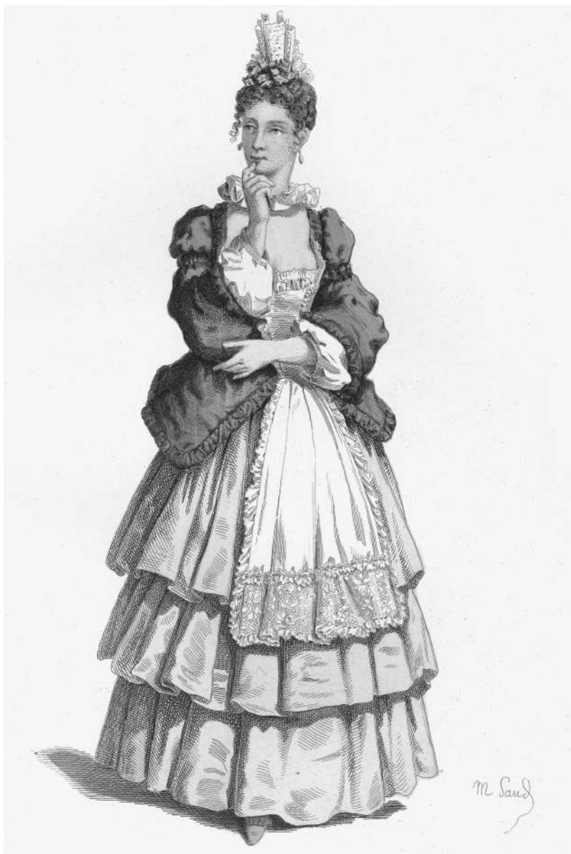
Máscaras e bufóns da commedia dell'arte : Colombina. Deseño de Maurice Sand gravado por A. Manceau, 1862.