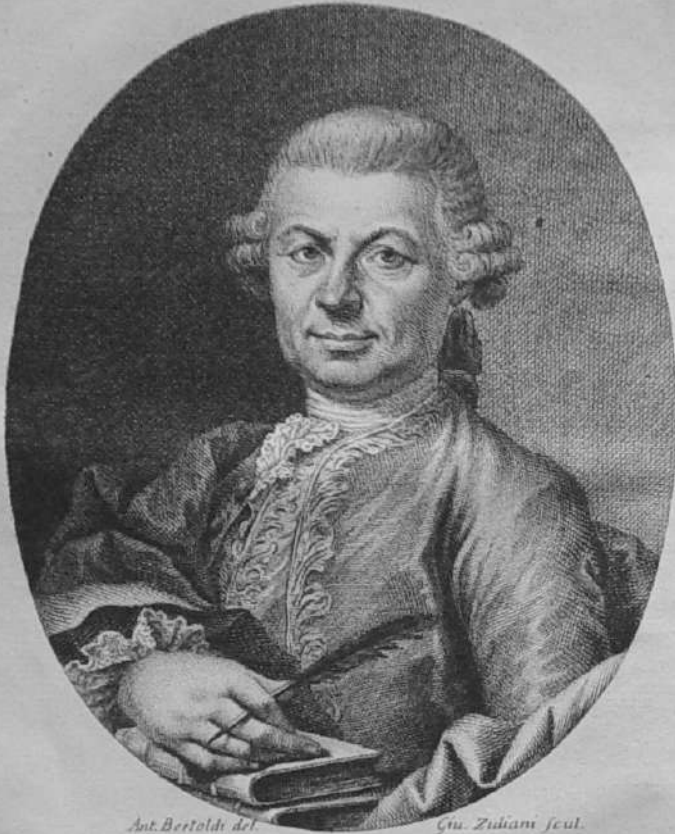
CARLO GOZZI (Venecia, 1720-1806)