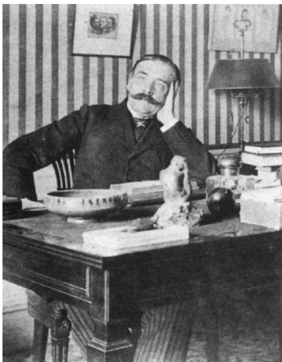
Octave Mirbeau (1848-1917).