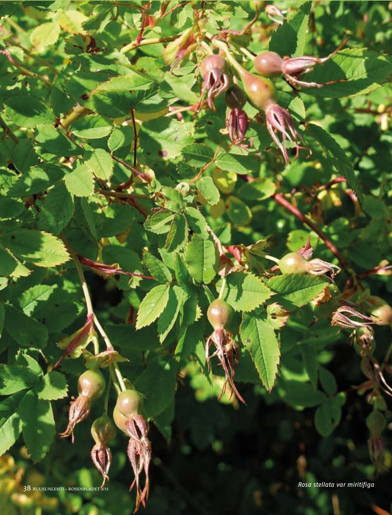
Rosa stellata var mirifiga