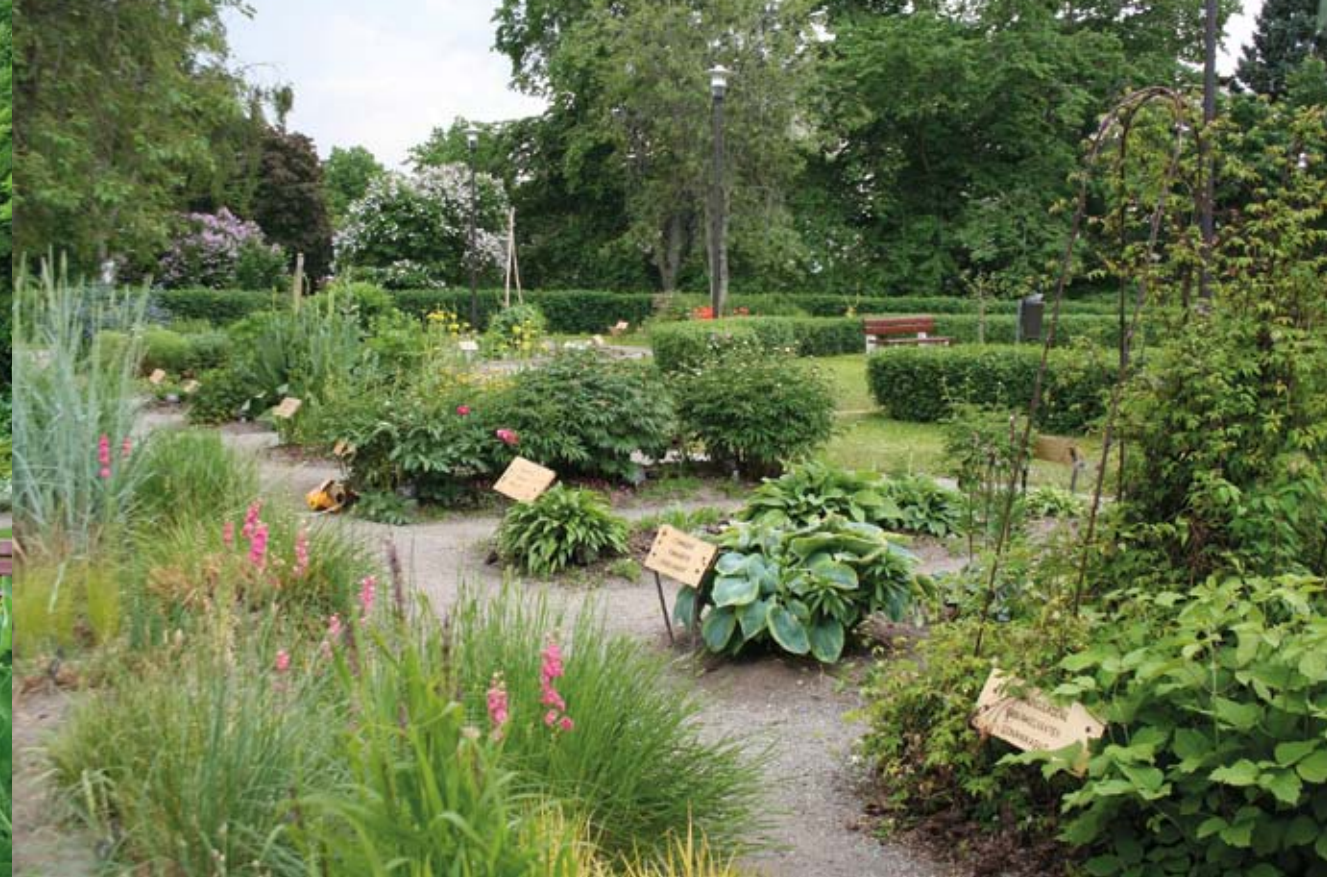
Systemaattinen osasto / Den systematiska avdelningen