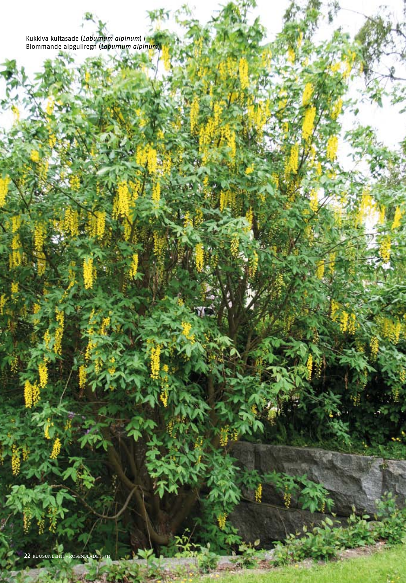
Kukkiva kultasade ( Laburnum alpinum ) / Blommande alpgullregn ( Laburnum alpinum )