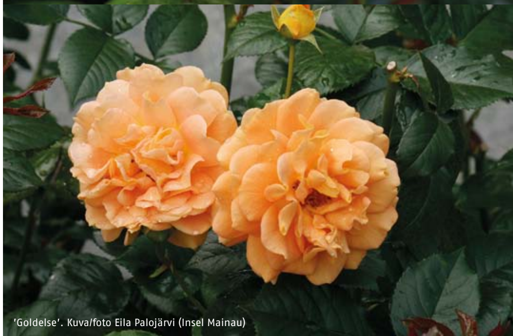
'Goldelse'. (Insel Mainau)