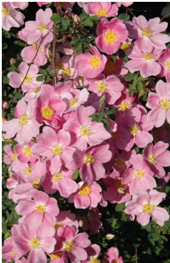
'Punainen Harison'.

Alkukesän helteestä innostuivat vattukärsäkkäät taittelemaan nappuja ja jouduin kolmesti ennen kukintaa ruiskuttamaan yleistorjunta-aineella. Silti ne tekivät kiusaa erityisesti vähänuppuisissa ruusuissa. 'Alchymist' (sinänsä liian arka) olisi kukkinut ensimmäisen kerran sitten Viron matkan, mutta vattukärsäkkäät tuhosivat sen nuput jo nuppineulanpään kooisina, että vain yksi nappu jäi. Olisiko kellään tietoa myrkyttömistä keinoista torjua mokomaa 1 mm koista tihulaista? Muutamasta pensaasta ne voi toki varistaa johonkin astiaan ja nitistää. Muistan kuulleen joltakin jostain valkosipulihajusteesta – toimineeko? Kertokaa ihmeessä jos tiedätte hyviä keinoja torjuntaan!