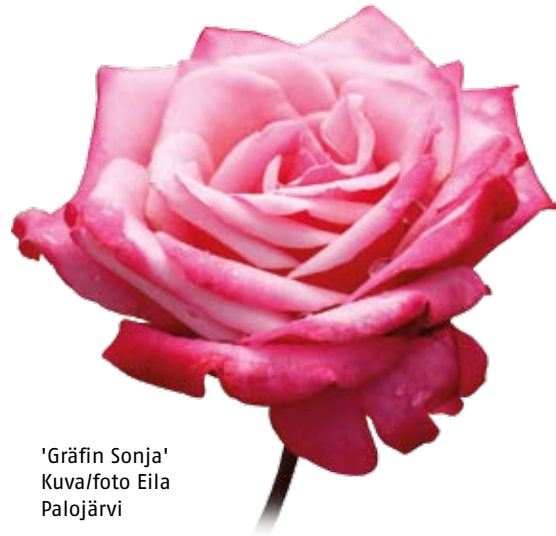
'Gräfin Sonja'

Puheenjohtaja Lauri Korpijaakko kertoo ruusujen kukinnasta ja selviytymisestä talven ja kevään oikukaiden säiden jälkeen. Ruusua ei kannata puheenjohtajan mielestä mainostaa helppohoitaisena, jos sen on hyvin sitonut seinustalle ja sitten yrittää poistaa piikisiä kuolleita oksia, niin naarmuilta on vaikea välttyä.