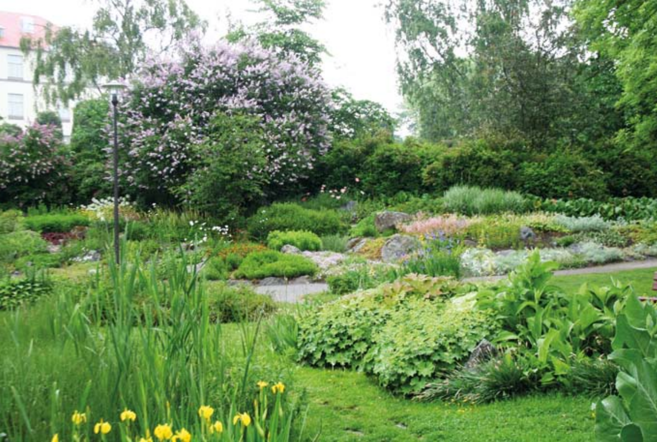
Kivikkoistutuksia / Stenpartiplanteringar