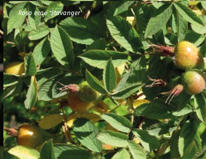
Rosa ecae 'Stavanger'