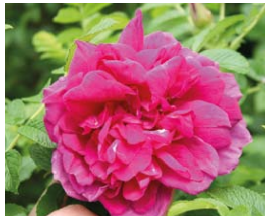
'Rosaie de l'Haj'