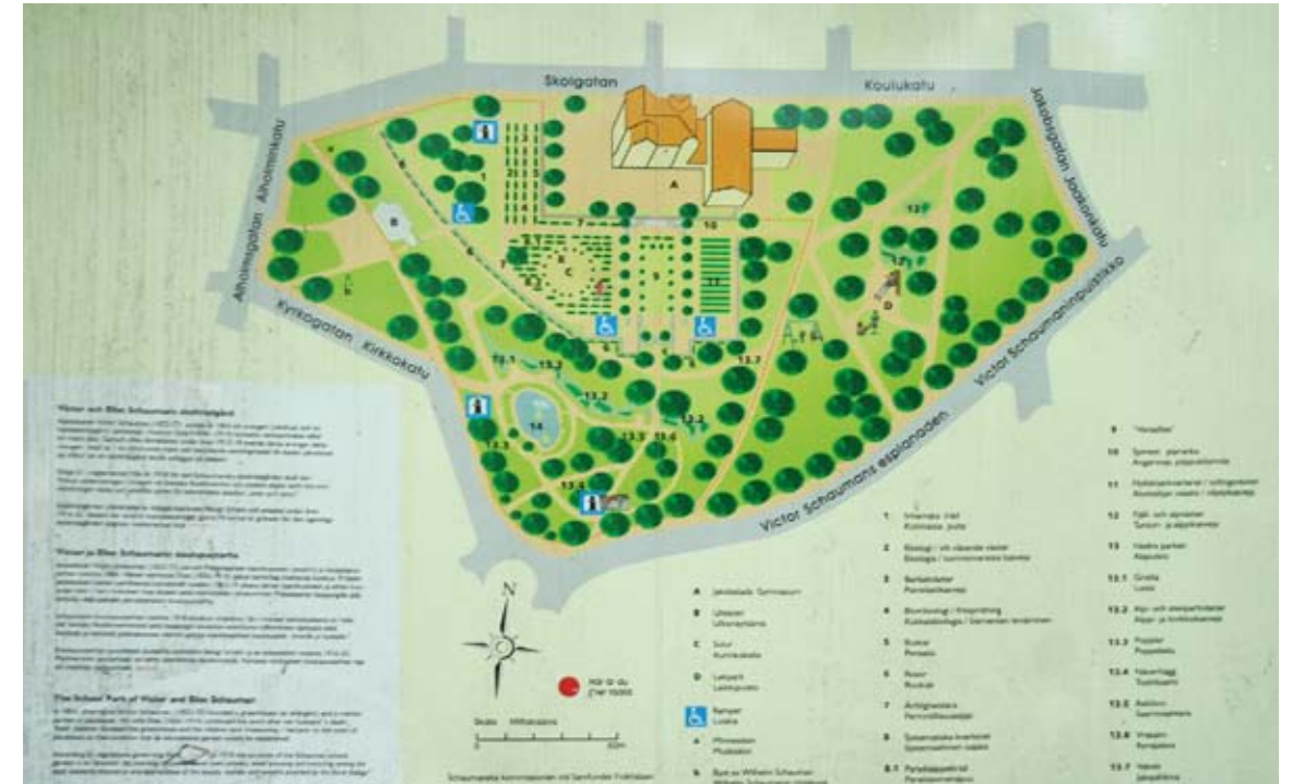
Puistossa oleva kartta. / Karta över parken.