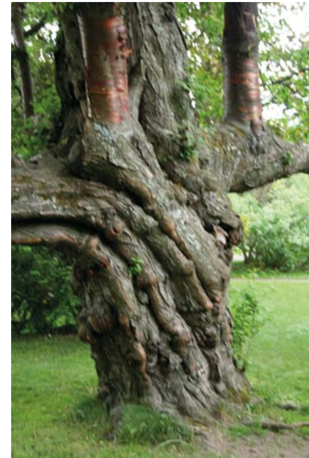
Komearunkoinen tuohituomi ( Prunus maackii ).