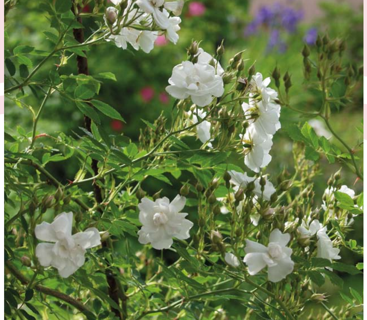
En blommig doft är basdoft hos bl.a. den finska klätterrosen, 'Pohjantähti'. Suomenköynnösruusulla on kukkaistuoksu.

Den främsta orsaken varför rosorna doftar är att locka till sig och styra pollinerare. Den sekundära uppgiften hos dofterna eller hos de avdunstande äm-