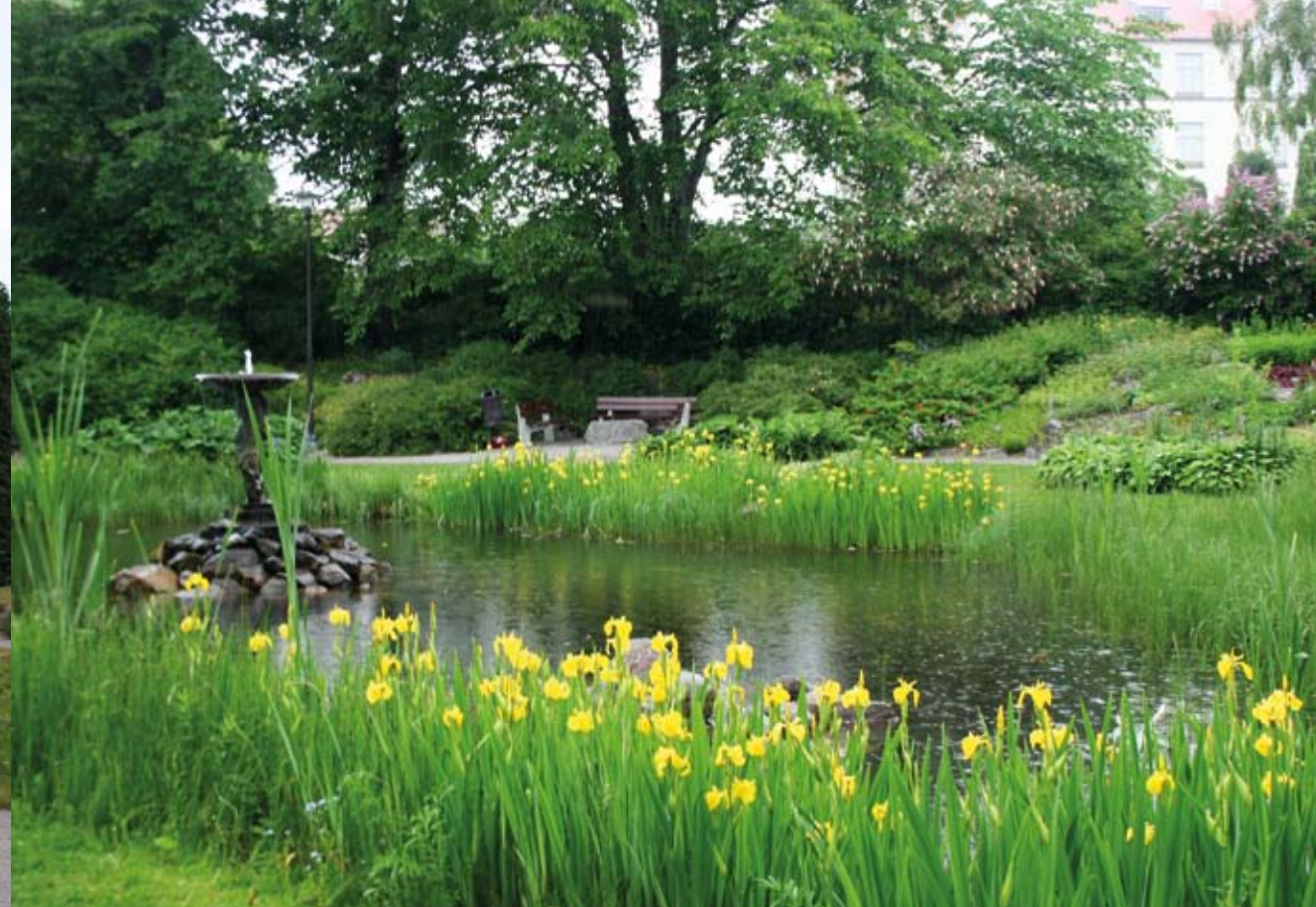
Kalalammikko ja suihkulähde. / Fiskdammen och springbrunnen.

Koulupuutarhan rakentaminen aloitettiin 1919 ja se valmistui vuonna 1932. Varat puistoon lahjoitti