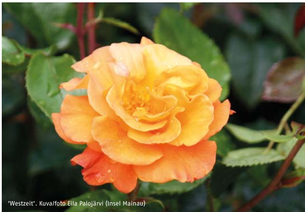
'Westzeit'. (Insel Mainau)