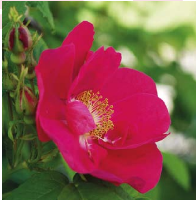
Valamonrosen Rosa 'Splendens' blad har en oangenäm doft av svamp och hö. Valamonruusun lehdissä on epämiellyttävä sienen ja heinän tuoksu.

Taija Savilaakso, hortonom (AMK) Översättning Andrea Standertskjöld-Nordenstam