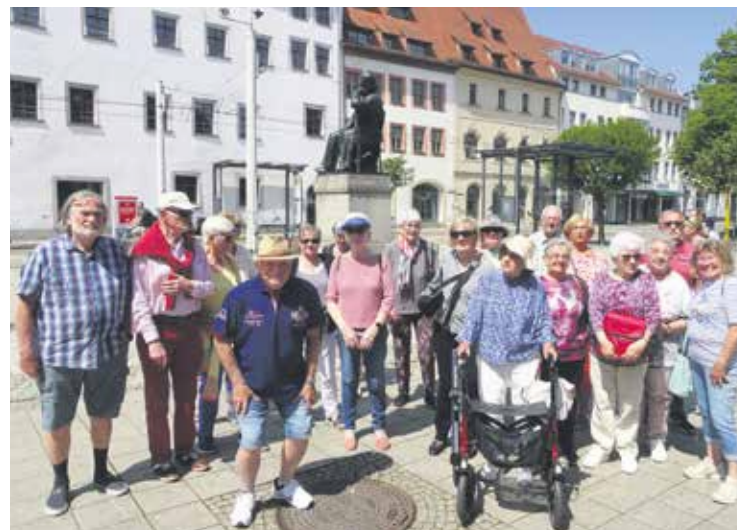
Die Reisegruppe posierte in Zwickau vor dem Robert-Schumann-Denkmal.

Die Besichtigung der Burg Neuenstein, die „kleine Schwester“ der Wartburg und des „Dicken Heinrich“ war leider nicht barrierefrei und damit nicht allen Mitreisenden möglich. Dafür konnten sich alle in Wiehe über eine gigantische Modellbahnausstellung auf 12.000 qm unter dem Titel „Kultur mit Pfiff“ freuen. Verschiedene Regionen Deutschlands, Amerikas und Europas konnten im Kleinformat bei laufendem Zugbetrieb betrachtet werden. Ein Abendessen im „Künstlerkeller“ in Freyburg rundete den Tagesausflug ab.