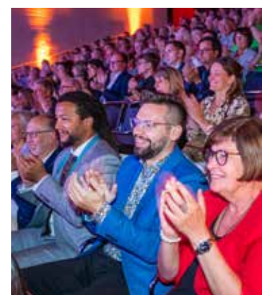
Zahlreiche Gäste fieberten bei der Veranstaltung mit.