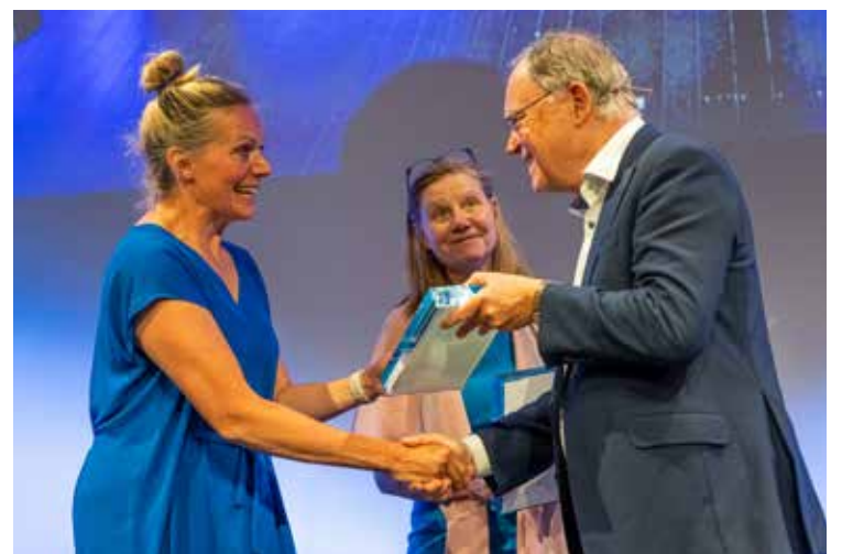
Die Preise an alle Gewinner*innen überreichte der niedersächsische Ministerpräsident Stephan Weil.

Der Inklusionspreis Niedersachsen ist mit insgesamt 19.000 Euro dotiert. Weitere Informationen zum Inklusionspreis und den Preisträger*innen, darunter Filme, die die erstplatzierten Beiträge vorstellen, gibt es unter www.inklusionspreis-niedersachsen.de .