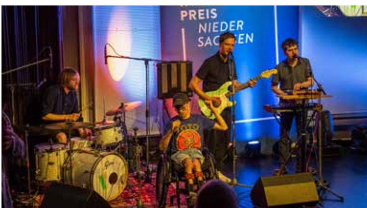
Die inklusive Hamburger Band „Dain Fahrdienst“ begleitete den Veranstaltungsabend und sorgte musikalisch für gute Stimmung.