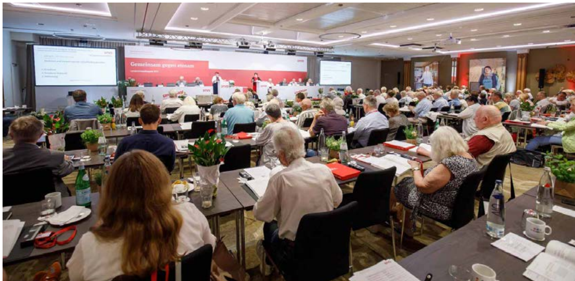
Rund 140 Delegierte aus ganz Niedersachsen nahmen an der Landesverbandstagung in Hannover-Laatzten teil. Sie stimmten über Satzungsänderungen und sozialpolitische Anträge ab, wählten den SoVD-Landesvorstand neu und verabschiedeten die SoVD-Resolution für die kommenden Jahre.