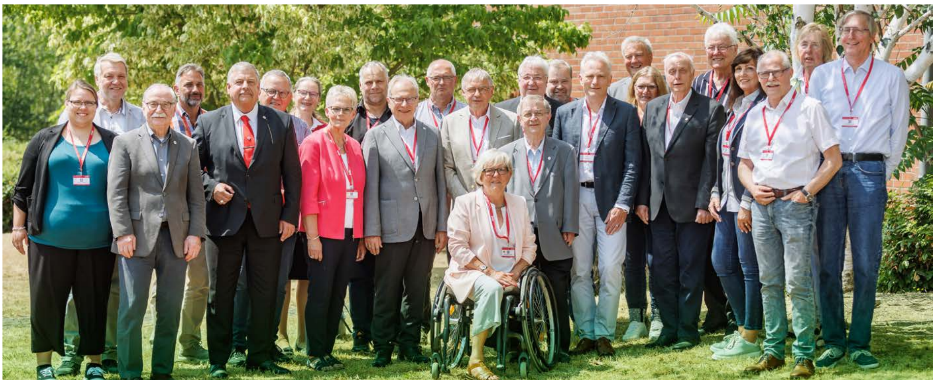
Gemeinsam gut für die Zukunft aufgestellt: Die neu gewählten Landesvorstandsmitglieder, die Revisor*innen, der Jugendbeirat und die Landesgeschäftsführung fanden zum Abschluss der zweitägigen Landesverbandstagung zu einem Gruppenfoto zusammen.