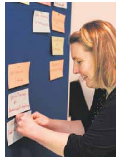
Ergebnisse aus den Workshops fließen in ein Positionspapier.