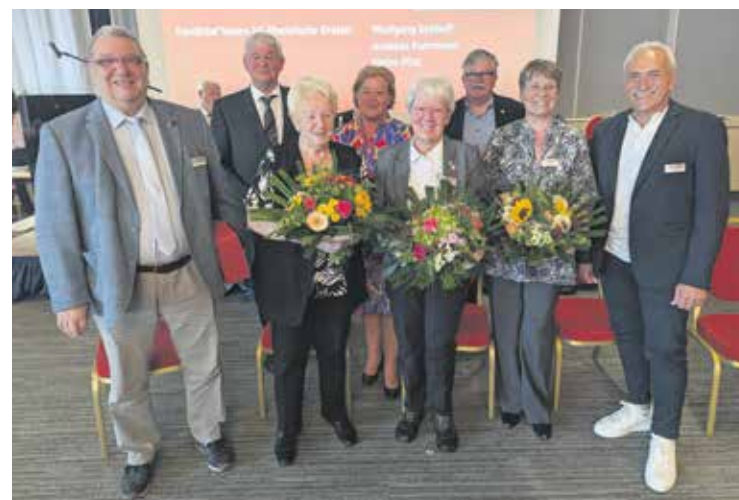
Die scheidenden Vorstandsmitglieder erhielten Blumen.

Die Verabschiedung der „Essener Erklärung“ mit aktuellen sozialpolitischen Forderungen bildete den inhaltlichen Höhepunkt und Abschluss des zweiten Tages. In harmonischer und gelöster Atmosphäre nahmen dann alle Teilnehmer Abschied voneinander und es ging mit einem Lunch-Paket und vielen positiven Eindrücken zurück in die Heimat. Weitere Impressionen von der Landesverbandstagung und einen Film gibt es auf: www.sovd-nrw.de .