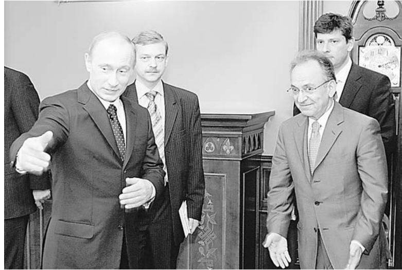
Ο πρόεδρος της Βουλής, Δημήτρης Σιούφας, κατά τη συνάντησή του με τον Ρώσο πρωθυπουργό και πρώην πρόεδρο, Βλαντιμίρ Πούτιν.