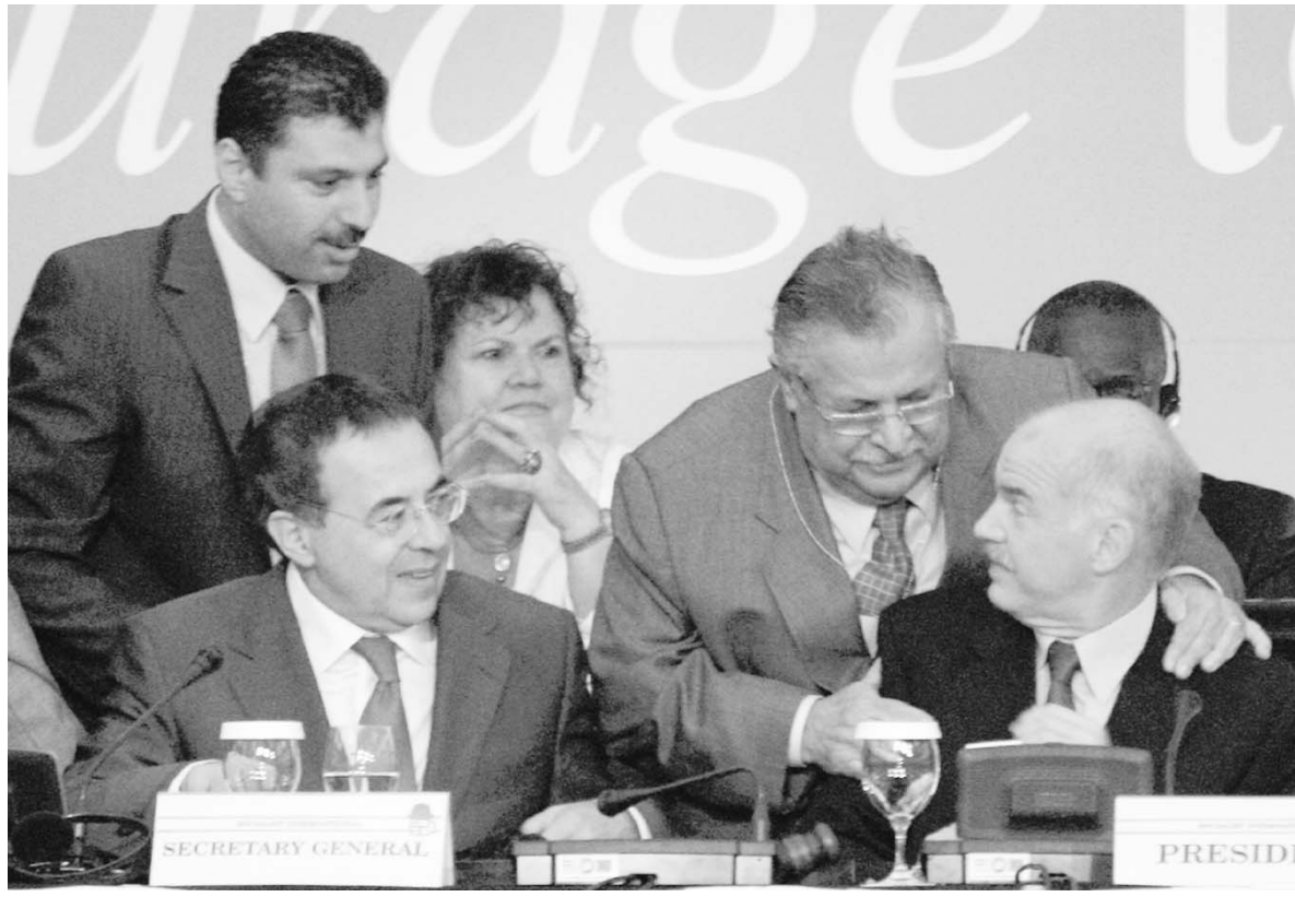
Στο στιγμιότυπο, από τις χθεσινές εργασίες, ο πρόεδρος του Ιράκ, Τζελάλ Ταλαμπανί μιλάει στον Γιώργο Παπανδρέου, ενώ παρακολουθεί (αριστερά) ο γενικός γραμματέας της Οργάνωσης, Λούις Αγιόλα.

Να σημειωθεί ότι εκ μέρους της ελληνικής κυβέρνησης χαιρετισμό απύθνητο ο υπουργός Τουρισμού, Άρης Σπλιωτόπουλος, που έκανε αίτηση λέγοντας ότι «τα καθημερινά προβλήματα είναι πολλά και οι πολίτες αναζητούν λύσεις ρεαλιστικές και εφαρμόσιμες. Οι σύγχρονες λύσεις δεν μπορούν να μονοπωληθούν από καμιά πλευρά» είπε και επισήμανε ότι «τόσο η φιλελεύθερη σκέψη έχει ενσωματωθεί απόψεις της σοσιαλδημοκρατίας, όσο και η σοσιαλδημοκρατία έχει υιοθετήσει