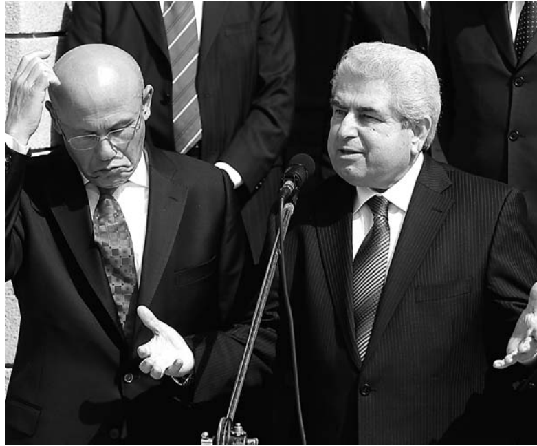
Στιγμιότυπο από παλαιότερη συνάντηση του προέδρου της Δημοκρατίας Δημήτρη Χριστόφια με τον Τ/κ ηγέτη Μεχμέτ Αλί Ταλάτ.

Αναφορικά με το θέμα του διορισμού ειδικού απεσταλμένου του Γενικού Πραγματάρχη των Ηνωμένων Εθνών για το Κυπριακό (θέση για την οποία προορίζεται ο τώως υπουργός Εξωτερικών της Αυστραλίας Άλεξάντερ Ντάουனர்), ο κ. Στεφάνου δήλωσε ότι αυτό το θέμα συνδέεται με την πορεία του διαλό-