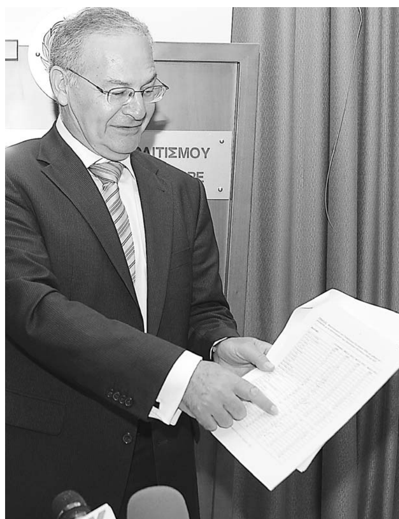
Ο υπουργός Παιδείας και Πολιτισμού, Ανδρέας Δημητρίου, ανακοίνωσε χθες τα αποτελέσματα των Παγκύπριων Εξετάσεων για τα Ανώτερα και Ανώτατα Εκπαιδευτικά Ιδρύματα της Κύπρου καθώς και για τις Στρατιωτικές και Δραματικές Σχολές της Ελλάδας.

Η διάθεση των θέσεων για τα ΑΑΕΙ της Ελλάδας, που θα γίνει από το υπουργείο Εθνικής Παιδείας και Θρησκευμάτων της Ελλάδας, ανα-