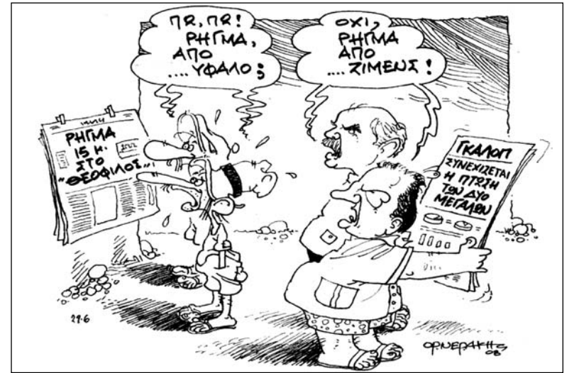
Το ΣΠΥΡΟΥ ΟΡΜΕΡΑΚΗ από «ΤΑ ΝΕΑ»

«Πρωινός Λόγος» (Ιωαννίνων) Η Ηπειρος έλακε επενδυτές - Λόγω των έργων που ολοκληρώνονται και του ανοίγματος προς Αλβανία.