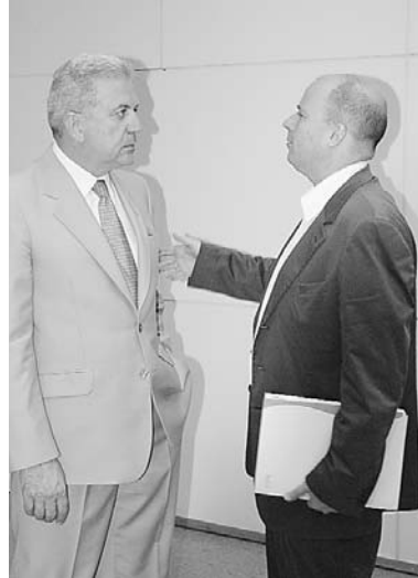
Ο υπουργός Υγείας Δ. Αβραμόπουλος με τον κ. Ανδρέα Δρακόπουλο.

Εργο το οποίο, όπως είπε, οφείλουμε όλοι να βοηθήσουμε να ολοκληρωθεί σύντομα, καθώς «θα είναι σημαία και για το ίδρυμα, αλλά και για το Λεκανοπέδιο».