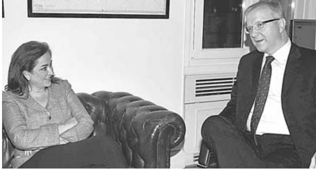
Η πρόεδρος της Δημοκρατικής Συμμαχίας Ντόρα Μπακογιάννη, που συναντήθηκε προχθές με τον επίτροπο Ολι Ρεν, τάχθηκε αντίθετη με τις αλλαγές στις εργασιακές σχέσεις.

Ο εκπρόσωπος του ΛΑΟΣ, Κωστής Αϊβαλιώτης, δήλωσε πως «είμαστε εντελώς αντίθετοι στην περαιτέρω μείωση των μισθών.