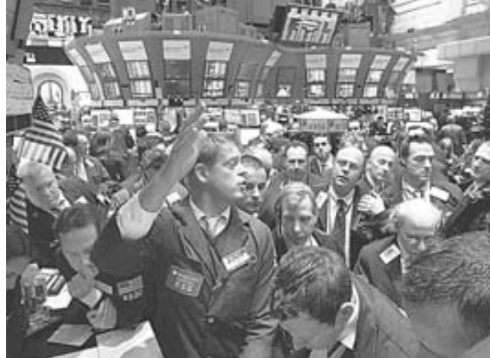
ΡΙΤΣΑΡΠΤ ΝΤΡΟΥ/ΑΣΟΣΙΕΤΕΝΤ ΠΙΕΞ

Η κυβέρνηση, όπως υπογραμμίζεται, δεσμεύεται να εξετάσει το ενδεχόμενο διάθεσης