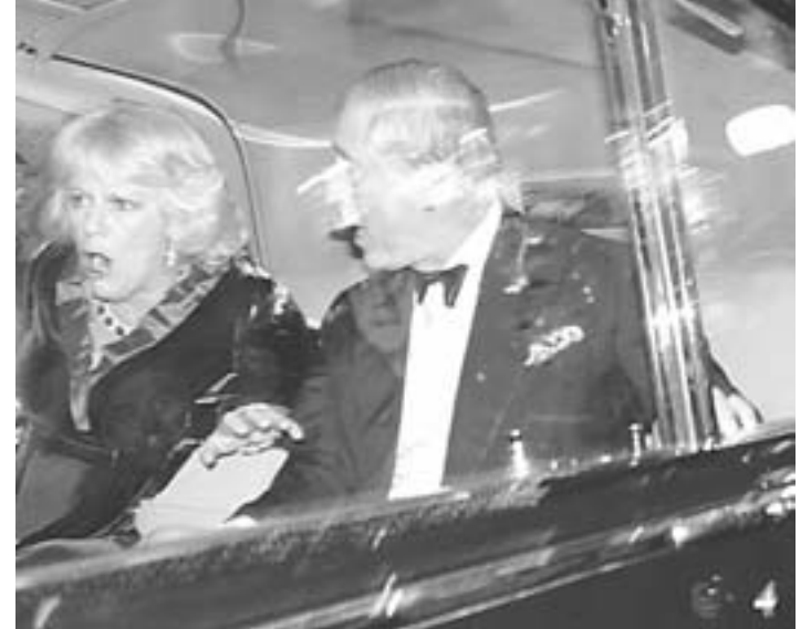
MAT NTANXAM/ΑΣΟΣΙΕΤΕΝ ΠΙΡΕΣ

Μάλιστα, η απόφαση για την αύξηση των διδάκτρων των πανεπιστημίων προκάλεσε την έντονη αντίδραση ορισμένων βουλευτών που ανήκουν στους κεντροαριστερούς Φιλελεύθερους Δημοκράτες, τον μικρότερο κυβερνητικό εταίρο, αλλά ο δεύτερος τη τάξει υπουργός Ανάπτυξης, ο Βινς Κέιμπλ, βε-