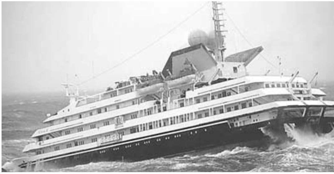
Το κρουαζιερόπλοιο «Clelia II» με 165 επιβάτες παλεύει με τα κύματα στο Νότιο Πέρασμα Ντρέικ («Drake Passage», βόρεια των Νησιών Σέτλαντ, ανοικτά της Αργεντινής).

ΜΠΟΥΕΝΟΣ ΑΪΡΕΣ. («ΑΡ», «ΑΠΕ»). Σε σφοδρή θαλασσοταραχή έπεσε κρουαζιερόπλοιο ελληνικών συμφερόντων στο οποίο επέβαιναν 166 άτομα, 88 επιβάτες και 78 μέλη πλήρωμα, μεταξύ των οποίων και τρεις Έλληνες ναυτικοί, κατά τη διάρκεια ταξιδιού μεταξύ Αργεντινής και Ανταρκτικής.