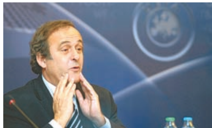
ΜΙΣΕΛ ΚΑΜΑΡΙΑΣΙΟΣ/ΕΠΙΤΕΝΤ ΠΡΕΣ

Το ντέρμπι ΠΑΟΚ - Ηρακλής ξεχωρίζει στη 14η αγωνιστική της Σούπερ Λίγκα (σελ. 20), ενώ στην Κύπρου το ματς Ομόνοιας - ΑΕΚ για την 14η ημέρα (σελ. 19).