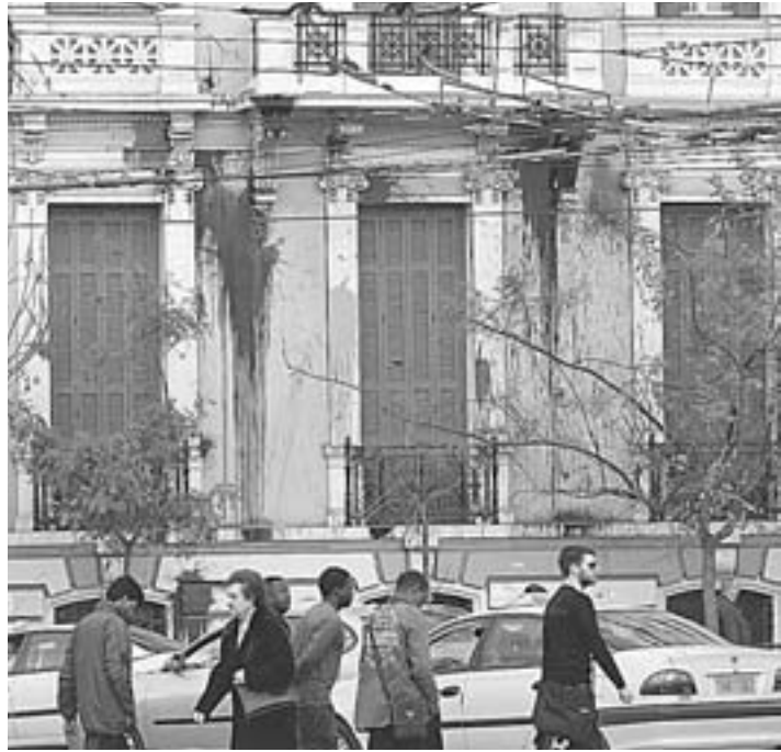
Στο στόχαστρο βρέθηκε και η ΓΣΕΕ, καθώς άγνωστοι χθες πέταξαν μολότι στο κτήριο της στην Αθήνα.