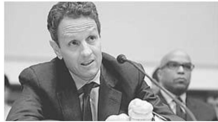
Ικανοποιημένοι θα πρέπει να είναι ο υπουργός Τίμοθι Γκάρνερ από τη μείωση του εμπορικού ελλείμματος.

Η ζήτηση το γ' τρίμηνο του 2010 διαμορφώθηκε αυξημένη 3,7%, καταγράφοντας θετικούς ρυθμούς για τέταρτο συναπτό τρίμηνο. Η Διεθνής Υπηρεσία Ενέργειας προβλέπει ότι θα διαμορφωθεί στα 88,2 εκατ. βαρέλια ημερησίως το 2011, έναντι των φετινών 86,9 εκατ. Η παγκόσμια