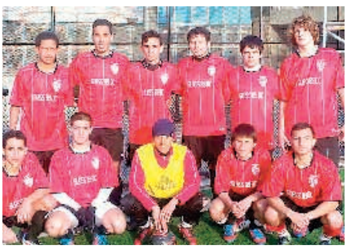
Με νίκη ξεκίνησε τη β' φάση του πρωταθλήματος SFFK η Σαλαμίνα Νέας Υόρκης. Επικράτησε με σκορ 3-0 της Μπρούκλιν Γιουνάιτεντ.

Πλούσιο φωτορπορτάζ από το ΟΑΚΑ στη σελίδα 15 Σχόλιο: Αφίστε την να πεθάνει και να αναστηθεί (σελίδα 1)