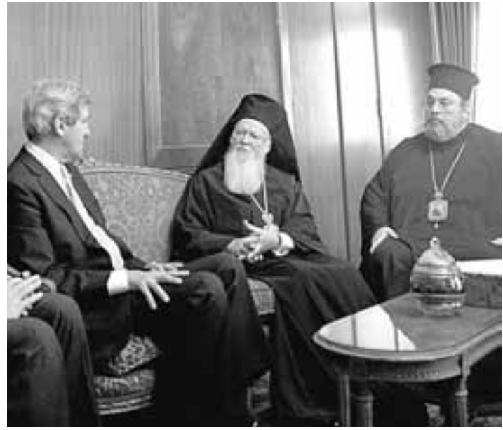
Ο Τζον Κέρι με τον Οικουμενικό Πατριάρχη κ. Βαρθολομαίο και τον Μητροπολίτη Νέας Ιερσέης, Ευάγγελο, στο Φανάρι.

Συντάσεις στον Ερντογάν Υπενθυμίζεται, επίσης, ότι