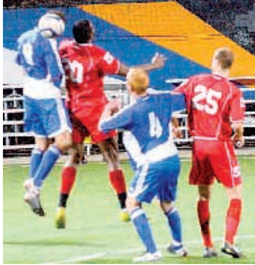
ΕΘΝΙΚΟΣ ΚΗΡΥΞ/ΝΤΙΝΟΣ ΑΥΛΟΝΙΤΗΣ