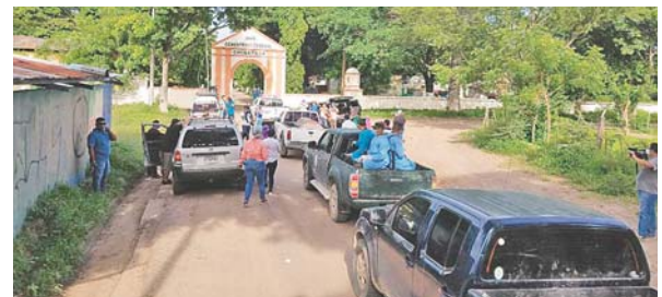
Del hospital al cementerio general de la ciudad de Choluteca fue llevado el cuerpo de la periodista en caravana.