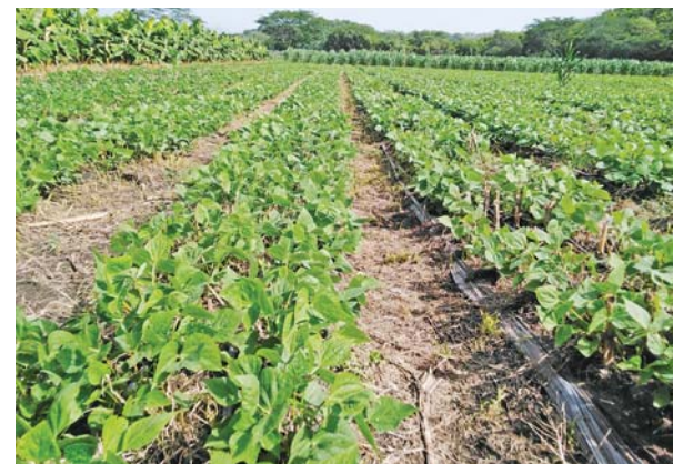
Sembradío de frijol próximo a florecer y, al fondo, plantación de maíz.

Por otra parte, los dueños de terrenos adyacentes a las zonas de cultivo de tabaco, maíz y pastos para la ganadería, implementaron un proyecto de conservación forestal, protegiendo la vegetación natural existente y con reforestación mediante árboles de rápido crecimiento. (LAG)