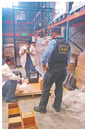
Agentes de investigación realizan el procedimiento para preparar el expediente y dar con el paradero de los responsables del ilícito.

Al final se contabilizaron 145 cajas de cartón conteniendo 1,213 litros de MEK, procedentes de una empresa de Estados Unidos. (JGZ)