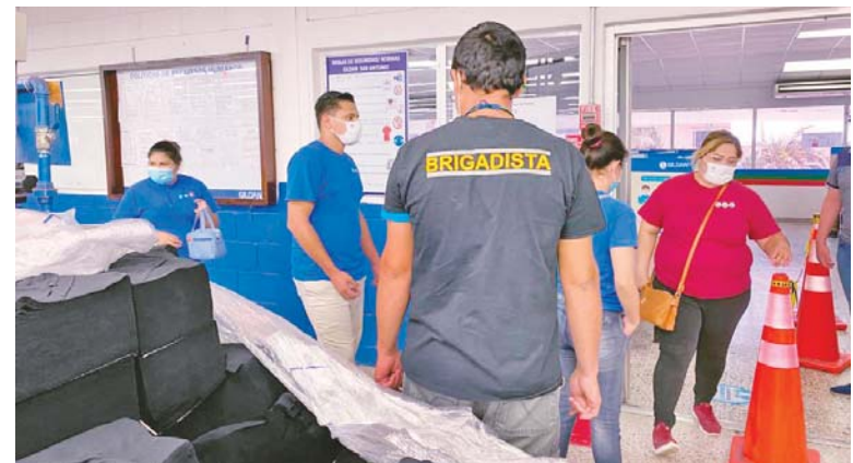
Cada empleado da datos sobre los contagios en su familia y se somete a una revisión de temperatura.