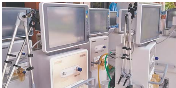
Los ventiladores donados al HEU carecen de tres instrumentos necesarios que al no tener una red de gases instaladas como la del hospital, no podrían funcionar.

“Se recibieron 40 ventiladores y el grupo de biomédicos del Hospital Escuela han revisado estos ventiladores mecánicos, están funcionando correctamente según los informes”, indicó Ortiz.