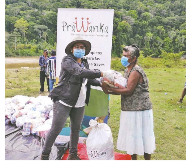
Pobladores misquitos reciben ayuda de programa financiado por la Cooperación Suiza.