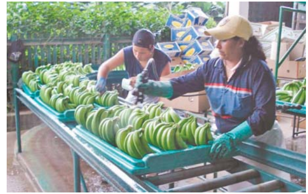
Entre 60 y 80 trabajadores fueron cesanteados por el cierre de operación logística en Puerto Cortés.