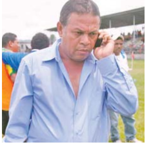
Héctor Fúnez, presidente de la Liga de Ascenso.

“Los 31 clubes afiliados merecen el mismo trato, nadie recibirá un poco más, pero no sabemos cuánto dinero es ni cuándo llegará al país, nos reuniremos con las autoridades de Fenafuth para enterarnos del tema”, dijo en plática con deportistas TNH.