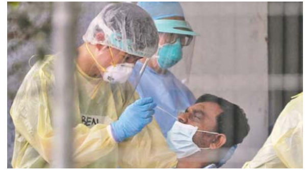
La tendencia de hombres positivos por COVID-19 se mantiene a nivel mundial.