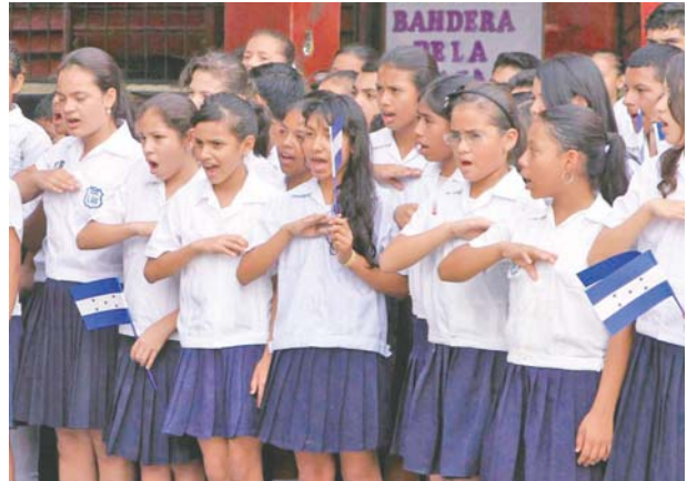
Cartillas, la televisión, radio y las distintas acciones de maestros por enseñar a los alumnos, durante la pandemia.

Confirmó que por la situación grave de contagio por la pandemia “difícilmente este año retornemos a las escuelas”.