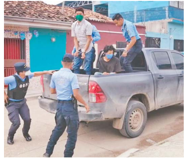
Los dos sujetos son acusados de varios crímenes perpetrados en los últimos días en Talanga, Francisco Morazán.

ron varios agentes de la Dirección Policial de Investigaciones (DPI), para realizar las indagaciones pertinentes y dar con el paradero de los autores del múltiple crimen. (JGZ)