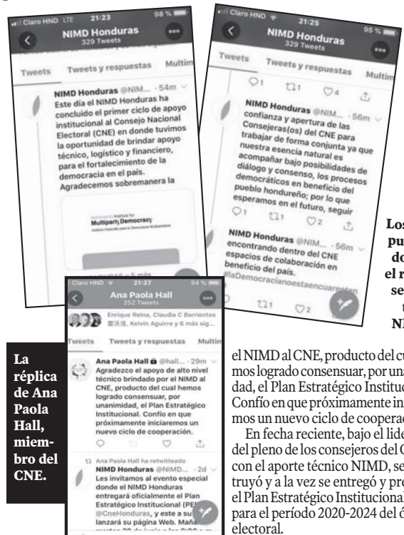
Los tuits publicados por el representante del NIMD.