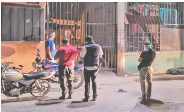
Después de los hechos al sector llegaron agentes de la Unidad de Inspecciones Oculares, para recolectar evidencias y dar con el paradero de los victimarios.

men los criminales huyeron con rumbo desconocido a bordo de un vehículo con características ya establecidas por la Policía Nacional.