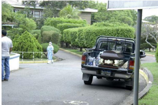
Las autoridades de los diferentes hospitales confirmaron la muerte de 15 hondureños más por sospechas de COVID-19.