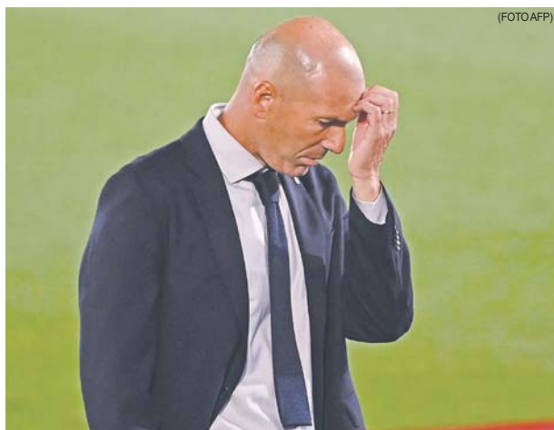
Zinedine Zidane sigue diciendo que todavía no es tiempo de celebrar.

El titular de la Conmebol recordó que "miles de jugadoras, jugadores, técnicos, periodistas, dependen económicamente de este deporte.