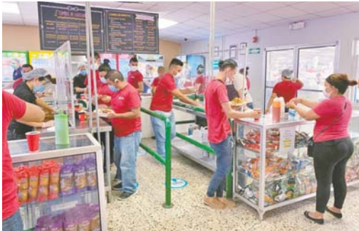
En la zona de cafetería, los empleados saben que deben de guardar la distancia.