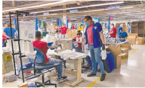
En la zona de producción, también hay constante revisión de las medidas de bioseguridad adoptadas en la AHM.