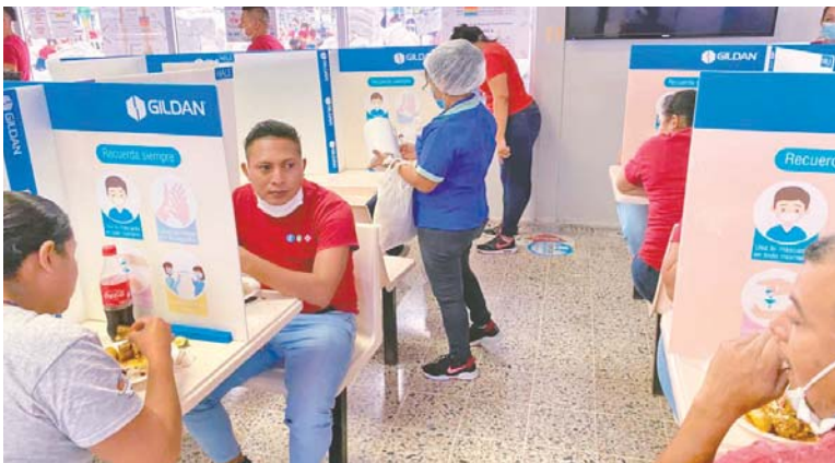
En la zona de los comedores, también hay medidas de seguridad para evitar el contagio de COVID-19.