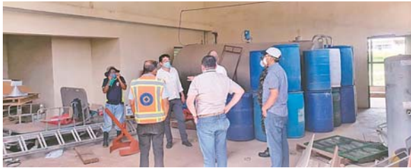
Los centros de triaje en Danlí, El Paraíso, funcionarán en la Adago, el CAH y el Instituto "José Trinidad Reyes", de la colonia La Cofradía.