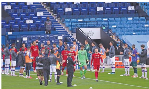
Los jugadores de City hicieron el pasillo a Liverpool, una tradición al campeón en Europa.