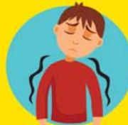
DOLOR DE HUESOS Y MUSCULAR O MALESTAR GENERAL