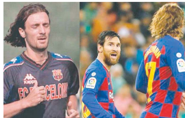
Dugarry, ahora periodista, antes jugó en el Barcelona y la selección francesa.

Lo único que tiene que hacer es echarle 'cojones' (sic) en algún momento", aseguró el exinternacional francés. Dugarry, conocido por sus opiniones polémicas en Francia, aseguró que Griezmann debe "darle un tartaço en la cara" porque "hace un año que se viene diciendo que tiene un problema con Messi". MARTOX