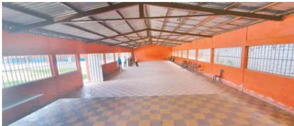
Los locales serán equipados con mobiliario y medicamentos requeridos por la población para reducir el impacto de la pandemia.

tros de triaje serán equipados con mobiliario y medicamentos requeridos por la población para reducir el impacto de la pandemia, que ya registra más de 80 casos positivos y activos en Danlí, incluso más de 40 diarios en el Seguro Social y Región de Salud, además de un pendiente de más de 200 pruebas que adeuda el