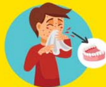
SANGRADO DE ENCÍAS, NARIZ Y ORINA

...busca el Establecimiento de Salud más cercano NO TE AUTO-MEDIQUES