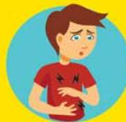
DOLOR DE ESTÓMAGO, NAUSEAS O VÓMITOS PERSISTENTES