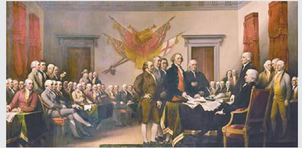
Firma de independencia en Filadelfia.

*** Mañana se cumplen 244 años desde que en Filadelfia se firmó el acta de independencia, en la cual Estados Unidos anuncia que deja de formar parte del Reino Unido, Fue Thomas Jefferson el que elaboró el histórico documento en que este país declara su separación de la poderosa Gran Bretaña.