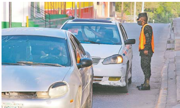
Los automovilistas deben comprobar que en efecto están autorizados para transitar por las calles y avenidas de Siguatepeque.

Desde el martes, la corporación municipal de Siguatepeque, que dirige el alcalde Juan Carlos Pacheco, emitió un comunicado dando a co-