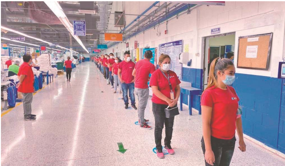
Los empleados pasan por un triaje, entre otras medidas para verificar su estado de salud.