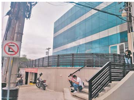
Las primeras acciones emprendidas por la ATIC fueron en Invest-H, en el bulevar Morazán.