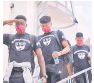
Ayer cancelaron los entrenamientos del FC Dallas.

Sin embargo, el martes en una segunda ronda de pruebas realizadas, seis futbolistas más del FC Dallas también resultaron infectados,