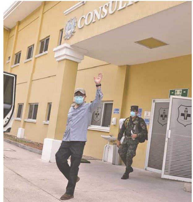
El mandatario abandonó el Hospital Militar, ayer en la mañana.

Pero también a los héroes en cada hospital, en cada centro de salud, en cada centro de triaje, en cada centro de auxilio, que están luchando por salvar vidas, y muchos a un alto sacrificio familiar y personal, con mucha presión, pero lo están haciendo. Yo les digo: la pa-