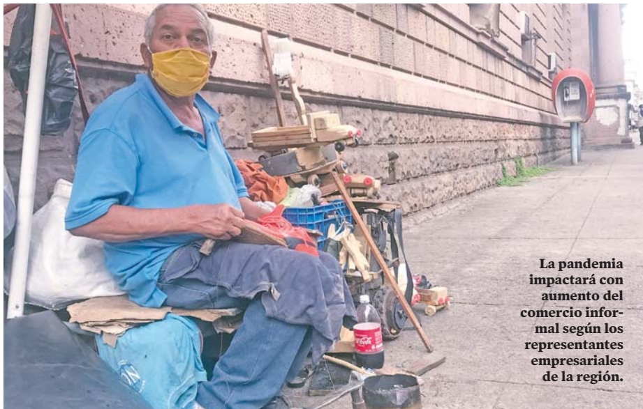
La pandemia impactará con aumento del comercio informal según los representantes empresariales de la región.

Las encuestas regionales indican que el 90 por ciento de las empresas no están operando. El 53 por ciento cerraron, 38 por ciento de forma parcial y solo 9 por ciento opera normalmente. "Solicitamos una cuarentena balanceada, no se logró, tampoco una apertura ordenada. Hasbúm mencionó que diariamente la economía salvadoreña está perdiendo un promedio de 100 millones de dólares. (JB)