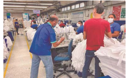
Las empresas están operando bajo el rigor de las medidas para evitar el COVID-19.