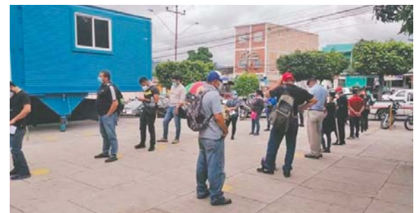
Abarrotada de pacientes con sospechas de COVID-19 se encuentra la clínica periférica del IHSS, en la colonia Santa Fe.

Los médicos están trabajando en tres turnos con horarios extendidos, ya que la cantidad de pacientes es alta y el personal debe hacer grandes esfuerzos. (DS)