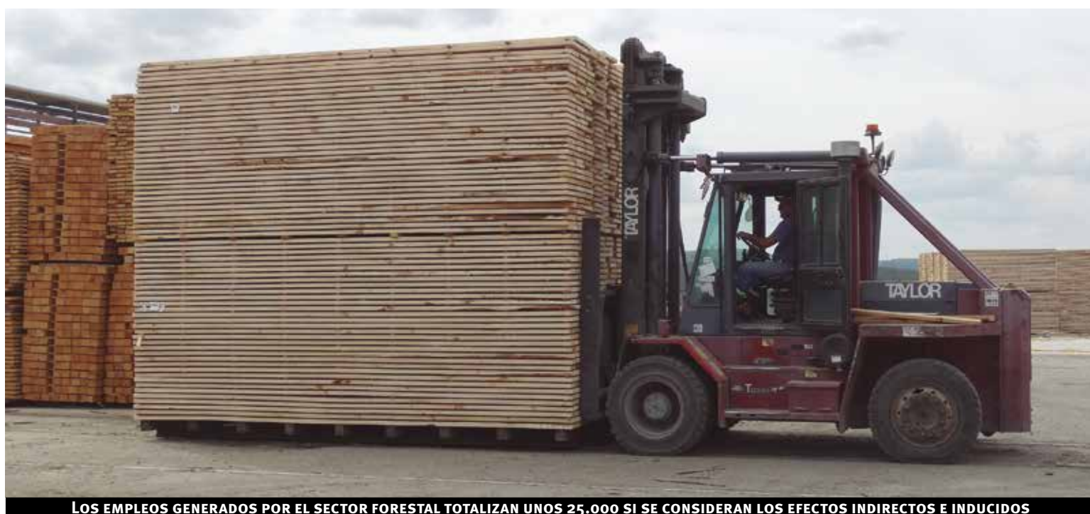
LOS EMPLEOS GENERADOS POR EL SECTOR FORESTAL TOTALIZAN UNOS 25.000 SI SE CONSIDERAN LOS EFECTOS INDIRECTOS E INDUCIDOS

Como resultado de este proceso, las exportaciones de productos forestales tuvieron un extraordinario incremento en la última década. En 2019 el sector exportó casi US$ 1.900 millones, representando más del 16% de las exportaciones totales de bienes de Uruguay: US$ 1.500 millones de celulosa (el segundo rubro más importante de exportación a nivel de bienes, sólo por debajo de la carne) y US$ 370 millones de otros productos forestales (madera aserrada y terciada, chips y rolos).