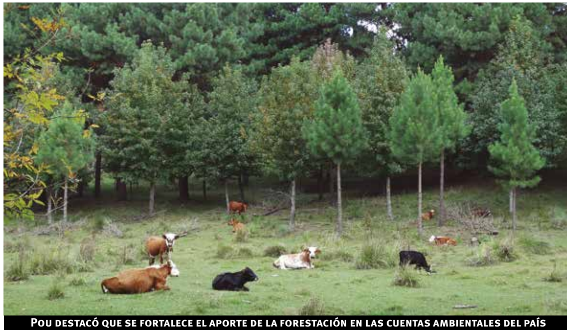
POU DESTACÓ QUE SE FORTALECE EL APORTE DE LA FORESTACIÓN EN LAS CUENTAS AMBIENTALES DEL PAÍS

¿Qué deberes pendientes existen en la cadena forestal uruguaya? No tiene deberes, tiene etapas, no olvidemos que la "historia" empezó en 1990. Hay plantaciones que se han cortado y renovado productivamente varias veces; hay otras que recién hace tres o cuatro años empezaron a cortarse por primera vez: pinos y eucaliptos manejados para producción de