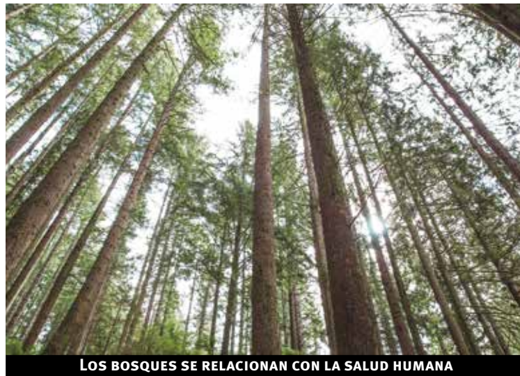
LOS BOSQUES SE RELACIONAN CON LA SALUD HUMANA

Y se concluye que “la mayoría de las nuevas enfermedades infecciosas, incluido el virus