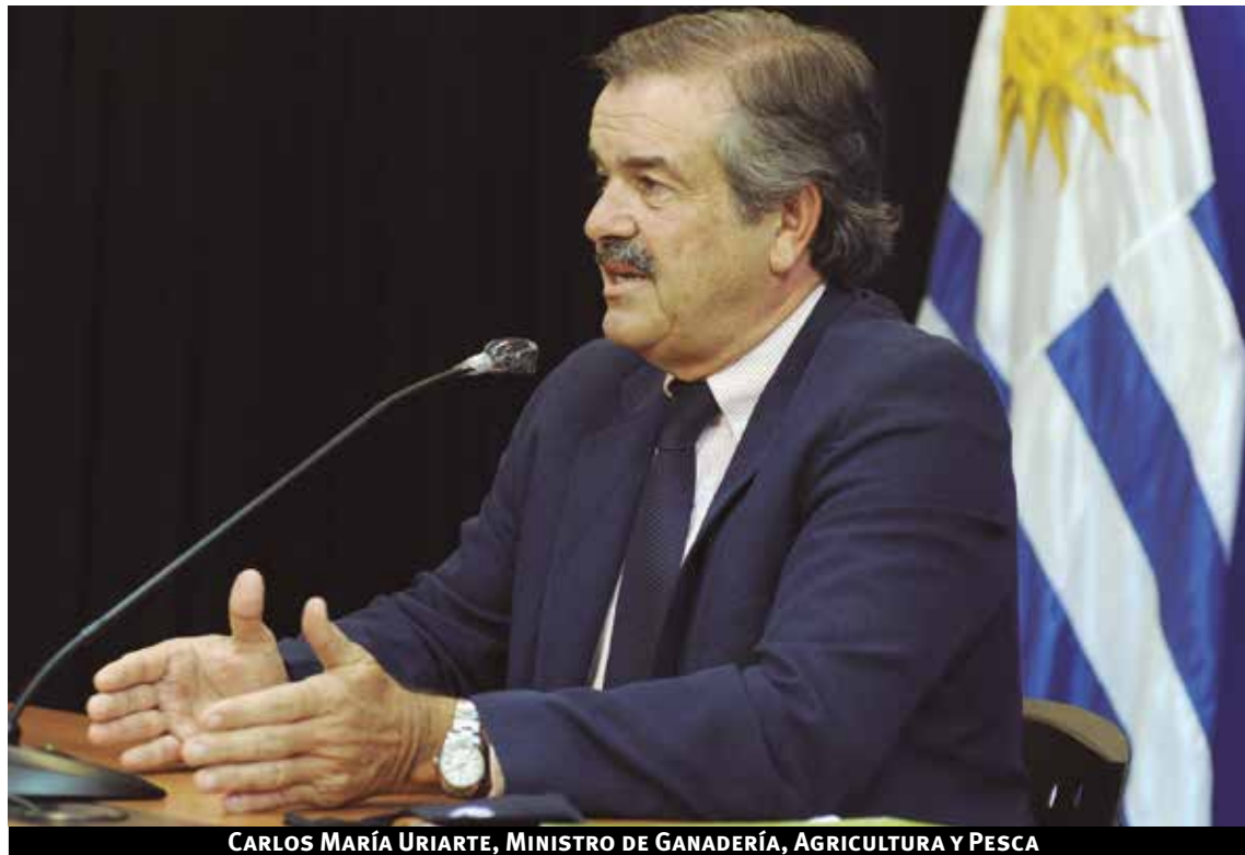
CARLOS MARÍA URIARTE, MINISTRO DE GANADERÍA, AGRICULTURA Y PESCA

Siempre le otorgué mucho valor al sector, incluso antes de ser Ministro, como productor. Para mí es un rubro muy importante para el agro