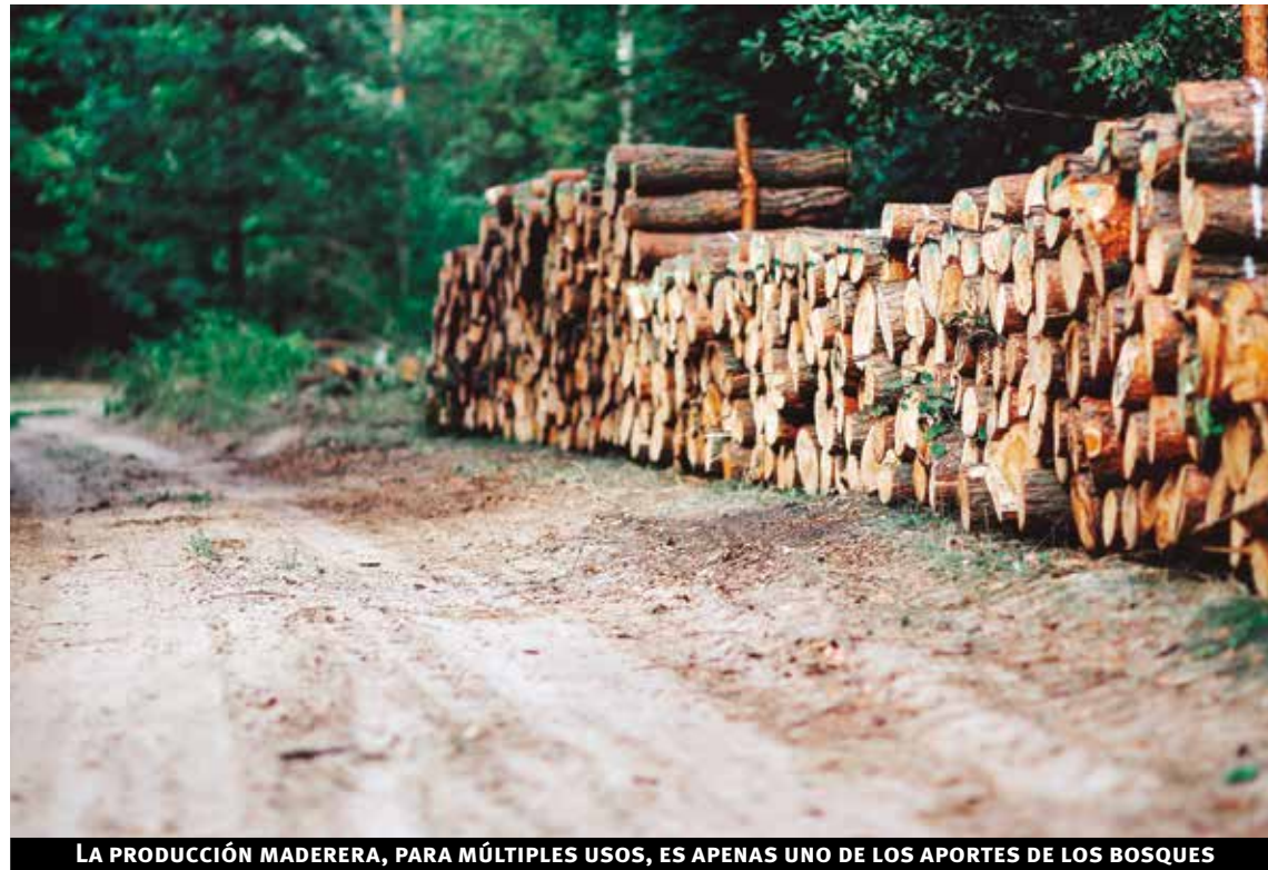
LA PRODUCCIÓN MADERERA, PARA MÚLTIPLES USOS, ES APENAS UNO DE LOS APORTES DE LOS BOSQUES

de propiedad pública, el 22% es de propiedad privada, y la propiedad del resto se clasifica como "desconocida" u "otra" (que comprende principalmente los bosques cuya propiedad está en disputa o en transición).