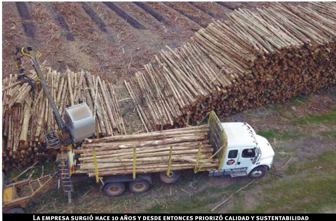
LA EMPRESA SURGIÓ HACE 10 AÑOS Y DESDE ENTONCES PRIORIZÓ CALIDAD Y SUSTENTABILIDAD

permitió descubrir otras oportunidades, como la del servicio de auxilio forestal: “Del mismo modo, con una persona y una unidad autocargable, en caso de ocurrir un siniestro podemos concurrir y resolver la situación rápidamente, liberando rápido la ruta, recogiendo la madera que se pueda haber desparramado de la unidad que la transportaba y haya volcado”, cuando antes se precisaba más tiempo y era necesario movilizar un nuevo camión para la madera, una chata, un grapo, otro camión para sacar el camión accidentado y a la vez más personal, lo que tenía un gran impacto sobre todo en aquellos años primeros en los que la tasa de siniestralidad era mayor.