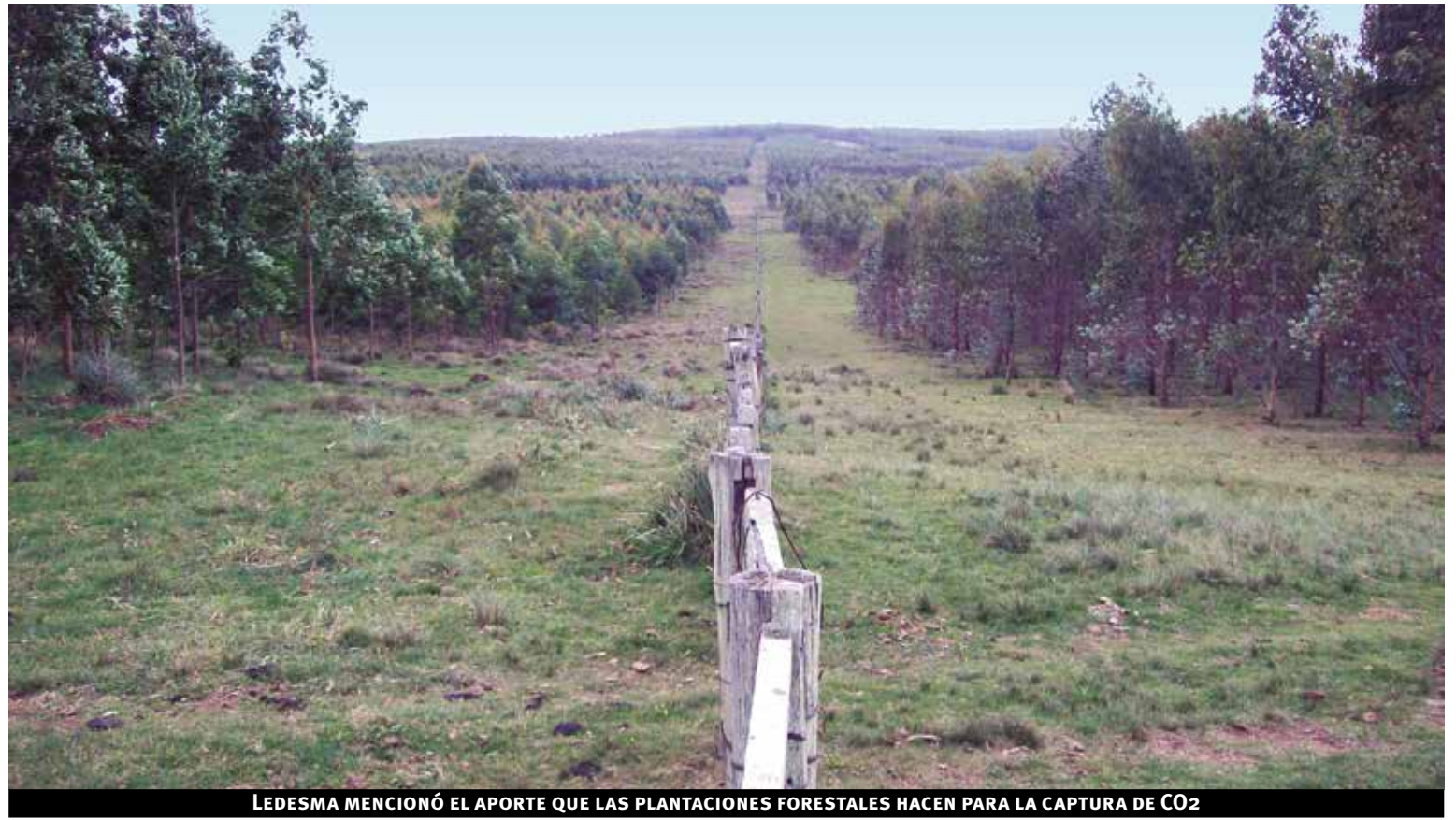
LEDESMA MENCIONÓ EL APORTE QUE LAS PLANTACIONES FORESTALES HACEN PARA LA CAPTURA DE CO2

La SPF, dijo, "a través de los profesionales de las empresas hizo un análisis técnico de la