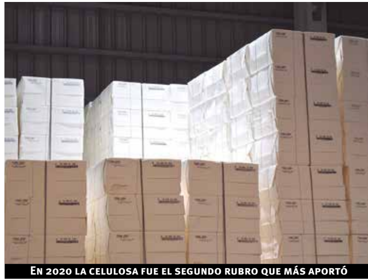
EN 2020 LA CELULOSA FUE EL SEGUNDO RUBRO QUE MÁS APORTÓ

En febrero de 2021 las solicitudes de exportación, incluyendo zonas francas, totalizaron US$ 690 millones, lo que implica un aumento de 17,6% en términos interanuales (versus US$ 586 millones en febrero de 2020).