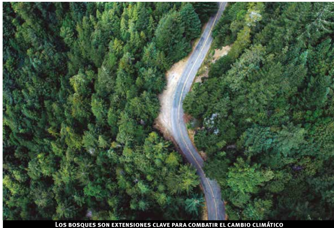
LOS BOSQUES SON EXTENSIONES CLAVE PARA COMBATIR EL CAMBIO CLIMÁTICO

Los bosques cubren un tercio de la superficie terrestre y juegan un papel fundamental en la vida del planeta. Más de 1.000 millones de personas—incluidas las de más de 2.000 pueblos indígenas— dependen de ellos para sobrevivir: proporcionan alimentos, medicinas, combustible y abrigo.