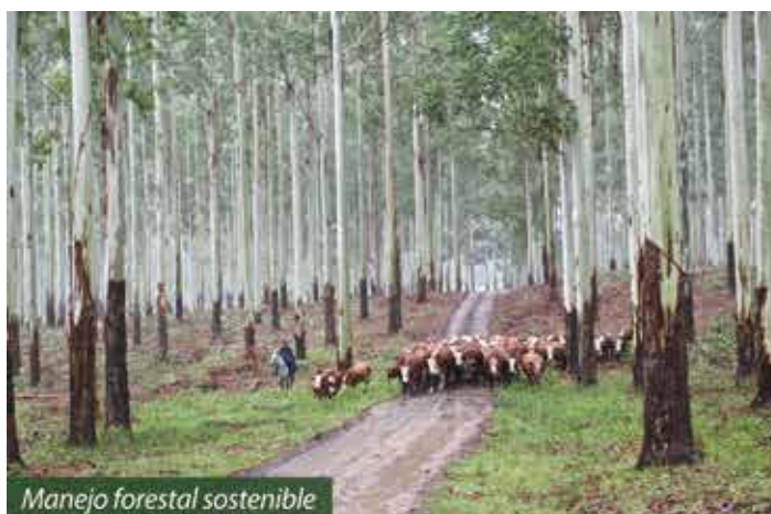
Manejo forestal sostenible