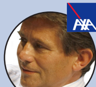
Henri de Castries

PDG d'AXA jusqu'en 2016; possible ministre de l'Économie si victoire du candidat