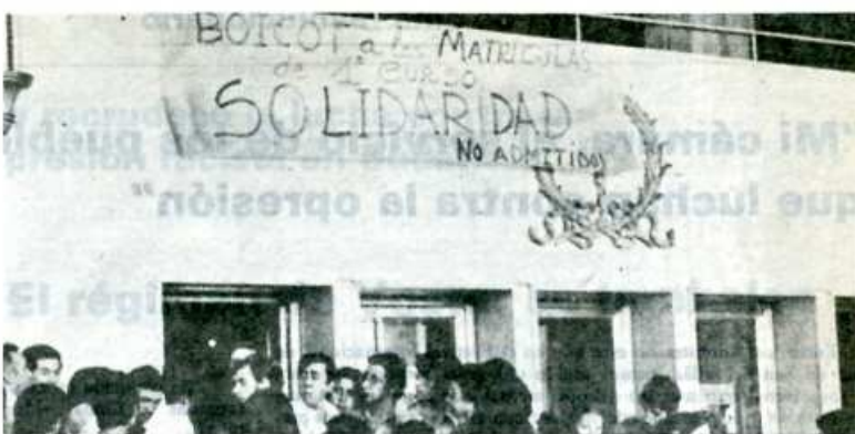
Con la selectividad en Medicina la oligarquía demuestra que es una losa para el progreso del país.

Sólo en la medida en que avancemos en el desarrollo de estas tareas se estará garantizando la consecución de unos precios justos y rentables, así como del resto de las reivindicaciones, al mismo tiempo que avanzamos en la solución de la crisis de una forma favorable a los intereses del conjunto del pueblo.