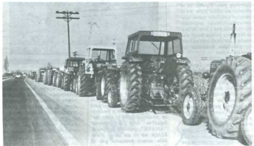
Los tractores pueden volver a la carretera si el Gobierno no atiende las demandas campesinas.

El debate parlamentario que sobre el problema agrario, tendrá lugar en las Cortes, va a servir para dar una mayor repercusión a los problemas del cam-