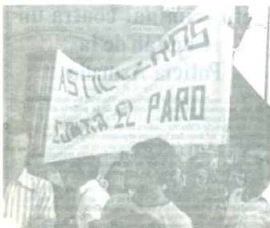
Creación de nuevos puestos de trabajo. Ampliación del subsidio de desempleo y actualización al cien por cien del salario real.

El Consejo Sindical también ha hecho patente su denuncia ante los últimos atentados terroristas, solidarizándose con la huelga de los trabajadores de prensa de Barcelona y Madrid.