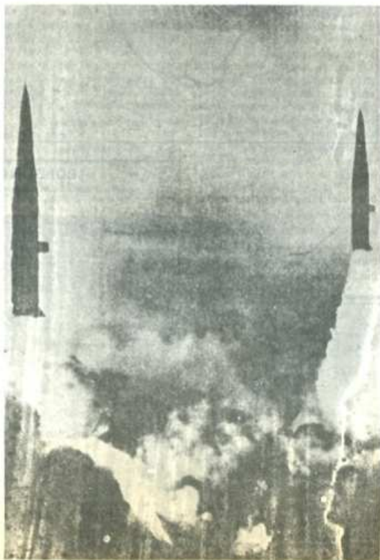
Nuestro suelo puede ser escenario de un enfrentamiento entre las dos superpotencias por la presencia yanqui.

la OTAN. Lo que ocurre es que no le resulta fácil y está esperando el momento oportuno. No le resulta fácil porque tiene necesariamente que contar con la oposición a la entrada de la mayoría de la población expresada a través del conjunto de las fuerzas obreras y populares y porque el momento económico no es pre-