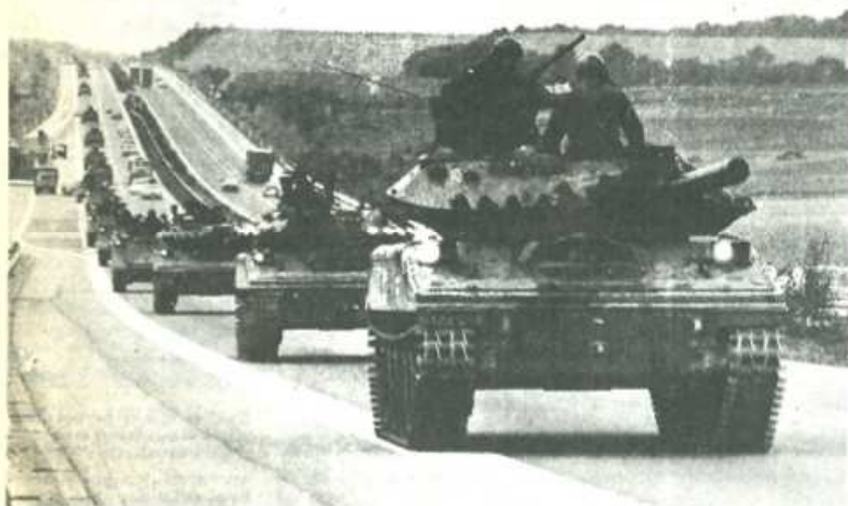
OTAN: un poderoso ejército para que los yanquis mantengan su hegemonía sobre Europa.

El día 20 todas las fuerzas de la oposición democrática representadas en el Parlamento coincidían en señalar su oposición a la entrada de España en la OTAN.