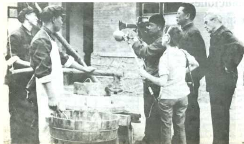
Joris Ivens y Marceline Loridan rodando escenas de su documental sobre el pueblo chino, "Cómo Yukong desplazó las montañas"

Las 4.000 manos que se levantaron para aprobar las soluciones planteadas por la comisión —suspender temporalmente licencias de construcción, para que el pueblo participe en la discusión del problema—, han demostrado que el pueblo de Estella quiere hacer realidad su protagonismo y quiere participar en la toma de decisiones que afecten al municipio.