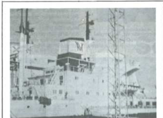
Los buques mercantes "Marta" e "Irene" de la Compañía Naviera Vascongada Bilbaina, paralizados en el Puerto de Cádiz.

Las peticiones de los trabajadores son razonables e, incluso, las han rebajado por su propia voluntad dos veces, mientras la patronal sigue mante-