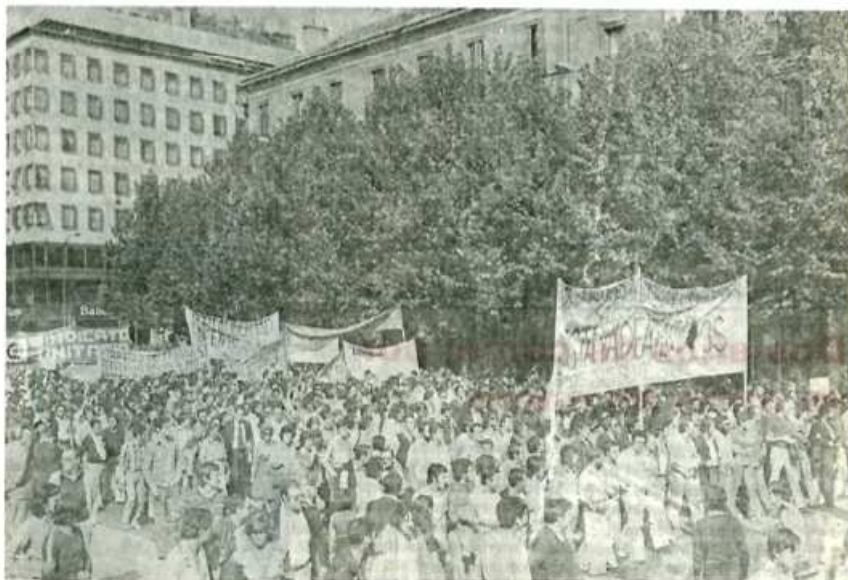
La primera lucha unitaria de todos los trabajadores de prensa. (en la foto, manifestación en Madrid el día 23).

La lucha de los trabajadores de prensa ha trascendido su propio marco para salir al paso de la impunidad fascista y de la debilidad interesada del Gobierno para con los "incontrolados".