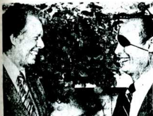
Dayan y Carter hablan de "paz" mientras se produce la agresión al Líbano.

Tropas israelíes acaban de penetrar en territorio libanés para intervenir en el conflicto de este país a favor de la derecha y en contra de los palestinos. Con ello se inicia una nueva escalada en las agresiones israelíes contra los países árabes y el pueblo palestino.