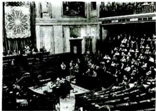
El Gobierno convirtió el Pleno en un diálogo de sordos.

En las "bases para la elaboración de una Constitución Democrática" elaboradas por nuestro Comité Central y enviada a la Comisión Constitucional del Congreso, decíamos en lo referente a política exterior: "El Estado español velará por el mantenimiento de una política exterior basada en la inde-