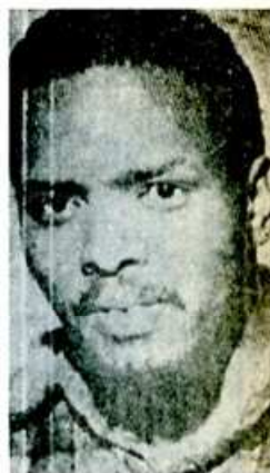
Biko, su muerte ha sido motivo de nuevas luchas contra el régimen racista sudafricano.

En el exterior, cada vez encuentra Voster mayores dificultades para recabar apoyo. Todos los países africanos, excepto Rodesia, se solidarizan con el pueblo azanio y en contra de Voster. Y ahora no sólo ha sido Africa. Varios países occidentales, entre los que se encuentra E.E.U.U., Francia e Inglaterra, están presionando para que el Gobierno sudafricano abandone la ocupación ilegal de Namibia —que se prolonga desde 1.949—.