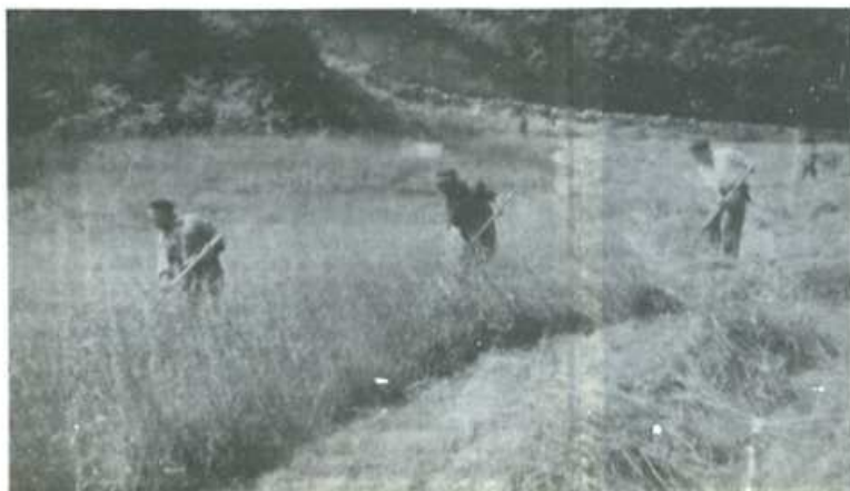
El Gobierno hunde el campo