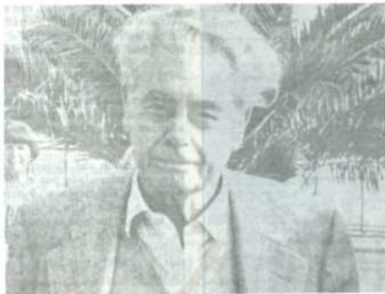
Joris Ivens, gran maestro del documental revolucionario.

"Bien. China es un país que construye el socialismo. Por ello el cine cumple una función con-