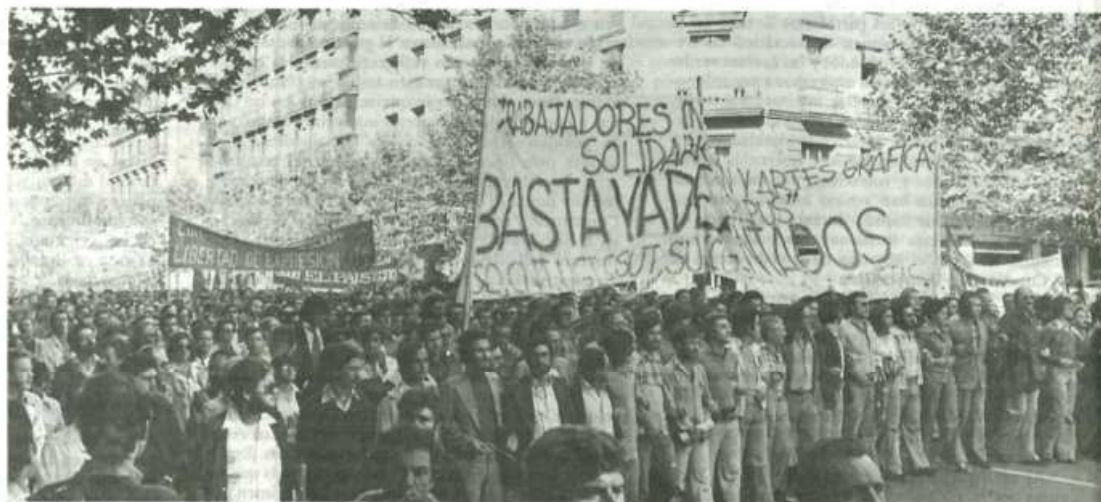
Un aspecto de la manifestación de Madrid

En la primera asamblea, los trabajadores rompieron las dudas que en un principio mantenían sobre las posibilidades de un paro. Las centrales sindicales propusieron la convocatoria de la manifestación e hicieron el llamamiento para que los trabajadores realizaran asambleas par-