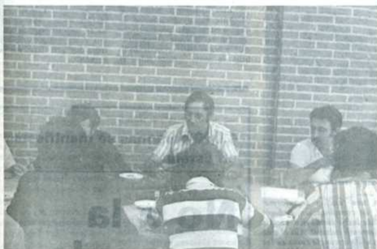
Precios justos, Seguridad Social agraria, no a las importaciones, seguros contra catástrofes y derogación del decreto-ley de Cámaras Agrarias. Estas exigencias que presentaron los campesinos en la rueda de prensa.

RUEDA DE PRENSA DE LA COMISIÓN PERMANENTE DE LA COORDINADORA DE AGRICULTORES Y GANADEROS DEL ESTADO ESPAÑOL