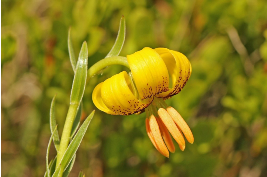
Lilium albanicum