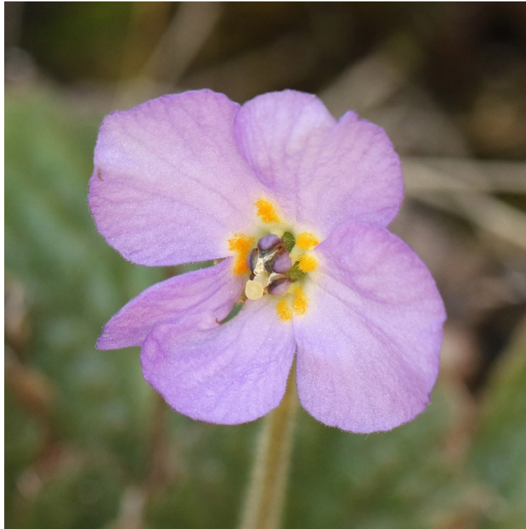
Ramonda serbica