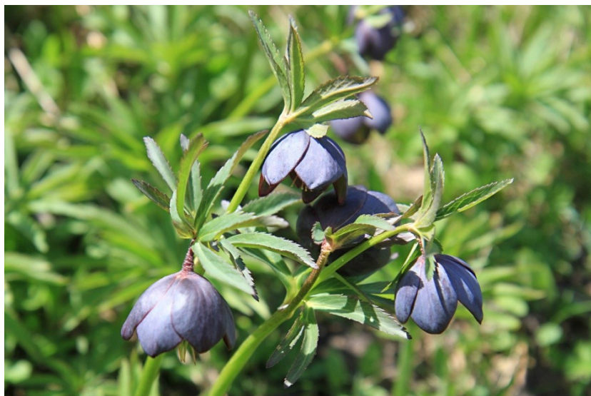
Helleborus multifidus ssp. multifidus