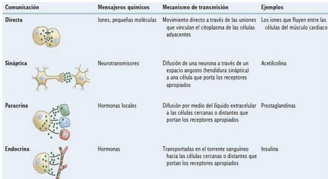
Figura 1. Tomado de Biología, la vida en la tierra con fisiología. Audesirck 9ª Edición.

Cuando se produce un cambio en el cuerpo que es provocado por varios efectos, como son el cambio de temperatura, luz, presión atmosférica u otros cambios, lo que hacen los nervios es enviar una señal a nuestro cerebro. Cuando reciben estas señales el cerebro lo interpreta y envía un mensaje nuevo a la glándula endocrina u órgano para que pueda liberar una o más hormonas, las cuáles van a llegar a los receptores específicos que se encuentran en las células donde estas van a actuar.