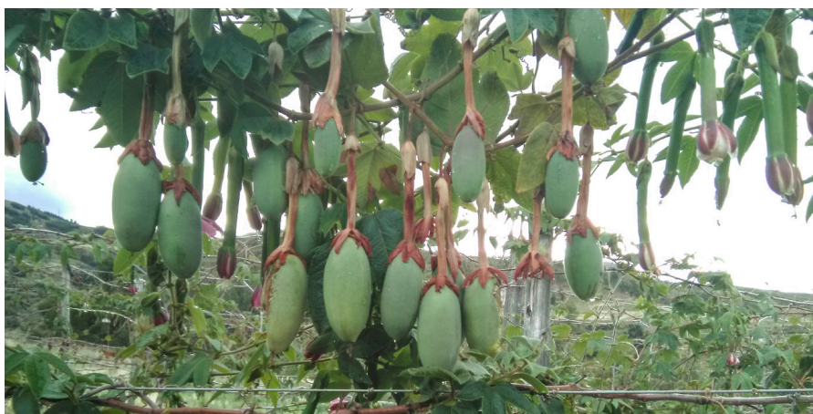
Foto: Tutor colocado al medio de los postes y donde la planta nueva está sujeta para guiar su desarrollo hasta el espalder superior en parcelas de cultivo de Pilancho 2016.

de los alambres se inicia por la parte superior de los postes a 2,0 metros. La segunda fila y tercera fila se colocan a 0,6 metros, de manera que esta última este a una distancia de 0,80 metros del suelo. Estos alambres deben quedar lo más tensos posible. Entre poste y poste se coloca un tutor que puede ser una cañahueca, rama u otro material que servirá para guiar a la planta en su crecimiento hasta que alcance el alambre de la parte superior tal como se aprecia en la foto que precede.