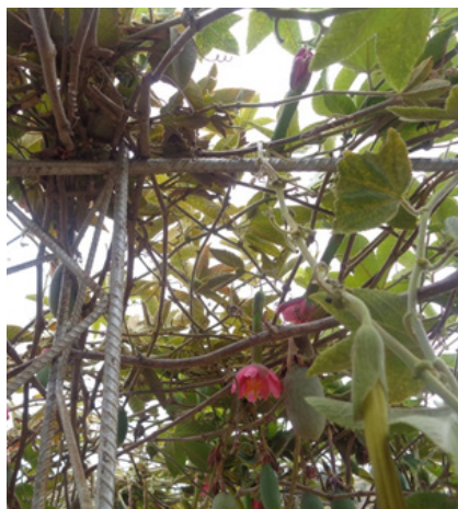
Foto: Sistema de cultivo en T en Pilancho Sacaba en cuya tranquera se instalan 3 filas de alambre: Uno al centro y 2 en ambos extremos.