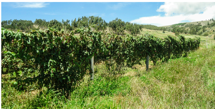
Foto. Parcela de Tumbo en Producción en Pilancho, Sacaba.

parcelas de cultivo en otras comunidades y distritos, en la actualidad, se encuentra en proceso de expansión por las ventajas económicas que ofrece en relación al cultivo de hortalizas y cereales.