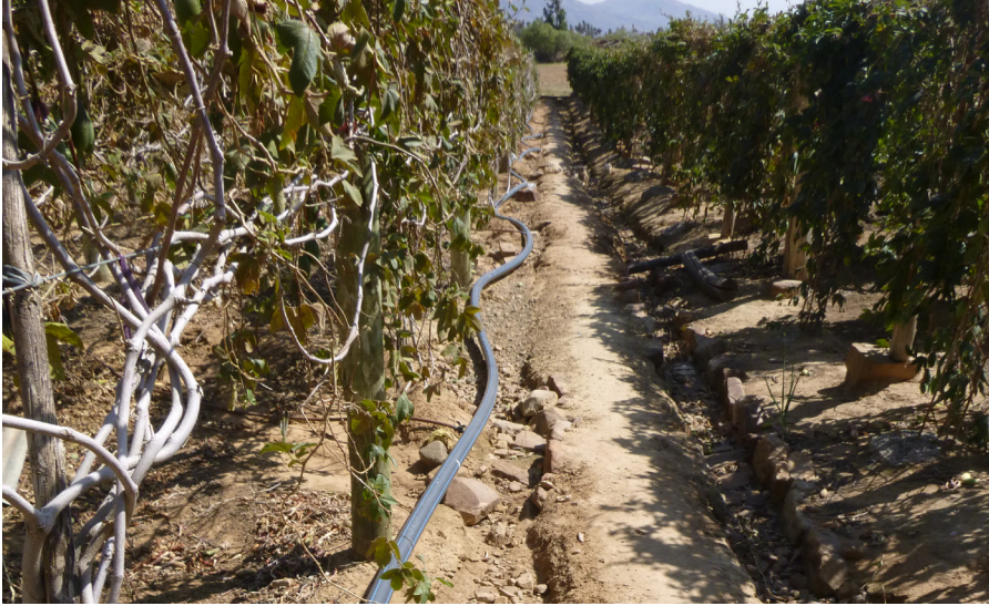
Tubería lateral desde donde se instalan las tuberías que conducen el agua a cada hilera