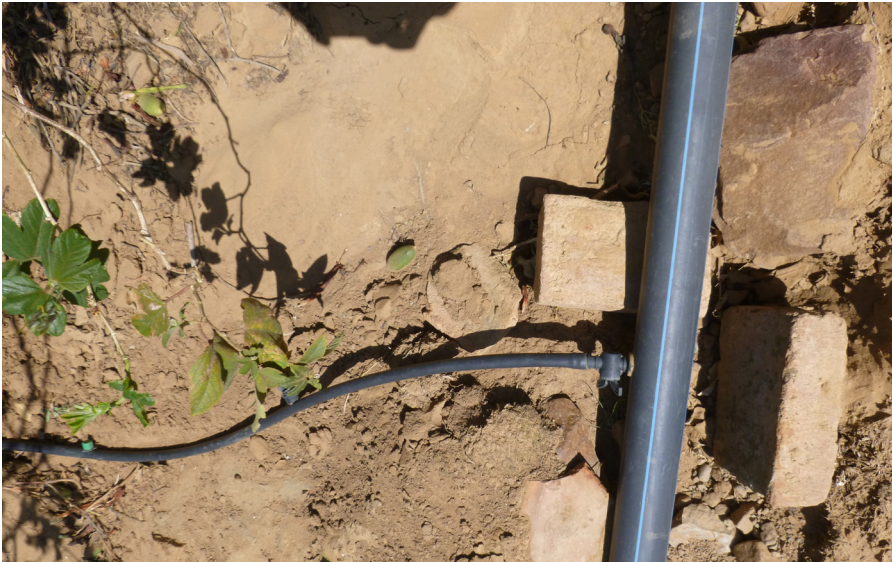
Foto: Tubería lateral desde donde se instalan las tuberías que conducen el agua a cada hilera