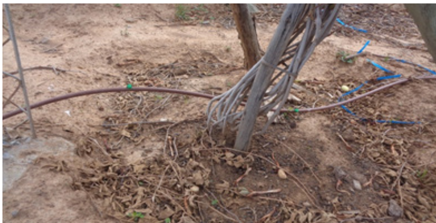
Politubo lateral con detalle de instalación de goteros.

Para terrenos con casi 0 pendiente se recomienda los goteros inundadores con caudales de 4 hasta 16 litros hora. Para terrenos con pendientes se recomienda los goteros auto compensables para la uniformidad de riego.