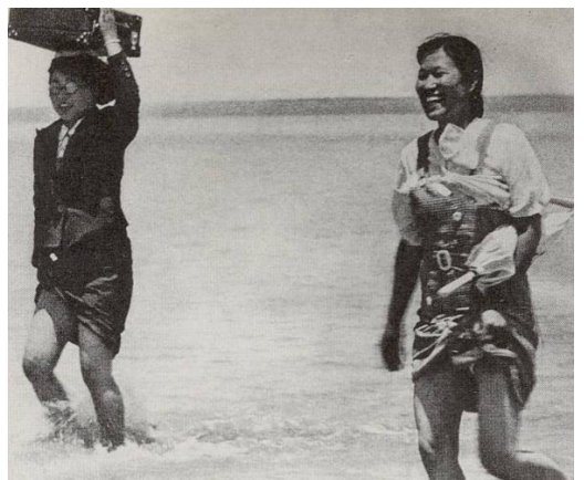
【左奥写真】米国公文書館に保管されている文書原本【写真左】ビルマで米軍の尋問に答える慰安婦。1944年8月 【写真上】軍の移動と共に移動する慰安婦。