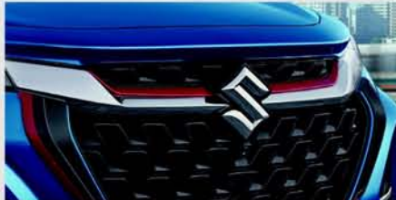
Front Grille Garnish Opulent Red