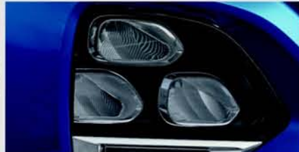
Head Lamp Garnish