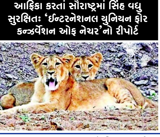
આફ્રિકા કરતાં સૌરાષ્ટ્રમાં સિંહ વધુ સુરક્ષિત: ‘ઈન્ટરનેશનલ યુનિયન ફોર કન્ઝર્વેશન ઓફ નેચર’નો રીપોર્ટ

અમદાવાદ તા.૧૧ એશિયાઈ સિહોનો વસવાટ ધરાવતાં એકમાત્ર રાજ્ય ગુજરાતના ગૌરવમાં વધુ ઉમેરો થયો હોય તેમ ઈન્ટરનેશનલ યુનિયન ફોર કન્ઝર્વેશન ઓફ નેચર (આઈસીયુએન) દ્વારા એશિયાઈ સાવજીને જોખમની શ્રેણીમાંથી બહાર મુકવામાં આવ્યા છે. સંગઠને ૨૦૦૮ માં સિહોને જોખમી શ્રેણીમાં મુકવા હતા અને હવે વ્યાખ્યા બદલાવીને તે શ્રેણીમાંથી મુક્ત કર્યા છે. સંગઠન દ્વારા ભરી કરાયેલા પ્રથમ વૈશ્વિક રીપોર્ટમાં આફ્રિકન તથા એશિયાઈ સિહો પરના જોખમની સરખામણી પણ કરી છે. આફ્રિકામાં મોટા પ્રમાણમાં શિકાર થતો હોવાના કારણોસર ત્યાંના સિહોની વસતીમાં ૭૦ ટકાનો ઘટાડો થવાની સંભાવના એશિયાઈ સિહો કરતા ૧૯ ગણી વધુ હોવાનું દર્શાવ્યું છે. એશિયાઈ સિહોની વસતી સમગ્ર વિશ્વમાં એકમાત્ર ગુજરાતમાં છે અને સંગઠનના રીપોર્ટને જ આધાર ગણવામાં આવે તો સૌરાષ્ટ્રની ભૂમિમાં તે ઘણા સુરક્ષિત છે. સંગઠનના રીપોર્ટમાં એમ કહેવામાં આવ્યું છે કે ભુક્ષણ, વર્તમાન અને ભવિષ્ય એમ ત્રણ બંધરેશનની ગણતરી કરવામાં આવે તો આફ્રિકામાં સિહોની વસતીમાં ૭૦