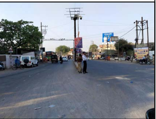
ડેરીને તોડી પાડવામાં આવી હતી. રાતોરાત આરંભાયેલા કિમોલીશનમાં તળાવ દરવાજા પાસે જવારામ સર્કલ બનાવવાયું હતું. તે માર્ગમાં પેશકદમી હોવાથી તંત્રએ તેને પાગ દૂર કર્યું હતું. જહા વહીવટી તંત્ર તથા મનપા તંત્રએ સંયુક્ત રીતે હિન્દુ-મુસ્લિમોના ધાર્મિક સ્થળો નડતરરૂપ હોવાથી દૂર કરાયા હતા. તંત્રના આ પગલાનો શહેરમાં ક્યાંય વિરોધ જણાયો નથી. કારણ કે બંને કોમોના ધાર્મિક સ્થળો હોય કોઈ રાગદેપનો પ્રશ્ન રહેતો ન હતો અને આ પગલાને શહેરની આવાકારી રહ્યા છે. આ દબાણને હટાવવા પ્રજાજનોની સુવિધા વધશે.