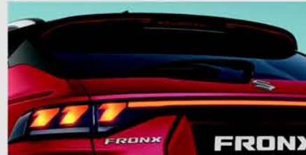
Rear Upper Spoiler Extender Black + Red