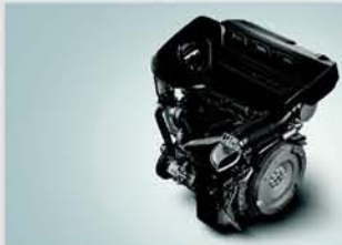
1.0L Turbo Boosterjet Engine with Progressive Smart Hybrid

*Claim verified by independent research agency - JATO Dynamics Limited for Fastest to 1Lakh sales in SUV and PV categories since launch on 19-January-2024.