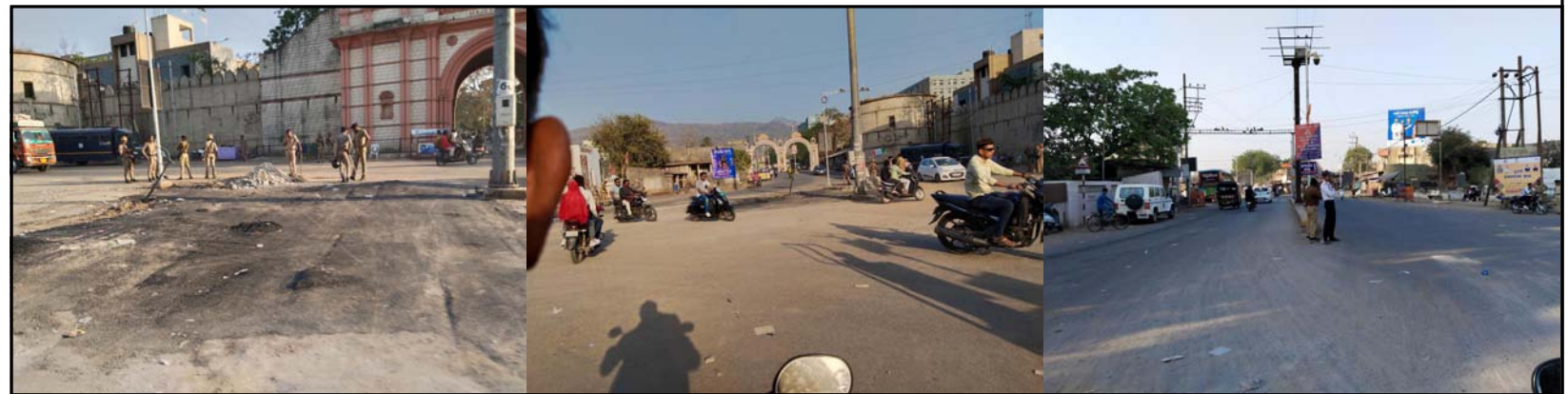
મસ્જીદની દરવાજા એકત્ર થઈ મસ્જીદને દૂર કરવાનું શરૂ કર્યું હતું. આ અંગેની મસ્જીદની દરવાજા વિસ્તારના લોકોને જાગૃત થતા ઉધમળોથી ઉઠી નજરો જોવા નીકળતા પોલીસના ઘડા જોઈ સમસામી બેસી ગયા હતા. આ કામગીરી વહેલી સવાર સુધીમાં આટોપી લઈ કાટમાળ પાગ હટાવી લેવાયો હતો. ત્યારબાદ મસ્જીદ સ્થળે પેવરથી ભરી દેવાયો હતો. સવાર થતા એસઆરપી સહિતના લોખંડી બંદોબસ્ત ઉપરાંત પોલીસ પેટ્રોલીંગ વધારી દેવાયું હતું. પાગ આ મુદ્દે કોઈ બહાર ડોકળું ન હતું. આ સાથે રેલવે સ્ટેશન રોડ ઉપર રામદેવપીરની ડેરીને તોડી પાડવામાં આવી હતી.