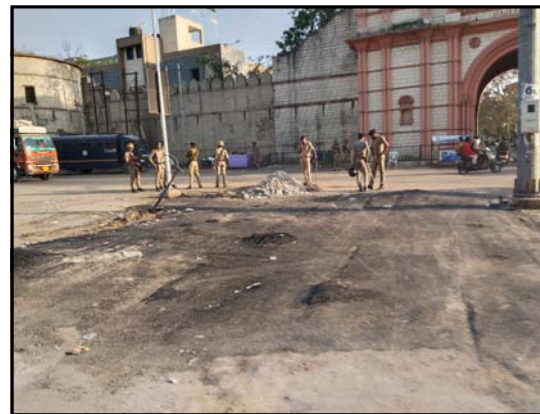
મજેવડી દરવાજા એકત્ર થઈ મસ્જીદને દૂર કરવાનું શરૂ કર્યું હતું. આ અંગેની મજેવડી દરવાજા વિસ્તારના લોકોને જાગૃત થતા ઉદ્યોગથી ઉઠી નજરો જોવા નીકળતા પોલીસના ઘડા જોઈ સમસમી બેસી ગયા હતા. આ કામગીરી વહેલી સવાર સુધીમાં આટોપી લઈ કાટમાળ પાગ હટાવી લેવાયો હતો.

જુનાગઢ તા.૧૧ જુનાગઢમાં જાહેર માર્ગ ઉપર નડતરરૂપ મંદિર, મસ્જીદ અને સર્કલને તંત્રએ રાતોરાત કિમોલીશન કરી કાટમાળ હટાવી દબાણ સ્થળે પેવર પાથરી દેતા મનપાના ઈતિહાસમાં પ્રથમ વખત મેટ્રોસીટી જેવી ઝડપે કામગીરી થઈ હતી. આ પગલાને ધ્યાને લઈ શહેરમાં લોખંડી બંદોબસ્ત ગોઠવી દેવાયો હતો. અહીંના મજેવડી દરવાજા બહાર માર્ગ વચ્ચે આવેલ મસ્જીદની કાયદેસરના માટે મનપા તંત્રએ સાતેક માસ પહેલા નોટીસ ચોટાડતા બે કેટલાક લોકોએ મસ્જીદ તોડી પાડવા માટે લઘુમતી સમાજને ગુમરાહ કરતા મોટું ટોળું એકત્ર થઈ પોલીસ ઉપર હુમલો, સરકારી મિલકતને નુકશાન કર્યું હતું. આ બનાવના ઘેરા પડયા પડયા હતા. પોલીસ તંત્રનું મોરલ તોડવાના પ્રયાસ પછી તંત્ર મક્કમ બન્યું હતું. અને મસ્જીદના આધાર-પુરાવા મનપામાં રજૂ કરાયા હતા અને સરકારી નહીં બોર્ડના હતા તેથી આ માર્ગ ઉપરની મસ્જીદને દૂર કરવા તંત્રએ નિર્ણય કરી લીધો હતો. માત્ર યોગ્ય સમયની રાહ જોવાતી હતી. દરમિયાનમાં શિવરાત્રી મેળામાં એસઆરપી સહિત ત્રણ હજાર જવાનોને બંદોબસ્તમાં ઉતારાયા હતા. જેઓ પૂર્ણ થયા બાદ બંદોબસ્તમાં રહેલા જવાનોને છૂટ્ટા કરવાના હોય છે પણ ક્રયા ન હતા. તે પાછળ માર્ગો ઉપરના મંદિર, મસ્જીદ અને સર્કલ દૂર કરવાનું આયોજન ઘડાયું હતું. આ કિમોલીશન યોજના ગુમ રાહે ઘડાઈ હતી. ગત મધરાતે પોલીસ સાબલપુર ચોકડી તથા મધુરમ બાયપાસથી શહેરમાં વાહન પ્રવેશબંધી કર્યા બાદ રાત્રીના દોઢેક વાગ્યે બે બેઝીબી ડમ્પર, માગસો, અધિકારીઓ