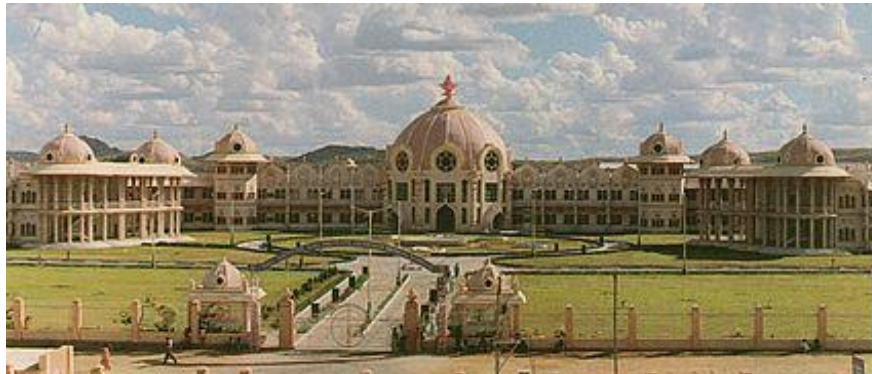
בית החולים המודרני שבפוטפרטי, נתנם ממכירת רשת "הארז רוק קפה".

הורדתי את המכונית מהאוניה, ניגש אלי אדם ואמר, "האם זו מכונית סילבר דאון משנת 1954?" עניתי "כן אדוני", הוא אמר "אני אתן לך שלושים אלף דולר עבור המכונית", חשבתי על אמי וכל העבודה הקשה שנדרשה על מנת