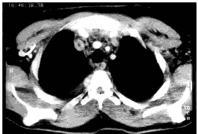
Fig. 2. Trombosis de vena cava superior.