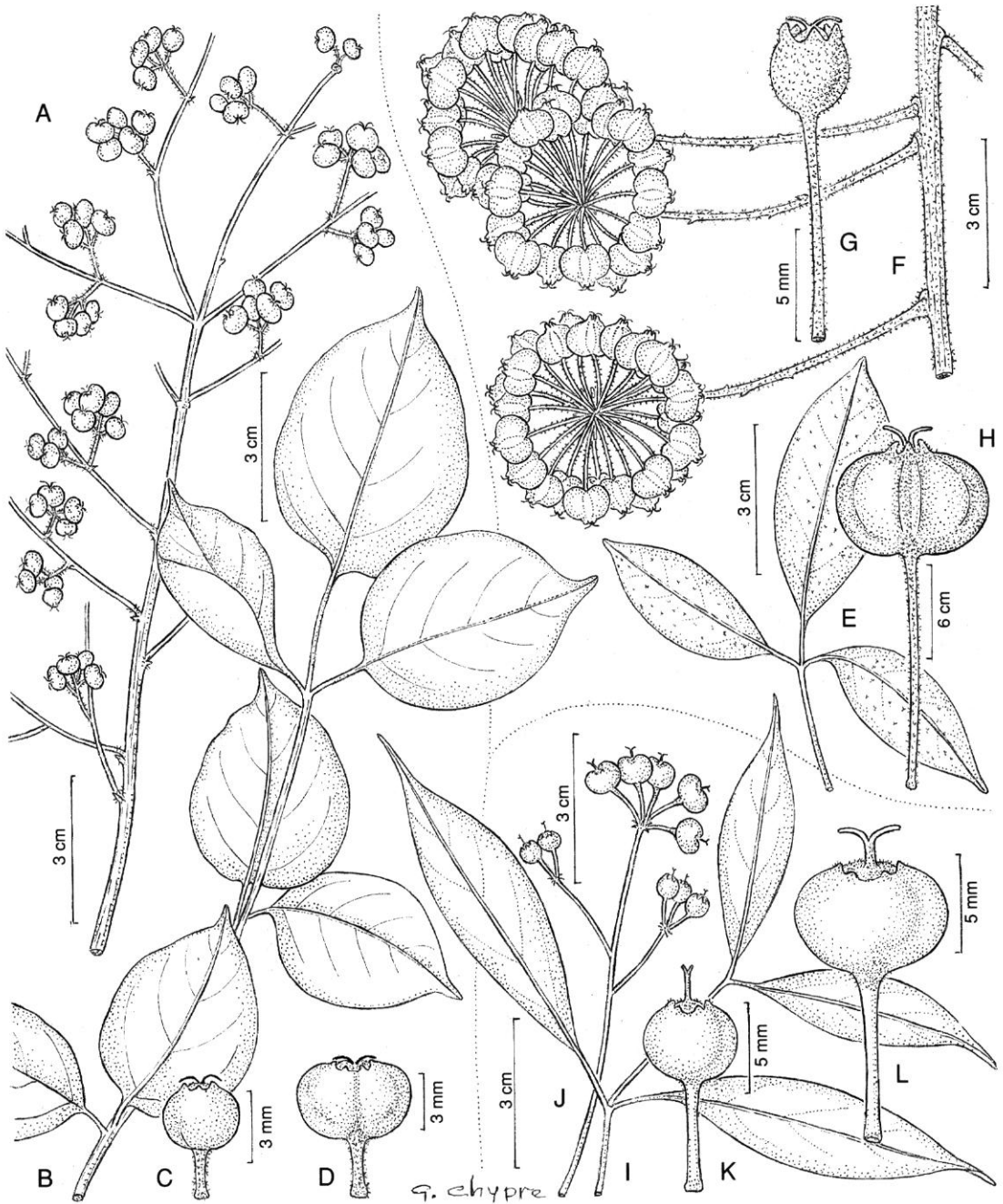
Fig. 1. — Heteropanax phanrangensis C.B. Shang : A, fragment d'infrutescence ; B, fragment de feuille composée ; C, fruit jeune ; D, fruit mûr. — H. balanseana C.B. Shang : E, fragment de feuille composée ; F, fragment d'infrutescence ; G, fruit jeune ; H, fruit mûr. — H. hainanensis C.B. Shang : I, fragment de feuille composée ; J, fragment d'infrutescence ; K, fruit jeune ; L, fruit mûr. (A-D, Poilane 9975 ; E-H, Balansa 3457 ; I-L, C.I. Lei 284).