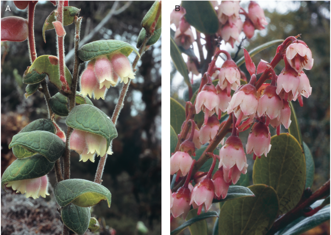
FIG. 2. — A, Vaccinium tectiflorum Danet ; B, Vaccinium minuticalcaratum J.J.Sm. var. magnibracteatum Danet. A, Danet 4316 ; B, Danet 4333.

NOM VERNACULAIRE. — Lowege (langue Lani).