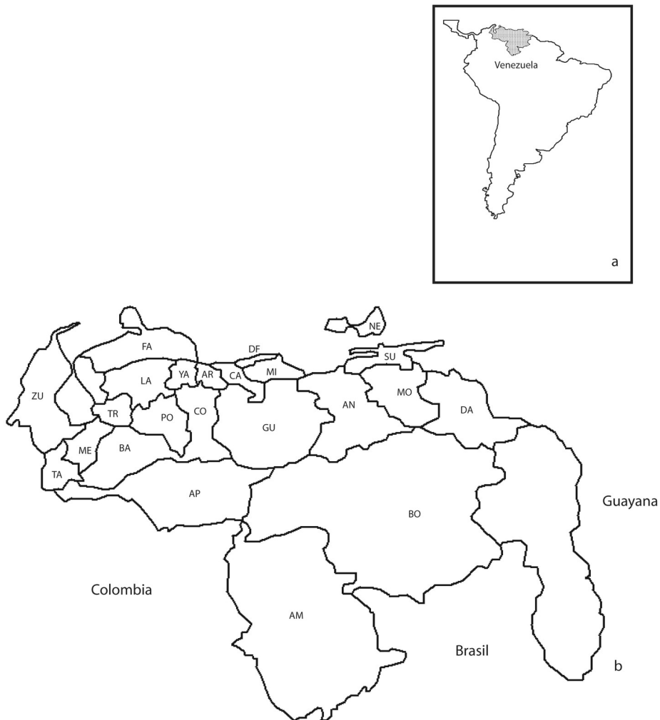
Fig. 1. Localización geográfica de Venezuela en Sur América, (a) y división política territorial del país (b). (AM = Amazonas, AN = Anzoátegui, AP = Apure, AR = Aragua, BA = Barinas, BO = Bolívar, CA = Carabobo, CO = Cojedes, DA = Delta Amacuro, FA = Falcón, GU = Guárico, LA = Lara, MI = Miranda, ME = Mérida, MO = Monagas, NE = Nueva Esparta, PO = Portuguesa, SU = Sucre, TA = Táchira, TR = Trujillo, YA = Yaracuy, ZU = Zulia. (Location of Venezuela in South America and its political division).

Tipo monzónico (Am): corresponde a una transición entre el clima Af y el Aw. A pesar de tener una estación lluviosa y otra de sequía, esta última es tan corta que permite la existencia de una vegetación selvática. Estado Amazonas, parte de la región Andina, parte del estado Zulia, Cordillera de la Costa, Estado Bolívar, Estado Monagas, Estado Delta Amacuro.