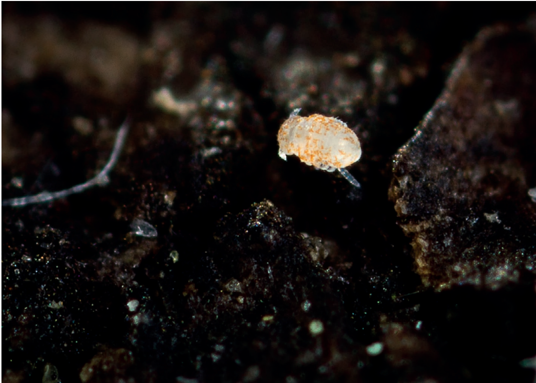
FIG. 9. — Megalothorax minimus Willem, 1900 (Neelidae), spécimen originaire du jardin du laboratoire d'Entomologie du MNHN (Paris). Taille : 0,4 mm. Photographie : C. D'Haese.

ment) ; Poinso-Balaguer & Kabakibi 1987 ; Pichard et al. 1989 ; Betsch 1991 (privation de litière) ; Ponge 1993 ; Ponge et al. 1993 (écologie expérimentale, litière), 2002 (toxicité, herbicide), 2003 (bioindicateur), 2008 (test perturbation environnement) ; Cortet & Poinso-Balaguer 1998 (décomposition de litières) ; Chauvat & Ponge 2002 (métaux lourds) ; Lek-Ang & Deharveng 2002 (zone humide) ; Cassagne et al. 2003, 2004 ; Gillet & Ponge 2003 (pollution, métaux), 2004, 2005 (pollution, sol) ; Lek-Ang et al. 2007.