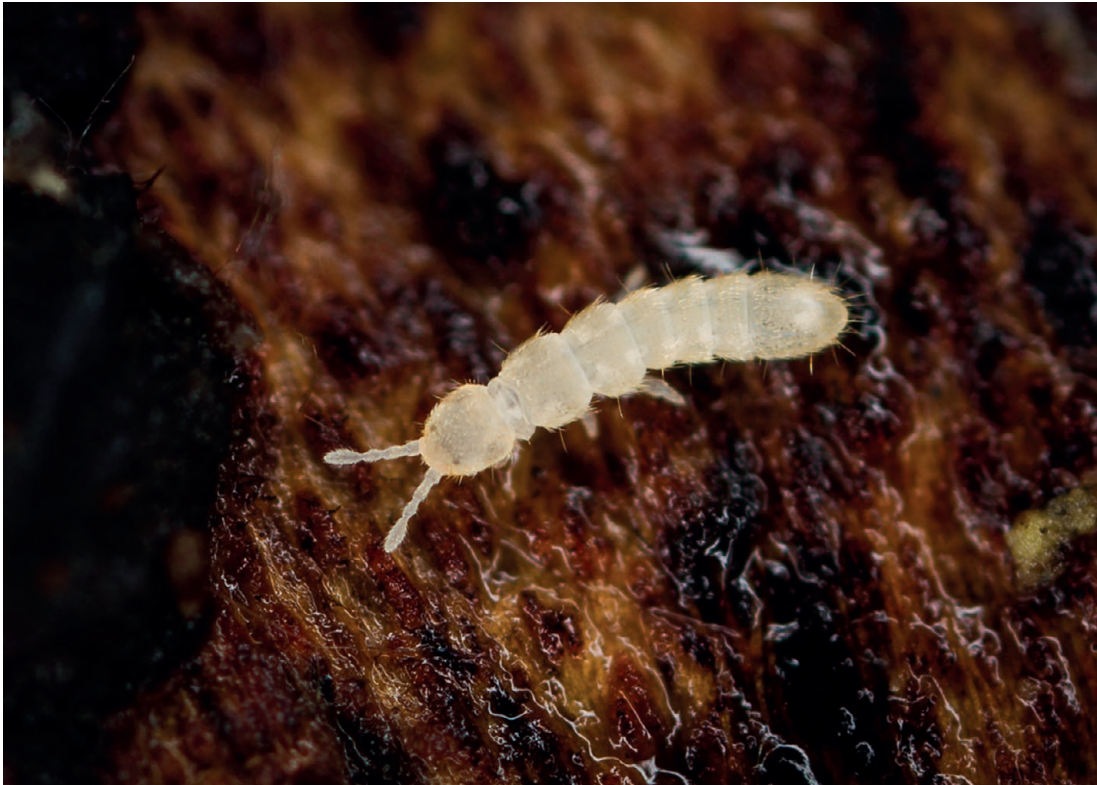
FIG. 5. — Folsomia sp. (Isotomidae); spécimen collecté dans le bois de Fontanal (hêtres), Pyrénées. Taille : 1-2 mm.

ÉCOLOGIE. — Cassagnau 1965 (écologie, sol); Deharveng & Lek 1995; Cassagne et al. 2003); Lek-Ang & Deharveng 2002 (zone humide).