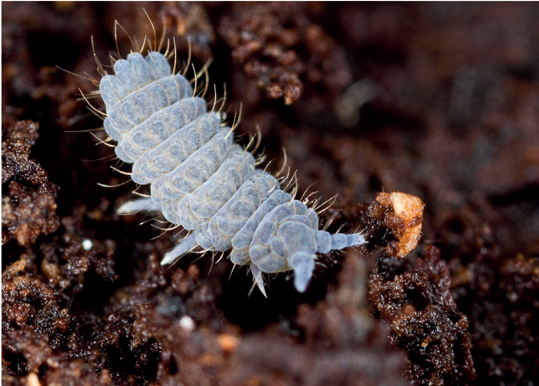
FIG. 3. — Deutonura monticola Cassagnau, 1954 (Neanuridae); spécimen collecté dans une forêt de hêtre des Pyrénées. Taille: 2 mm.