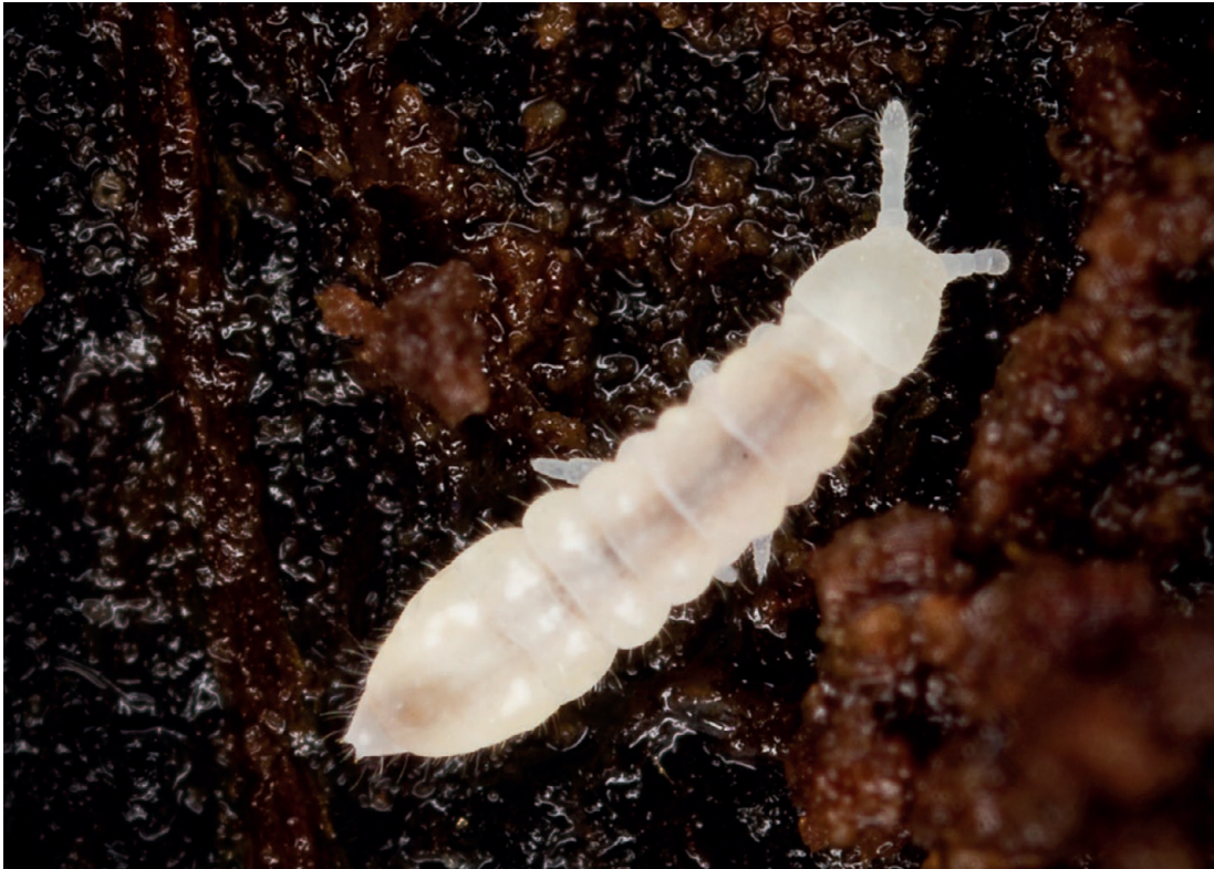
FIG. 4. — Protaphorura sp. (Onychiuridae); spécimen collecté dans une forêt de hêtre dans les Pyrénées. Taille: 1,5 mm.

Morbihan. Sables littoraux, plages (Thibaud 2006).