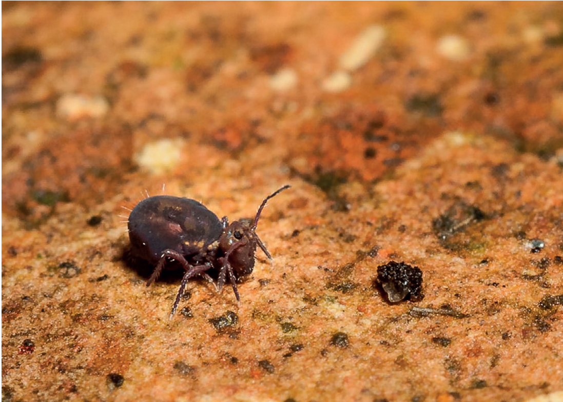
FIG. 8. — Ptenothrix atra (Linnaeus, 1758) (Dicyrtomidae). Spécimen originaire de Normandie (Cotentin). Taille : 2,5 mm.

DISTRIBUTION. — Ariège. Massif de l'Arize, 400-1 400 m (Deharveng & Lek 1995, Sminthurides niger ). — Cassagne et al. 2004. — Forêt de Freychinède, 1 350 m (Lek-Ang et al. 2007).