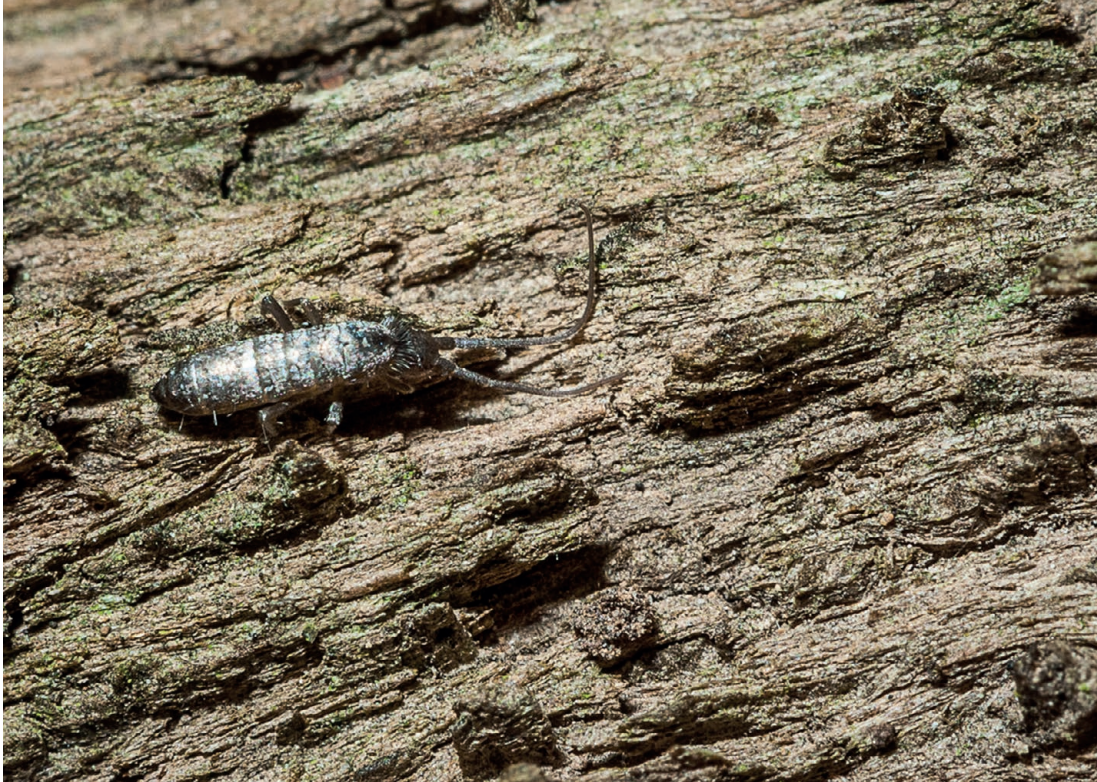
FIG. 6. — Pogonognathellus flavescens (Tullberg, 1871) (Tomoceridae). Spécimen du Nord de la France. Taille moyenne de l'espèce : 4-6 mm.

grottes (Ginet 1953). — Grottes de Gournier à Choranche et de la Glacière de Corrençon (Cassagnau 1955a). — Grottes de La Balme à La Balme-Les-Grottes, de La Fontaine Saint-Joseph à Verna, de Gournier à Choranche, Glacière de Corrençon (Ginet 1961). — Grottes du Château, de la Balme-Noire, du Gournier, des Jarrands, de Pialoux et de Taï (Gisin 1963).