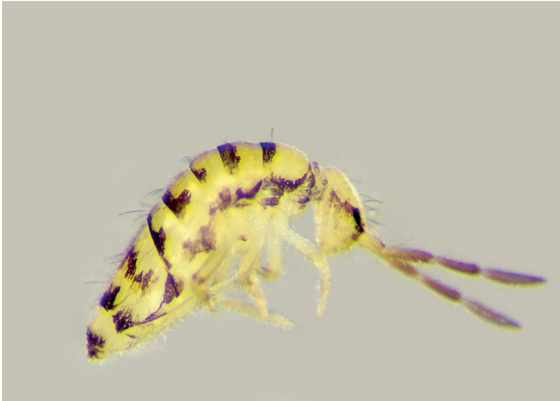
FIG. 7. — Entomobrya multifasciata (Tullberg, 1871) (Entomobryidae). Spécimen collecté au Jardin des Plantes, Paris, sous écorces de platane. Taille : 1,5 mm.

Tarn. Sidobre (Izarra 1969; Bonnet et al. 1972).