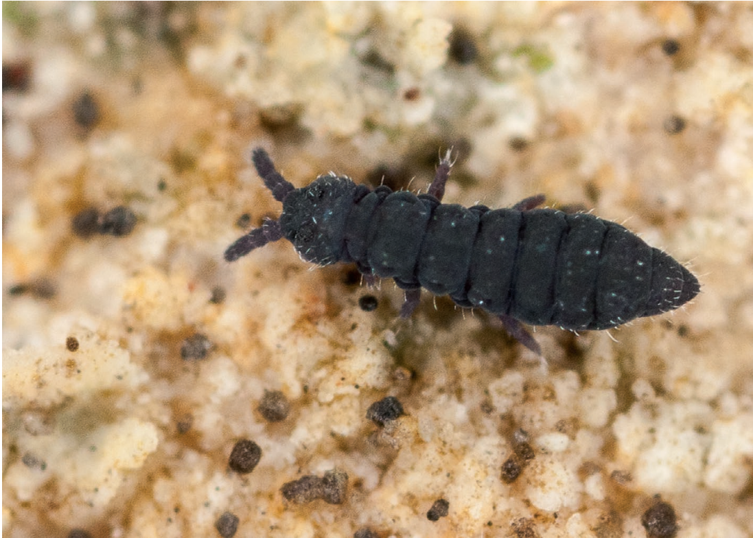
FIG. 2. — Hypogastrura cf. subboldorii Delamare Deboutteville & Jacquemart, 1962 (Hypogastruridae); spécimen collecté en Normandie (Cotentin). Taille du spécimen: 1,5 mm.

PARASITISME. — Mégnin 1878 (pseudoparasitisme du cheval, P. pityriasicus ).