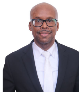
Director de Servicios Comunitarios Adventistas