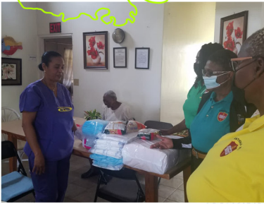
Miembros de los Servicios Comunitarios ASD de New Bethel haciendo una donación oportuna a Tabitha.