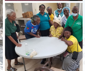
Arriba: Servicio Comunitario Adventista en Nevis, entrega de obsequios navideños, servicio de comidas calientes a la comunidad, homenaje a maestros jubilados y visitas a residentes de hogares de ancianos.