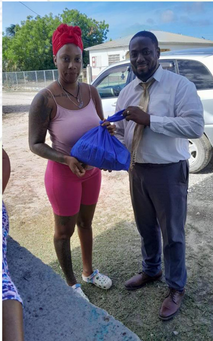
Servicios Comunitarios Adventistas en Barbuda distribuyendo paquetes de asistencia social dentro de la comunidad.