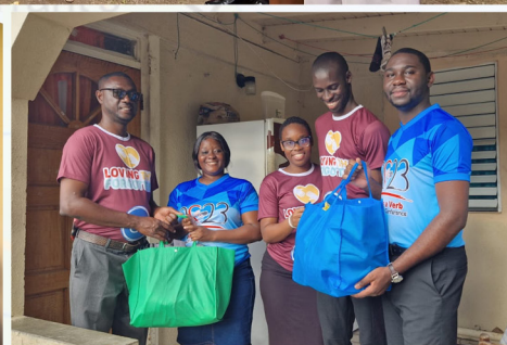
(Izquierda) Servicios Comunitarios Adventistas De Montserrat entregando un cheque a la Cruz Roja, (Arriba) entregando Biblias a la escuela primaria y entregando canastas de alimentos y paquetes de ayuda a los residentes de la comunidad.