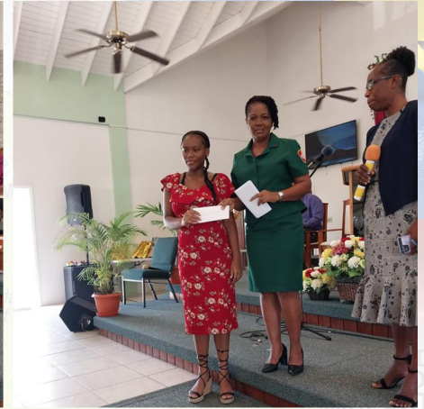
Servicio Comunitario Clare Hall brinda asistencia educativa financiera a dos estudiantes.