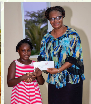
(Arriba) Servicios Comunitarios Adventistas de Sea View Farm entregando premios educativos y compartiendo comidas en comunidad. (Abajo) Extensión del personal de la oficina de SLC en VC Bird Bust, St. Johns.