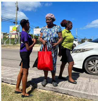
Nueva Iglesia ASD Maranatha distribuyendo paquetes de asistencia social en la comunidad.