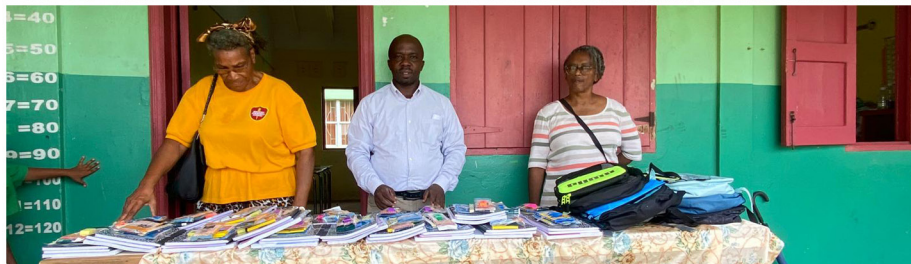
Fe En Emanuel Servicio Comunitario Adventista distribuye útiles escolares y paquetes de asistencia social a los residentes de la comunidad.