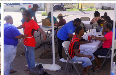
(arriba) Servicios Comunitarios Adventistas de Molineux distribuye paquetes de atención y ofrece servicios de salud en su iniciativa de Impacto Comunitario.

Pero recibiréis poder, cuando haya venido sobre vosotros el Espíritu Santo, y me seréis testigos en Jerusalén, en toda Judea, en Samaria, y hasta lo último de la tierra.