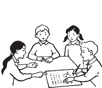
Siarad a chynllunio gyda'ch gilydd

Sylwer: Os byddwch wedi dewis gweithio ar raglen radio neu deledu, bydd angen i chi drafod sut gallwch ddangos eich rhaglen – yn ddelfrydol byddwch yn gallu ei recordio.