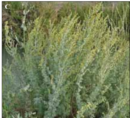
Fig. 15. Artemisia absinthium . A. Ilustración, con detalles de capítulos, flores y aquenio (Thomé, 1903). B. Capítulos. C. Plantas.