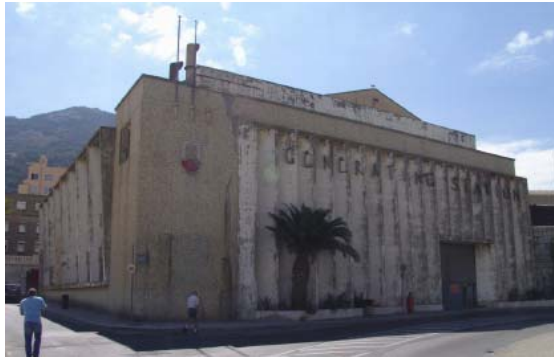
Cynt – generadur segur yng nghanol y ddinas

Dangoswyd y King's Bastion fel esiampl o adfywio trefol yn Gibraltar i rai a ddaeth i'r gynhadledd: