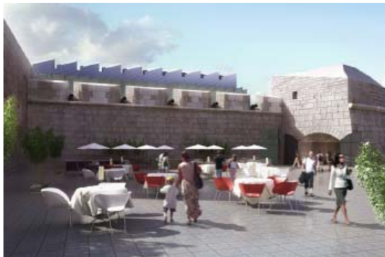
Wedyn – canolfan hamdden â manau mewrol ac allanol sy'n cynnig nifer o gyfleusterau