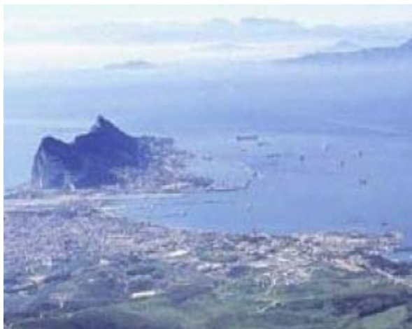
Gibraltar o Sbaen yn edrych i'r De tua Morocco

2. Gwahoddwyd Gangen Cymru o Gymdeithas Seneddol y Gymanwlad i anfon dirprwyaeth o bedwar Aelod i fynychu 38ain cynhadledd Rhanbarth Ynysoedd Prydain a gwledydd Môr y Canoldir gan Senedd Gibraltar yng Ngwesty'r O'Callaghan Elliot Hotel Gibraltar rhwng 11 a 15 o fis Mai, 2008. Yn unol ag Arfer y Gangen gwahoddwyd mynegiannau o ddi-ddordeb mewn mynychu'r gynhadledd gan yr holl Aelodau a dewiswyd y ddirprwyaeth gan Bwyllgor Gweithredol y Gangen. Yn ychwanegol at y ddirprwyaeth mae'r Cynulliad yn darparu, ar sail rota gyda'r Alban, Gogledd Iwerddon, Cyprus a Malta un o dri cynrychiolydd rhanbarthol i Bwyllgor Gweithredol y CPA.