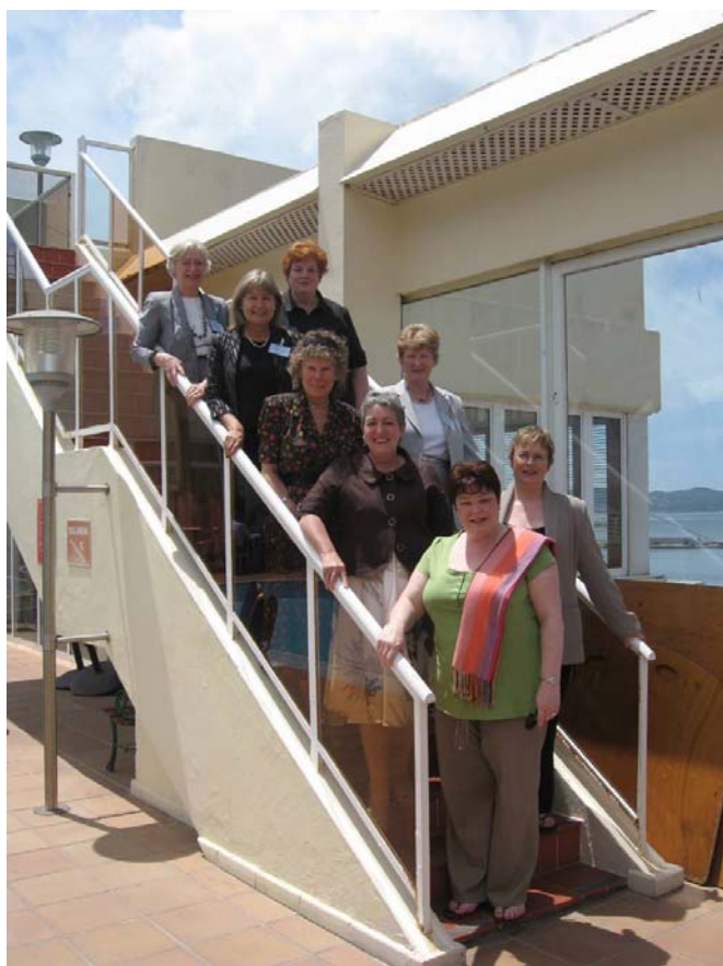
Cynrychiolwyr o blith y merched wedi ymgasglu'n anffurfiol fel grŵp yn ystod y gynhadledd.

13. Mae'r gynhadledd flynyddol hon yn rhoi cyfle i gynnull ynghyd seneddwr o Ynysoedd Prydain a Rhanbarth Môr y Canoldir i rannu gwybodaeth a thrafod materion sydd o ddiddordeb i bawb ohonynt. Mae llawer y gall y Cynulliad ei ddysgu oddi wrth ei gymaryddion rhanbarthol yng Nghymdeithas Seneddol y Gymanwlad. Mae'r dewis thema a mabwysiadu'r cyhoeddiad yn ddatblygiadau mae'r ddirprwyaeth yn eu croesawu. Mae'r ddirprwyaeth yn sylweddoli'r angen i'r CPA weithio ar bob lefel o fewn a rhwng seneddau er mwyn profi'n barhaus ei bod yn berthnasol i weithio tuag at werthoedd cyffredin democratiaeth gyfranogol a chymuned seneddol wybodus.