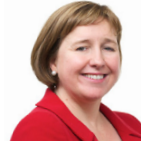
Lynne Neagle AS Llafur Cymru