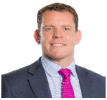
Rhun ap Iorwerth AS Plaid Cymru