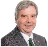
Dai Lloyd AS Plaid Cymru