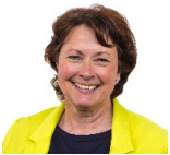
Angela Burns AS Ceidwadwyr Cymreig