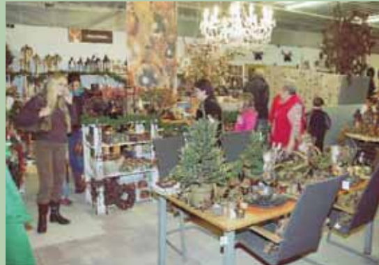
Am Freitag wurde der diesjährige Weihnachtsmarkt im Pflanzenparadies Mauch eröffnet. Fünf Themenbereiche laden hier zum Staunen und zur Inspiration ein. Das Lob der ersten Besucher war einhellig.

Neu im Markt ist ein vergrößerter Außenbereich, wo viel zum Thema Licht und Feuer im Garten, um Tannengrün und Aussendekoration den Markt im Eingangsbereich bereichert. Verstärkt wird auch der Bereich der Floristik, ebenfalls im Eingangsbereich, wo florale Dekoration auf höchsten Niveau von den Mitarbeiterinnen des Pflanzenparadieses angeboten wird.