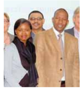
Minister Mahlbandile Dickson Qwase (Mitte) war mit einer Delegation an der HGS.