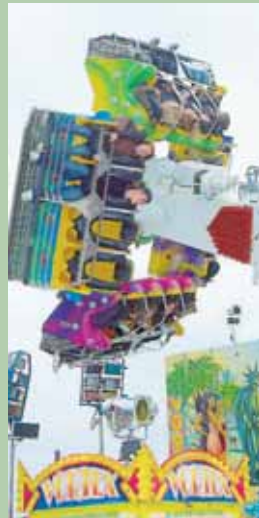
Spaß und Vergnügen auf dem Rummelplatz am Kirchweihwochenende in Hilzingen.

13.45 Uhr: Parade der Oldtimer vom Rathaus zum Zwinghofplatz mit Vorstellung der einzelnen Fahrzeuge