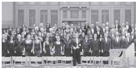
Das Vokalensemble Gaienhofen tritt mit der »Paukenmesse« und dem »Lobgesang« von Haydn am Sonntag in Singen auf.

das Päckchen. Gegen 18.30 Uhr wurde dann Entwarnung gegeben. In dem Päckchen war ein sogenanntes Treibladungspulver (herkömmliches Schießpulver), das sich ohne eine entsprechende Vorrichtung nicht entzünden ließ. Michael Aschenbrenner spricht von dem Päckchen als einem nach dem Waffengesetz verbotenen Gegenstand. Zum Vorgang liegt der Polizei bisher weder ein Bekennerschreiben noch ein Bekennerruf vor. Momentan wird die gesamte Bandbreite der Ermittlungen abgedeckt. Die Spurensicherung der Kripo bearbeitet den Fall. Auch Zeugen werden noch vernommen. Albrecht von Truchseß von der Real-Pressestelle sagte, Real sei es in erster Linie darum gegangen, die Situation so schnell wie möglich zu entschärfen. »Die Sicherheit unserer Kunden hat für uns oberste Priorität«, so Truchseß.