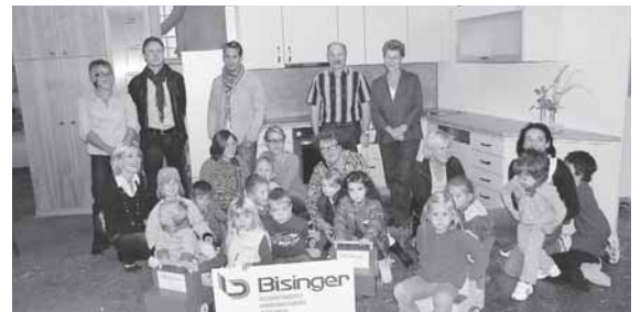
Ihre neuen Spielzeugzüge probierten die Kinder natürlich gleich aus.

Aktion und meinte dazu, so ein Spielzeug, das sei doch für Kinder wie ein Möbelstück. Es binde die Aufmerksamkeit und gestalte die Spielzeit mit. Das bewies die Kinder auch gleich, die gemeinsam mit ihren Betreuerinnen die bunten Spielzeugzüge abholten. Im Nu ergriffen sie Besitz von ihren neuen Zügen und verwandelten die ganze Schreinerei in einen riesigen Kinderbahnhof. Dabei gab es natürlich auch »Haltesignale«, besonders vor den gelungenen Ausstellungsstücken der Schreinerei, den Einbauküchen und Kleiderschränken oder dem massiven Nussbaumschrank mit einer völlig neuen und überraschenden Türöffnung ohne Griffe. Die Schreinerei Bisinger ist ein alter Familienbetrieb mit langjähriger Tradition.