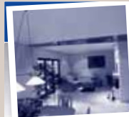
Beleuchtung nach Wunsch und ohne auszuräumen