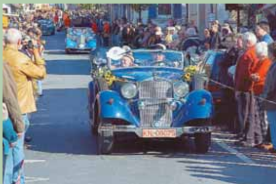
Die Oldtimer-Parade am Samstag Nachmittag wird wieder zahlreiche Zuschauer nach Hilzingen locken.