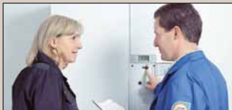
Der Austausch eines alten Heizkessels durch ein Brennwertgerät bringt deutliche Energiekosteneinsparungen – ohne Wechsel des Energieträgers.

leistung der Geräte exakt dem jeweils aktuellen Bedarf entspricht, wird nicht nur ein spürbar reduzierter Verbrauch erzielt, die leisen Betriebsgeräusche steigern auch den Wohnkomfort (mehr unter www.weishaupt.de ). Sonnenkollektoren sind eine gute Ergänzung, um Trinkwasser zu erwärmen und, bei entsprechender Auslegung, auch die Heizung unterstützend zu versorgen. Kollektoren auf dem Dach kamen aus nachvollziehbaren Gründen nicht für die Heizung im Schloss Neuschwanstein infrage – hier setzt die Bayerische Schlösserverwaltung auf moderne Brenntechnik aus dem Hause Weishaupt, um die Heizkosten im Griff und die Bausubstanz unverändert zu halten.