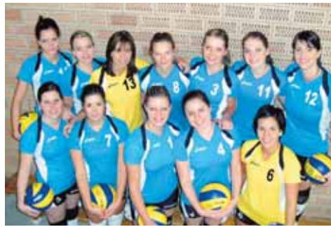
Erfolgreich sind die Damen des Volleyball-Clubs Bohlingen.

Für ein volles Tagesprogramm sorgt die BMS-All-Star-Band (Blasmusikschüler und Dirigenten der letzten 10 Jahre) und die vereins eigene aktive Kapelle.