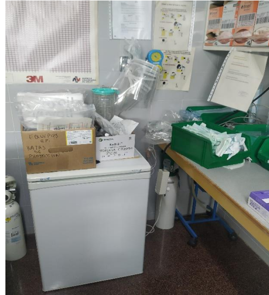
Nevera de maternidad (sala de medicación)