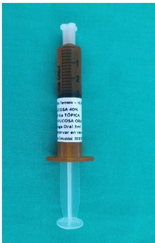
Jeringa precargada 3 ml