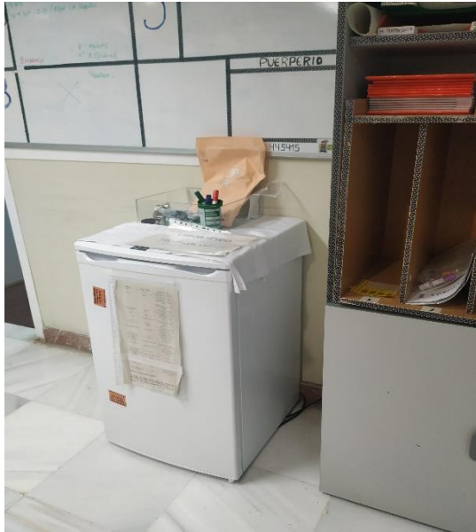
Nevera de puerperio