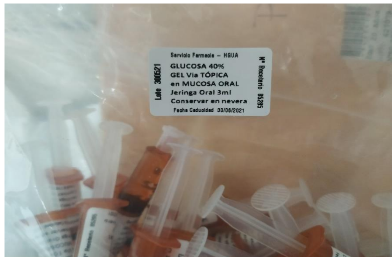
Bolsa con jeringas precargadas