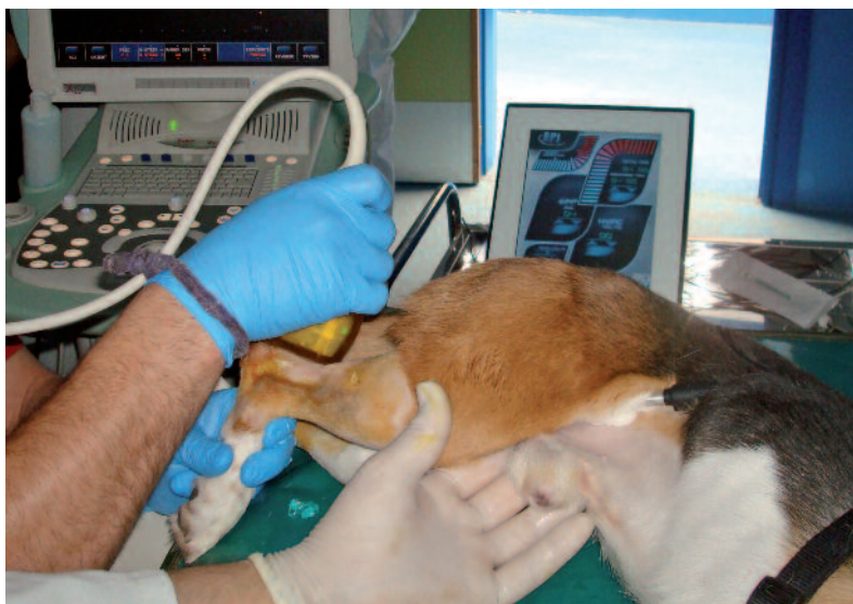
Figura 3: Ubicación del electrodo ánodo en la zona inguinal.

En todos los animales tratados, ya sea en el caso de los sanos utilizados en la fase experimental preliminar o en los enfermos, una vez desaparecidos