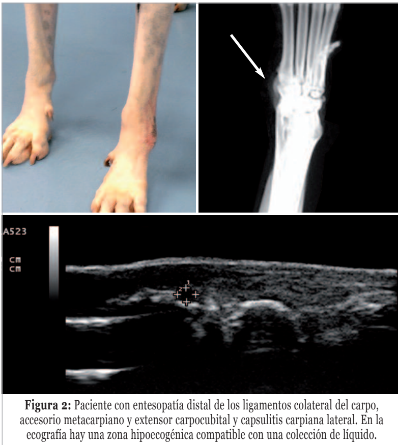
Figura 2: Paciente con entesopatía distal de los ligamentos colateral del carpo, accesorio metacarpiano y extensor carpocubital y capsulitis carpiana lateral. En la ecografía hay una zona hipocogénica compatible con una colección de líquido.

En medicina veterinaria, la técnica EPI® no se está utilizando de manera rutinaria como en fisioterapia humana; sin embargo, ya que los tendones y las fascias tienen la misma composición histológica, los resultados de los tratamientos deberían ser similares.