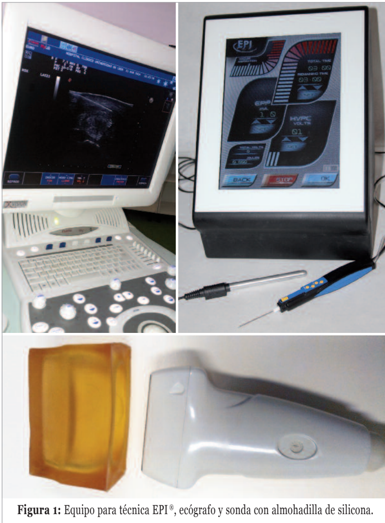
Figura 1: Equipo para técnica EPI®, ecógrafo y sonda con almohadilla de silicona.