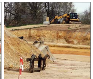
Visualisierung Neubau (r.) • SMF | Bauarbeiten am Paradeplatz • Peter Tandler

befindet, kommt es in diesem Jahr bei Veranstaltungen am Neuen Gestüt vorübergehend zu Einschränkungen. So kann der grasbewachsene Hang zwischen der B- und der C-Tribüne zu den Hengstparaden 2023 nicht genutzt werden und es stehen daher auch keine Stehplatzkarten zum Verkauf. Wir bitten alle Besucher der Hengstparaden, das bei ihrer diesjährigen Planung zu berücksichtigen.