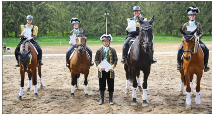
Historische Quadrille vom RFV Striegistal wird Vizemeister

Zu Rondo Veneziano und tollen, passenden Kostümen punkteten sie vor allem in der Trabtour mit viel Harmonie und insgesamt guter Raumausnutzung. Die Kombination der drei Großpferde mit einem Pony machte es teilweise schwierig, die ideenreichen Figuren synchron vorzustellen, aber mit einer 6,8 in der A - Note und 7,5 in der B - Note sicherten sie sich hinter Pirna den Silberplatz.