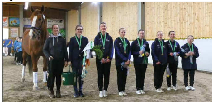
Zweitplatzierte Gruppe vom RC Leipzig Knauthain