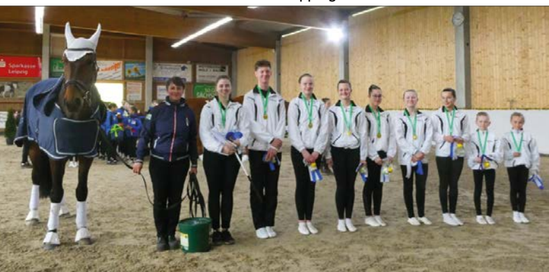
Landesbeste L-Gruppe Team 3 des RVV Schenkenberg

Team 3 des gastgebenden RVV Schenkenberg sorgte für eine Überraschung und wurde als Landesbeste L-Gruppe geehrt.