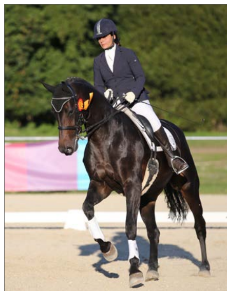
Text ▪ Foto: K. Weigel

Zwei Siege und zwei zweite Plätze gab es für Kirsten von Menges und ihre Pferde Tolle Lotte und Bella Lotta