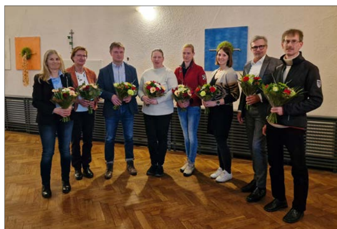
Der neu gewählte Ausschuss Allgemeiner Pferdesport

den Jahr für alle breitensportlichen Veranstaltungen binden werden. Die Leitgedanken zur Überarbeitung der WBO lagen laut FN vor allem darin, den Einsteigerbereich im Turniersport zu stärken und so den Weg zur LPO mit fachlich aufsteigenden Ansprüchen zu ebnen. Des Weiteren war die Regelwerksdiskussion durch die Aspekte des Tierschutzes, der Sicherheit, der Liberalisierung und die vielfältigen Teilnehmerinteressen geprägt. In seiner rund 1,5-stündigen Präsentation stellte Thomas Ungruhe sämtliche Anpassungen der 16 Grundregeln, Änderungen in den Wettbewerben sowie Ergänzungen der kommenden WBO 2024 vor und gab praxisnahe Beispiele. So werden ab dem kommenden Jahr auch Hobby Horsing-Wettbewerbe in die WBO aufgenommen. Oft belächelt erfreuen sich das Steckenpferd-Reiten inzwischen bei vielen Kindern und Jugendlichen großer Beliebtheit. Anschließend stellte sich Thomas Ungruhe den Fragen und Anmerkungen der Weiterbildungsteilnehmer, wodurch z.T. die Skepsis gegenüber den Neuerungen genommen werden konnte.