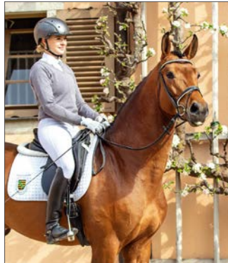
RUBINIRO v. Rubin Royal