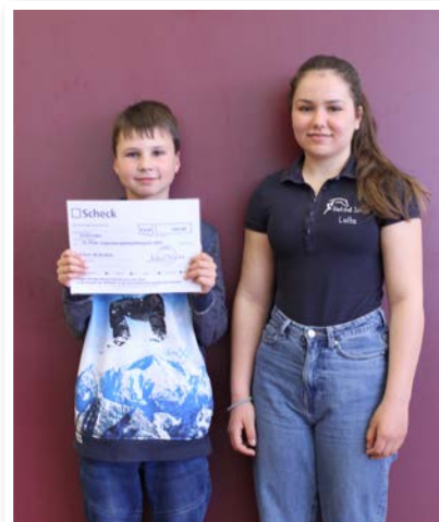
Den dritten Platz belegte in diesem Jahr die RSG Thüringer Burgenland Mühlberg e.V.