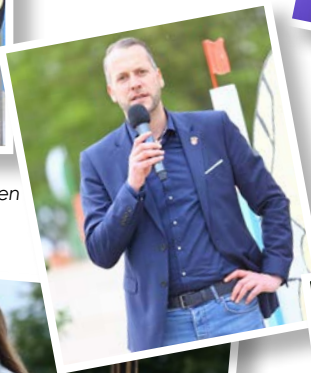
Kondition & Ausdauer war auch bei den abendlichen Partys gefragt.