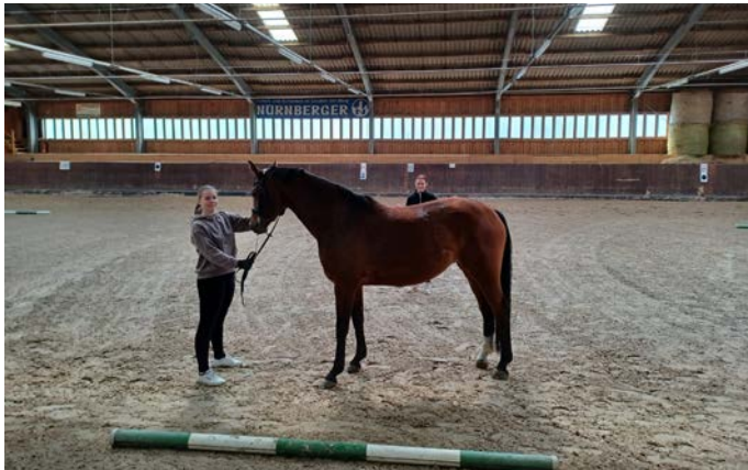
das korrekte Aufstellen muss geübt sein