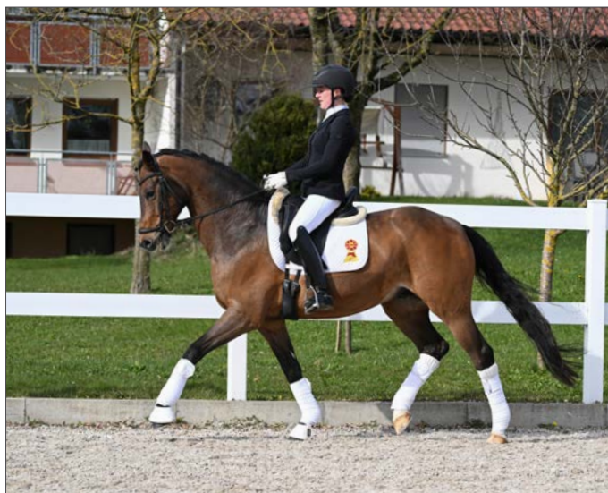
Text: K. Weigel

Auktionsspitze war eine Dressurstute von Q-Sieben aus einer Mutter von Lord Loxley namens Q-Black. Eine besondere Nachwuchstute, die mit extravaganter Grundgangartenqualität aufwartet. Kunden aus Dänemark erwarben sie für 28.000 Euro. Zweitteuerstes Pferd war der Lord Moritzburg- Ra Nachkomme Los Angeles aus der Zucht der Familie Jähnigen vom Pferdehof Preußenforst, ausgestellt wurde der sympathische Sportler von Claudia Rassmann. Der braune Wallach war selbst schon erfolgreich bis zur Klasse M**, ein komplettes Dressurpferd zum sofortigen Losreiten. Er wechselte für 25.000 Euro den Besitzer und verbleibt in Deutschland. Nach Großbritannien wechselte Quäntchen Glück, eine fünfjährige Stute v. Quitoll aus einer Simonetti- Mutter. 15.000 Euro investierte der britische Kunde für die flinke Parcoursdame mit bester Einstellung. Ein fünfjähriger Wallach von San Muscadet- Castilio DR aus der Zucht von Michael Schneider aus Schleusingen brachte 8250 Euro und wurde an einen Endkunden verkauft. Der langbeinige Dressurnachwuchs wird in Deutschland seine weitere Ausbildung genießen. Zum Lot gehörte auch Dexter, ein Wallach v. Diacontinus - Champion For Pleasure, der mit bester Galoppade und exzellentem Sprungablauf aufwarten konnte. Der Teilnehmer am Freispringcup in Leipzig aus der Zucht des Pferdehofes Göbel hatte einige Interessenten, die ihn auch probierten, er verbleibt jedoch vorerst bei seinem Besitzer.