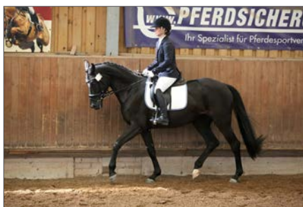
In der Abteilung der Reitpferde siegte die fünfjährige Rosi v. Fürst Wilhelm – Decurio (Z.u.B. Agrarprodukte Ludwigshof e.G.)