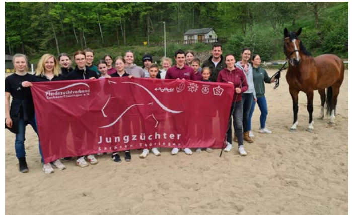
rege Teilnahme am Kaderlehrgang zum Thema "Vormustern"