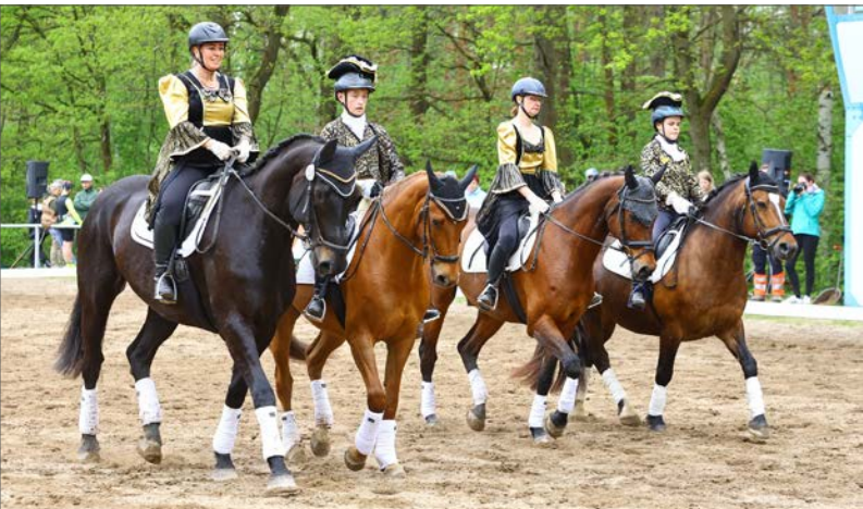
Historische Quadrille vom RFV Striegistal

Zu Rondo Veneziano und tollen, passenden Kostümen punkteten sie vor allem in der Trabtour mit viel Harmonie und insgesamt guter Raumausnutzung. Die Kombination der drei Großpferde mit einem Pony machte es teilweise schwierig, die ideenreichen Figuren synchron vorzustellen, aber mit einer 6,8 in der A - Note und 7,5 in der B - Note sicherten sie sich hinter Pirna den Silberplatz.