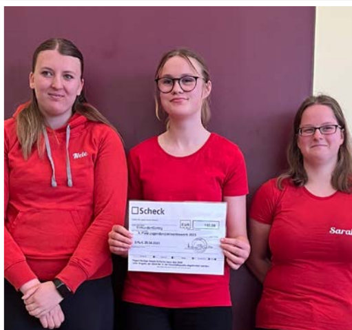
Rang zwei belegte der Reitverein Kinderleicht e.V.