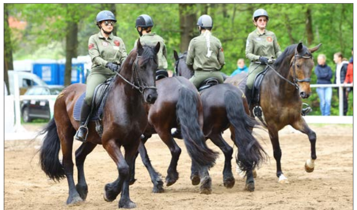
die Mixed-Quadrille aus Altmittweida zum Motto "Top Gun"