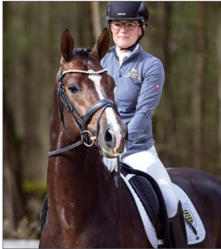
BOOM v. Bonds