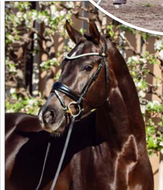
VISION GOLD v. Viva Gold

Unsere vielversprechenden Neuzugänge unter den dressurveranlagten Reitpferden haben im Frühjahr gute Fortschritte in ihrer Grundausbildung gemacht. Für unsere Züchter haben wir