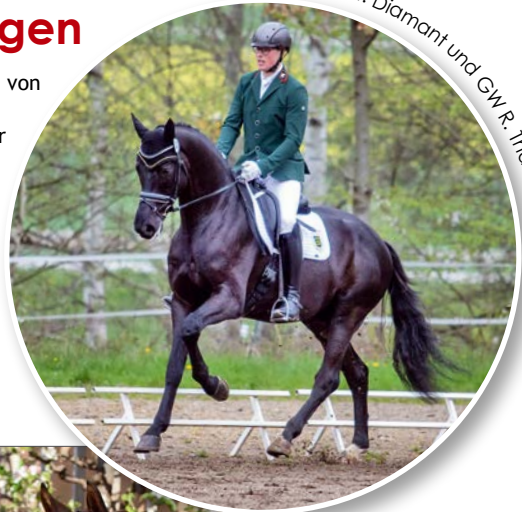
St. Diamant und G.W.R. Thalman