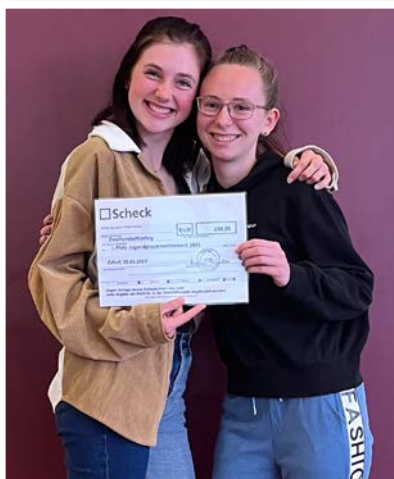
Sieger im Jugendprojektwettbewerb 2023 wurde der RV Pferde in Harmonie Elbstromthal

Bei Fragen zu Ehrungen oder verschiedenen anderen Themen steht die Jugendleitung jederzeit gerne zur Verfügung.