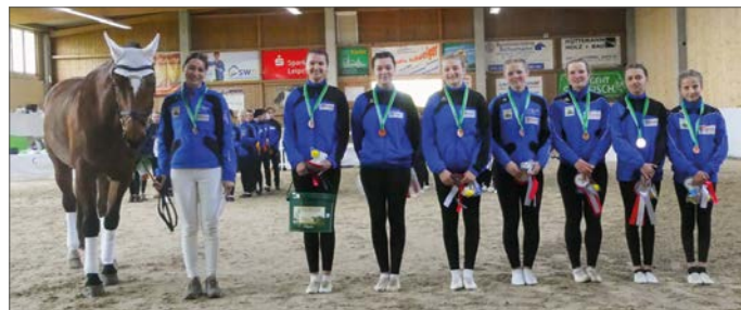
Die Bronzemedaille ging an das SSZ Liebertwolkwitz

Am Ende profitierte Schenkenberg 3 am meisten von der wechselnden Platzierung, so dass sie Gold bei der Landesbestenermittlung entgegennehmen. Silber ging an die Knauthainer und Bronze an die Liebertwolkwitzer.