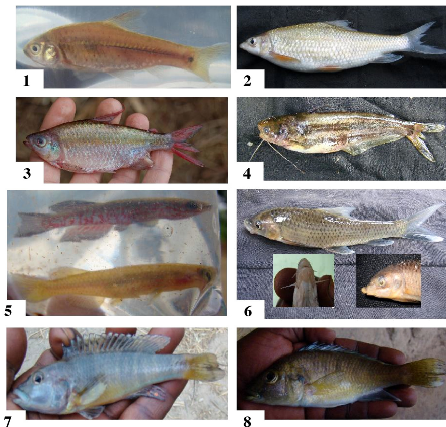
Figure 2. - Poissons endémiques de l'Inkisi. 1 : Barbus vanderysti , 86 mm LS ; 2 : Varicorhinus robertsi , 155 mm LS ; 3 : Nannopetersius mutambuei , 96 mm LS ; 4 : Schilbe zairensis , 98 mm LS ; 5 : Aphyosemion labarrei , 30 mm LS, en haut ♂, en bas ♀ ; 6 : Labeobarbus sp., 188 mm LS ; 7 : Haplochromis sp., 82 mm LS ; 8 : Chetia sp., 132 mm LS [Endemic fish of Inkisi basin.]

L'analyse canonique de redondance à partir des matrices stations-variables environnementales et stations-espèces a permis d'opposer sur l'axe 1 (34,1% de l'information) les stations à berge herbeuse (Behe, à gauche de l'axe) à celles pourvues de gros blocs de roche (Gblo, à droite). L'axe 2 (19,9%) oppose les stations larges (Larg) à celles qui sont