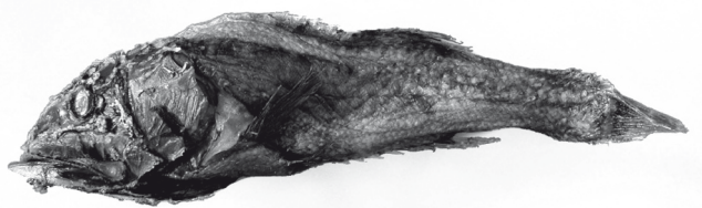
Figure 1. - Gibberichthys latifrons , MNHN 2003-1017, 134 mm LS, Archipel des Marquises.