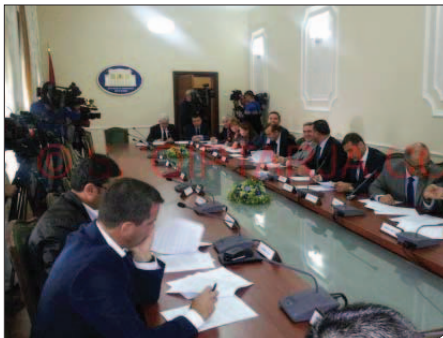
Komisioni Parlamentar i Ligjeve

e mazhorancës. Të enjten Partia Demokratike ankimoi vendimin qeverisës e për të vonuar zbatimin e ligjit, në Gjykatën Kushtetuese. Në kushtet e mungesës së deputeteve të opozitës, mazhoranca pritet të miratojë e vetme, aktin normative më të kundërshtuar deri më tani të qeverisë Rama.