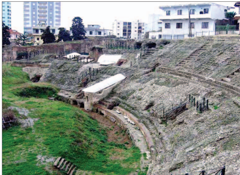
Amfiteatri i Durrësit

Përzgjedhja e këtij monumenti u bë duke marrë në konsideratë nevojën emergjente për konservim, ruajtje dhe gërmime të mëtejshme për zbulimin e plotë të këtij objekti me vlera unike historike, arkitekturore dhe kulturore, si dhe rolin e tij në zhvillimin e turizmit kulturor në qytetin e Durrësit, por dhe të turizmit shqiptar. Programi "7 Më të Rrezikuarit" u lanca në janar 2013 si një formë ndërfaqësore publike, duke inkurajuar anëtarët e Europa Nostra të aplikojnë për objekte/monumente përfaqësuese të trashëgimisë kulturore nga vendet përkatëse, që kanë nevojë për më