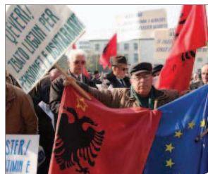
Ish-ushtarakët gjatë një proteste

Para këtyre ndryshimeve, nenit 4, paragrafi 2 i Ligjit Nr. 10142, thoshte se: "Paga referuese përbëhet nga paga bazë mujore për gradë, sipas viteve të shërbimit dhe shtesat mbi pagë, ose nga paga bazë mujore për funksion dhe shtesat, që përcaktohen e zbatohen për të njëjtën gradë apo funksion në datën e lindjes së të drejtës së një përfitimi. Për efekt të përcaktimit të përfitimit, paga referuese llogaritet si mesatare e pagave referuese, sipas viteve të qëndrimit në atë gradë apo funksion. Pagat referuese të njësuara dhe rregullat e llogaritjes së pagës mesatare referuese për të gjithë karrierën përcaktohen me vendim të Këshillit të Ministrave". Me aktin normativ, tashmë, për efekt të llogaritjes së përfitimit, paga referuese neto është paga që rezulton pas zbritjes, nga paga referuese, të kontributit të detyrueshëm të sigurimit shoqëror dhe shëndetësor, plus tatimin mbi të ardhurat