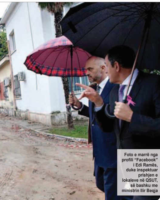
Foto e marrë nga profili "Facebook" i Edi Ramës, duke inspektuar prishjen e lokaleve në QSUT, së bashku me ministrin Ilir Beqja