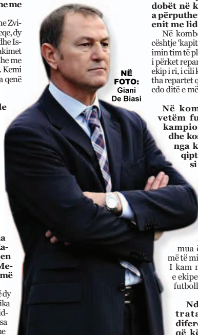
NË FOTO: Gianni De Biasi

'El Clasico' mes ekipit të Barcelonës dhe ekipit të Realit të Madridit është përcaktuar që të zhvillohet më datë 26 tetor në orën 18:00. Vendimi është marrë nga Federata Spanjolle e Futbollit duke pasur parasysh që ndeshja e parë derbi mes dy ekipeve me një rivalitet të vjetër dhe të ashpër të ndiqet maksimalisht edhe në Azi dhe në Amerikën Latine. Ndeshja do të zhvillohet në stadiumin 'Camp Nou' dhe pritet që përveç arenës në Barcelonë të ndiqet edhe nga mbi 100 mijë spektatorë në të gjithë botën anëmbanë.