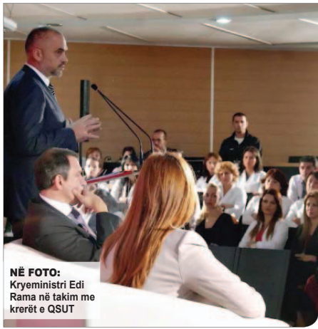
NË FOTO: Kryeministri Edi Rama në takim me krerët e QSUT

mjekë kishin mundësi që ta bënin karrierën e tyre në spitalet më të mira të botës, por zgjedhën të vijnë në Shqipëri për ta na bindur të gjithëve se mjekësia nuk është vetëm aparatura dhe teknologji, por është mbi të gjitha mision dhe vizion. Dhe ne i garantojmë se në këto reforma që do të ndërrojmë do të na kenë për krah dhe duam ti kemi në krah. Aktualisht jemi në një gjendje, kur vetëm 2012 është mbyllur me