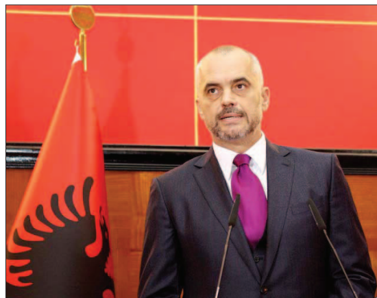
Kryeministri Edi Rama

Zgjimi i një shteti tërësisht të përgjurmur, me pjesë të tëra të trupit të tij që janë të paralizuar dhe me