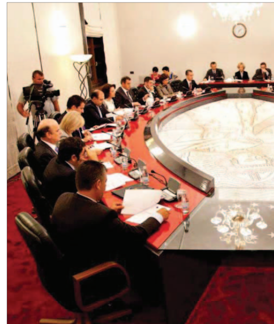
Mbledhje e Këshillit të Ministrave

"S'përfshihen ministrat, kreu i Kuvendit, krerët e institucioneve kushtetuese, si Kryeprokurori, Kryetari i Gjykatës Kushtetuese, i Gjykatës së Lartë, Drejtori i Përgjithshëm i Doganave, Drejtori i Përgjithshëm i Tatimeve etj, që quhen funksione të kategorisë së parë".