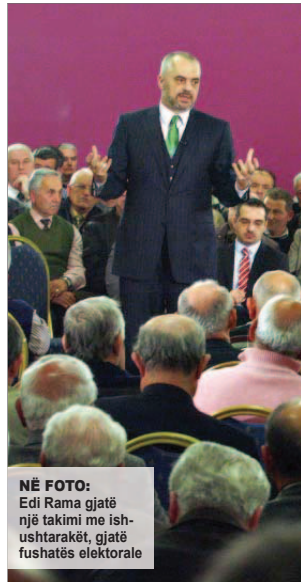
NË FOTO: Edi Rama gjatë një takimi me ish-ushtarakët, gjatë fushatës elektorale

Gjatë fushatës elektorale, kreu i PS Edi Rama tekta ka akuzuar qeverinë e Berishës se u ka mohuar të drejtat ushtarakëve, ka deklaruar se do të shfuqizojë aktin normativ që cënon të drejtat e tyre. "S'ka dyshim që ndër ato akte të pashembullta, barbarie, antikushetuese, antidemokratike, antinjerëzore, siç është edhe ky akt që ne do ta shfuqizojmë si akt i parë i respektit të qeverisë sonë ndaj njerëzve të zakonshëm të këtij vendi, padyshim do shfuqizojmë edhe aktin normativ që Salu në kundërshtim me Kushtetutën dhe në mungesë të plotë respekti për dinjitetin tuaj e miratoj. Do ta shfuqizojmë si shprehje e respektit tonë për të gjithë ju", tha Rama atë kohë.