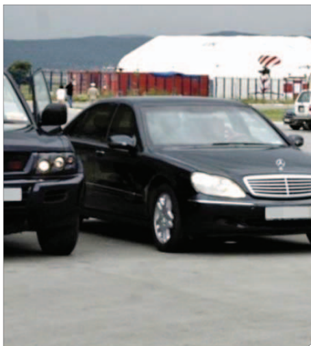
Automjete të deputetëve

Kryetari i mazhorancës së majtë njëherësh kryeministër i vendit po mban premtimin elektoral për një lehtësim të shpenzimeve për shërbimet të zyrtarëve të lartë të shtetit. Në këtë mënyrë shpenzimet e transportit për funksionarët e lartë, një ndër elementët ku është shënuar një tarifë e lartë shpenzimi ka qënë "viktima" e parë e qeverisë së re, duke kursyer miliona lekë në vit, të cilat do të përdoren në sektorë të tjerë shërbimesh në favor të qytetarit. Kështu, një ndër vendimet e para të qeverisë "Rama" me ndikim në buxhetin e shtetit ka qënë ai për uljen drastike të shpenzimeve të transportit për funksionarët publikë si dhe nëpunësit civil. Ky shkurtime shpenzimesh është përfshirë në një projektligj të qeverisë që ka si qëllim disiplinimin e shpenzimeve të transportit për një sërë funksionarësh që konsiderohen të kategorisë së dytë. Sipas këtij projektligji çdo deputet, parvësisht largësisë nga zona e tij elektoral, nuk do të shpenzojë më shumë se 40 mijë lekë në muaj për transportin e tij, nga rreth 45 mijë lekë që ishte limiti më parë. Ndërsa funksionarët e tjerë, këtë kufi do ta kenë 20 mijë lekë nga 35 mijë që e kanë aktualisht. Ndërkohë që zv.ministrat do të kenë një kuotë për shpenzime transportit që nuk i kalon të 15 mijë lekët në muaj. Në këtë dokument nuk përf-