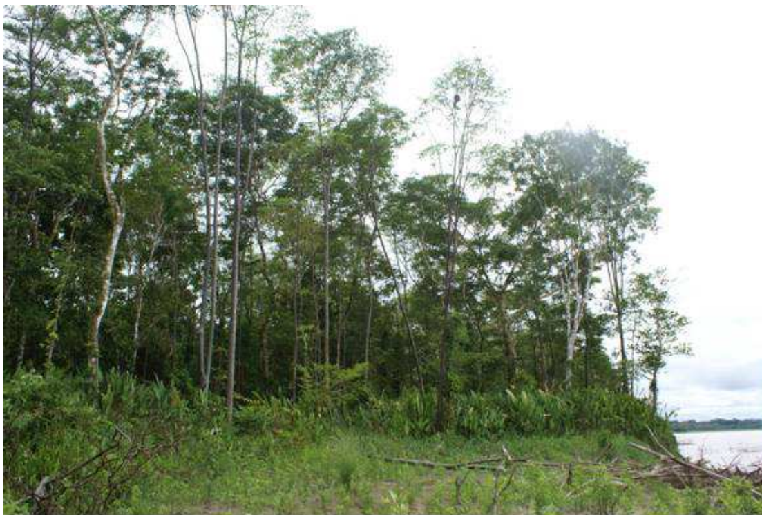
Foto N° 03. Comunidades sucesionales ribereñas, “Capironal”, mostrando a Calycophyllum spruceanum .