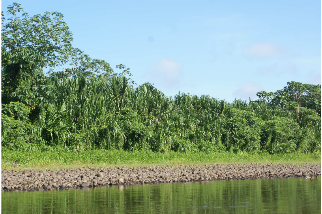
Foto N° 01. Comunidades sucesionales ribereñas, mostrando la dominancia de Gynerium sagittatum .