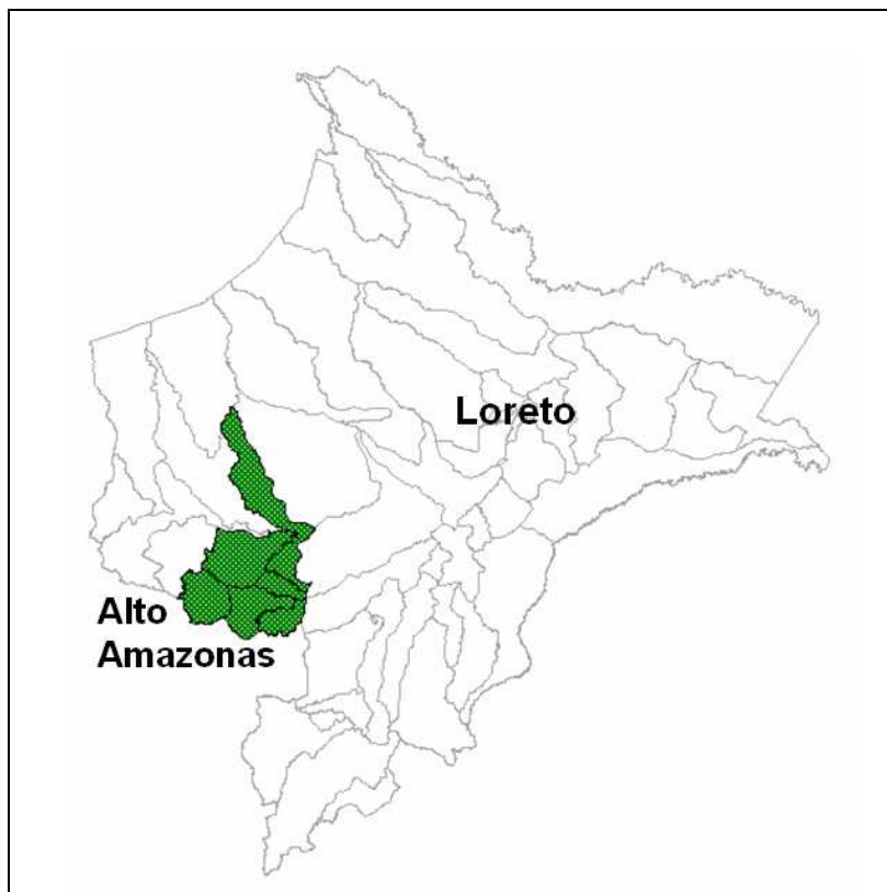
Fig. 01. Área de estudio correspondiente a la provincia de Alto Amazonas