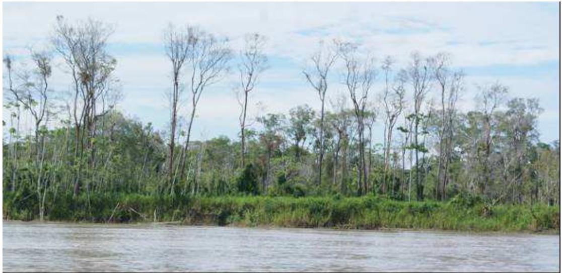
Foto N° 02. Comunidades sucesionales ribereñas, “Capironal”, mostrando la caducifolia de Calycophyllum spruceanum .

Socratea exorrhiza (huacrapona), Astrocaryum huicungo (huicungo, chambira), Phytelephas (yarina) y Euterpe predatoria (huasai). Generalmente, seguido de las llanuras meándricas, y de las planicies inundables, hacia el interior están parches pequeños de “aguajales densos y mixtos”, con dosel que supera los 30 m de alto, y densidades de palmeras, Mauritia flexuosa “aguaje”, mayores de 100 individuos/ha, asociadas a Euterpe precatória “huasaí”, Mauritiella aculeata “aguajillo”, descritos para el Amazonas por Mejia et al. (2000).