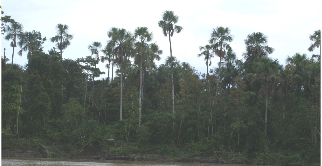
Bosques pantanosos de palmas mixtas.