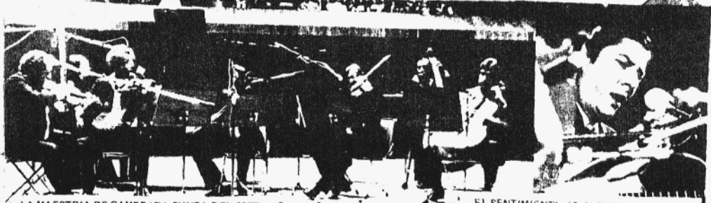
LA MAESTRIA DE CAMERATA PUNTA DEL ESTE