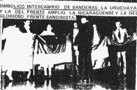
SIMBOLICO INTERCAMBIO DE BANDERAS: LA URUGUAYA Y LA DEL FRENTE AMPLIO, LA NICARAGUENSE Y LA DEL GLORIOSO FRENTE SANDINISTA.