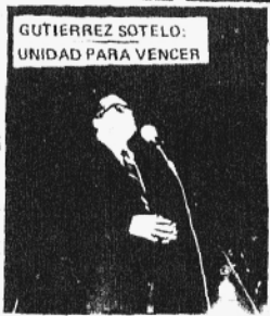
GUTIÉRREZ SOTELO: UNIDAD PARA VENCER