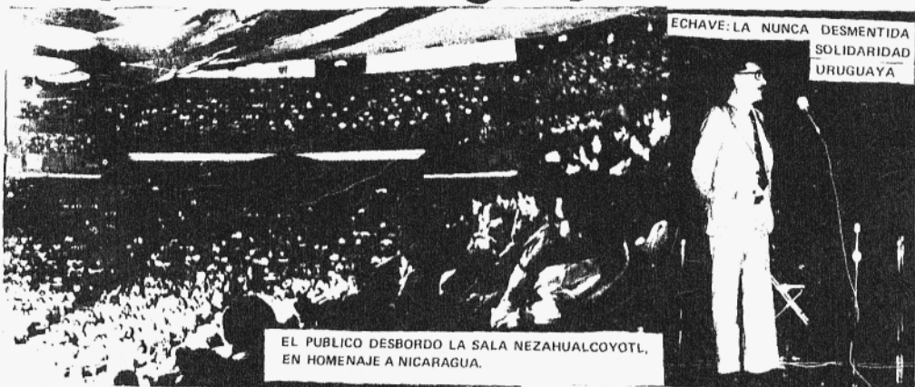
ECHAVE: LA NUNCA DESMENTIDA SOLIDARIDAD URUGUAYA