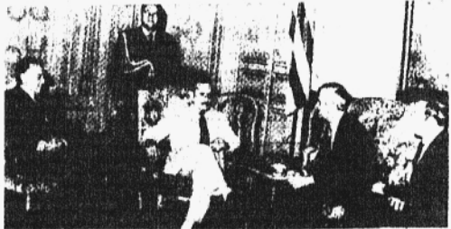
ALVAREZ CON EL ENVIADO DE REAGAN.

En la cuarta vez en seis meses que el gobierno sanciona a La Democracia, órgano de la agrupación Por la Patria que dirige Wilson Ferreira Aldunate, ahora exiliado", concluye el cable. Cabe agregar que, durante este lapso, ha sido mayor el plazo durante el cual el periódico ha estado clausurado, que aquel durante el cual se autorizó su circulación.