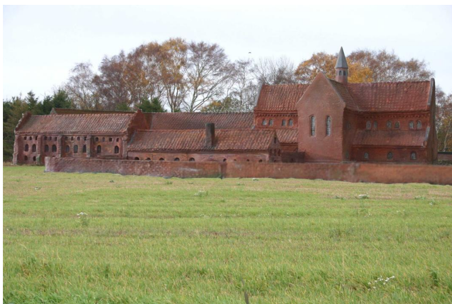
Model af Esum Kloster

Omkring år 1140 havde ærkebiskop Eskil købt det stykke jord, hvor Esum kloster senere blev grundlagt. Oprindeligt var der bygget et lille benediktiner kloster, der nu var blevet forladt af munkene. Cistercienser munkene flyttede ind i det forladte kloster, og Esum Kloster blev indviet til et cistercienser kloster i året 1151.