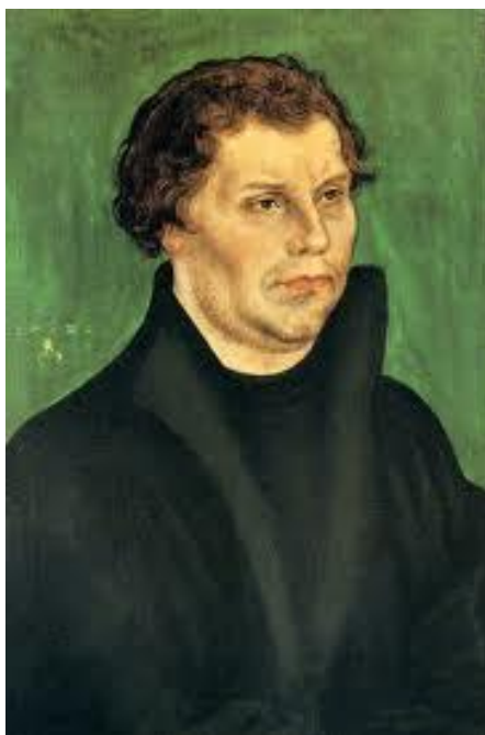
Portræt af Martin Luther

I 1400-tallet var den katolske kirke en af de store magthavere i Europa både politisk og religiøst. Med tiden udviklede den katolske kirke blandt andet idéen om, at mennesket kunne være medvirkende til sin egen frelse ved at betale aflad til kirken eller ved at leve et særligt fromt liv. Dette anfægtede munken og reformatoren Martin Luther voldsomt. I år 1517 opsatte han sine berømte 95 teser, hvor han startede diskussionen om den katolske kirkes eksisterende praksis. Hermed begyndte et langvarigt lægmandsopgør med den katolske kirke. Det er dette opgør, vi kalder for reformationen.