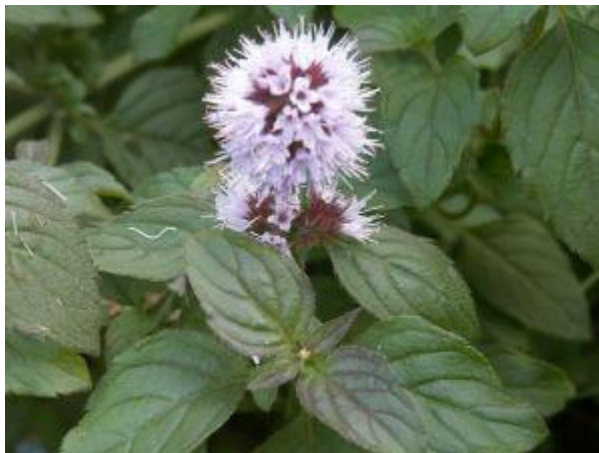
Vandmynte vokser hvor der er fugtigt. Den dufter af mynte.