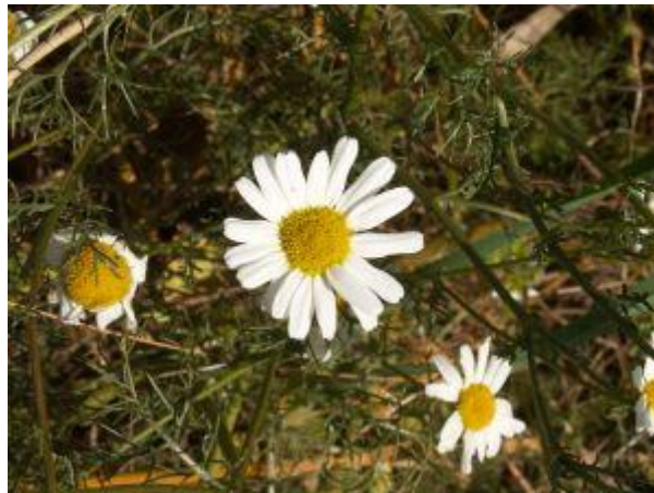
Vellugtende kamille virker helende på hud med betændelse.

Du kan tørre dine urter, ved at hænge dem med hovedet nedad i bundter på en snor et luftigt og tørt sted. Det tager cirka en uge at tørre urter - alt efter hvor tykke planterne er. Når urterne er helt tørre, piller du dem i stykker og lægger dem i dåser eller glas.