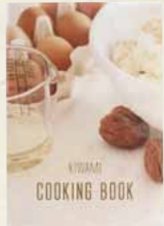
●パワースチームオーブン専用クッキングブック(B5判37ページ)