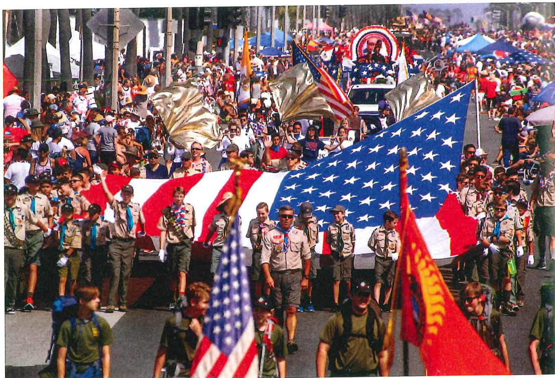
På nationaldagen den 4 juli anordnas många parader i USA. Här är det scouter i Kalifornien som bär en stor amerikansk flagga.

Varför firar USA nationaldag den 4 juli?