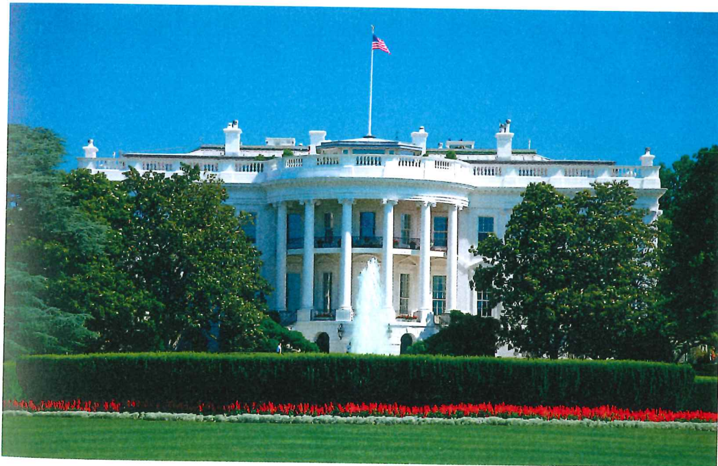
Vita huset i Washington D.C. är officiell presidentbostad och en symbol för den politiska makten i USA.

Hur skulle den nya staten styras? Var lade man den nya huvudstaden?