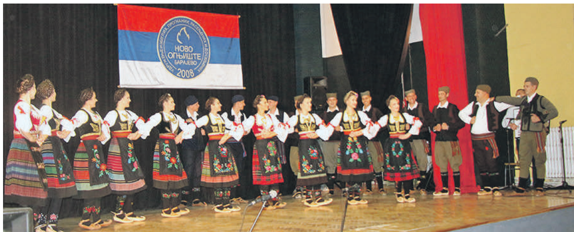
» Величанствен наступ АКУД Шумадија

У БАРАЈЕВУ ОДРЖАНО 12. ЗАВИЧАЈНО ВЕЧЕ УДРУЖЕЊА НОВО ОГЊИШТЕ