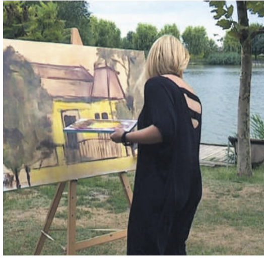
» Језеро Лагуна рај за риболовце, али и сликаре