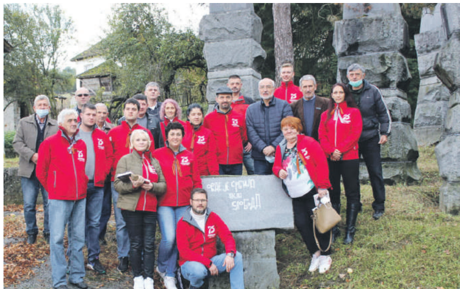
» Учесници каравана са представницима општине Крупња у Белој Цркви

принос за ослобађање овог града (15. септембар 1944. године) дали и борци Црвене армије и да се у име свих антифашиста Ваљева и овом приликом захваљује њиховим потомцима, као и људима из каравана који слиједи славну традицију својих војника.