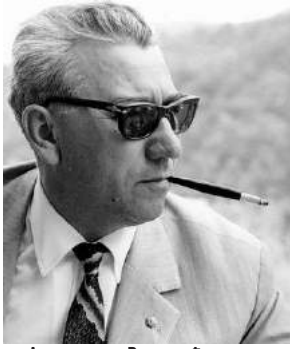
» Александар Ранковић

Прегледамо ми све испод моста, сваки околни жбун, сваку узвисину, обале Коране, распоредим полицијце, поставим се на мјесто са кога могу да имам потпун поглед на мост и на све око њега. Добро смо скривени: ћутимо, чекамо цијелу ноћ и добар дио сутрашњег дана. А од Ранковића и његове пратње ни абера. Затим ми стиже