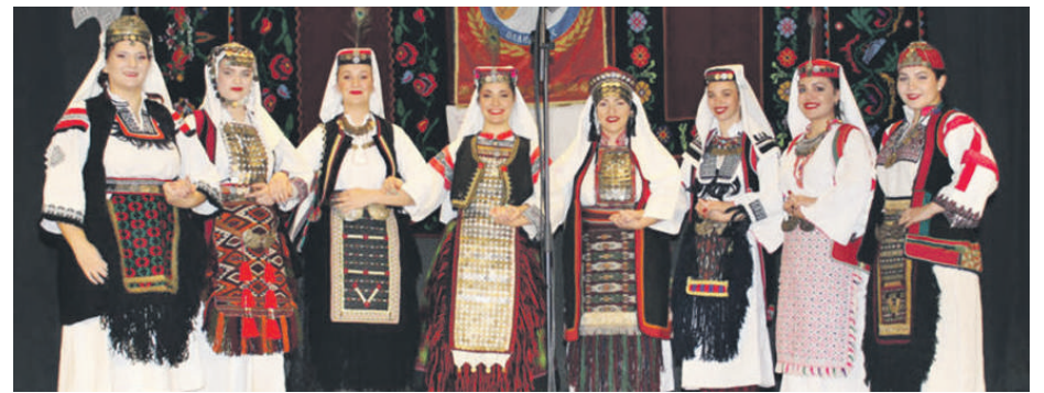
» Женска пјевачка група Академског друштва Нови Београд

– Велика Грета, Женска пјевачка група Врејено – КУД Илија Прерадовић – Банатско Карађорђево, Крајишка група Перућани – КУД Славко Гајин – Војка, Мушка пјевачка група Банија – Завичајно