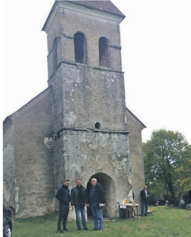
» Испред Цркве Свете Петке у Прибудућу

Основни проблем ових мјеста која се налазе на граници између Лике и Далмације представља повезаност са