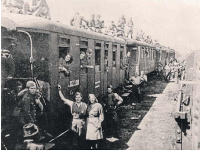
» Воз којим су колонисти 1945. године стигли у село