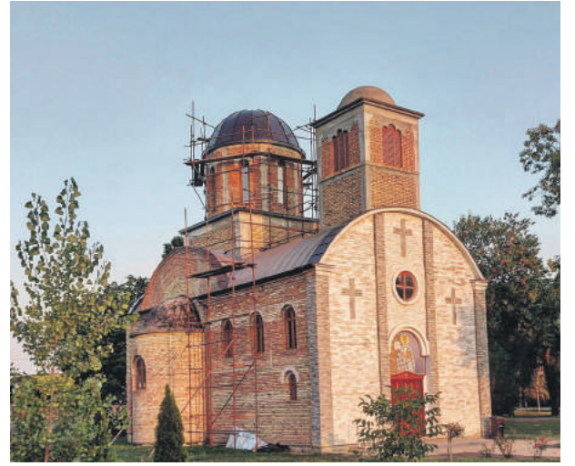
» Храм Светог Василија Острошког и Тврдошког