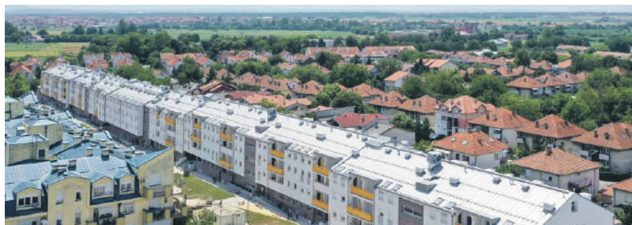
» Потребно је да се ријешити стамбено питање за још најмање 12.000 избјегличких породица

Комесаријат за избјеглице и миграције одбија захтјеве за грађевински материјал породицама које су у ранијем