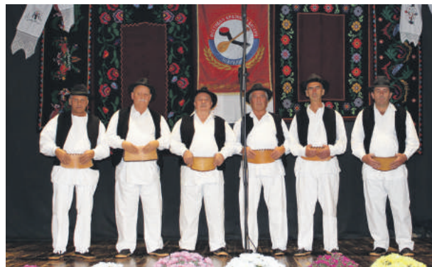
» Мушка пјевачка група Банија

Учесници 18. фестивала Крајишки бисери – Пландиште 2020 су Женска пјевачка група Филигран Културни центар Зрењанин, Женска пјевачка група Академског друштва за његовање музике Гусле – Кикинда, Женска пјевачка група КУД Младост