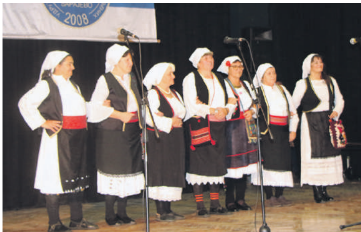
» Женска пјевачка група Банија