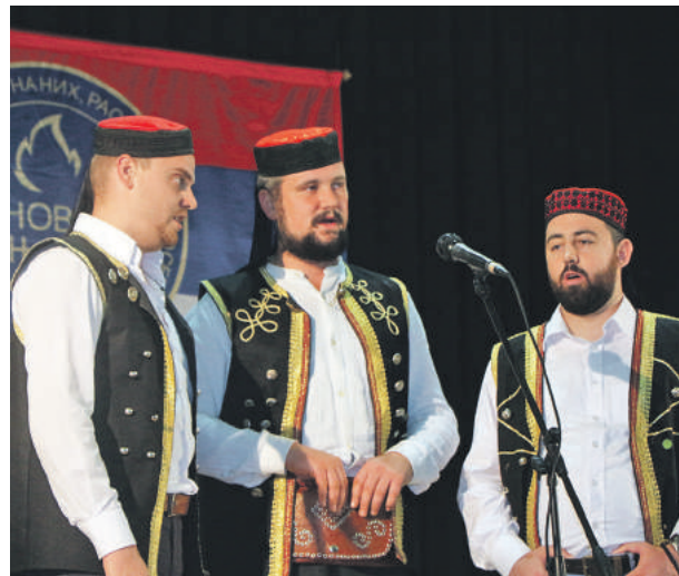
» Крајишка група Плитвице